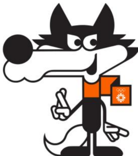
Slika 2. Maskota Zimskih olimpijskih igara Vučko