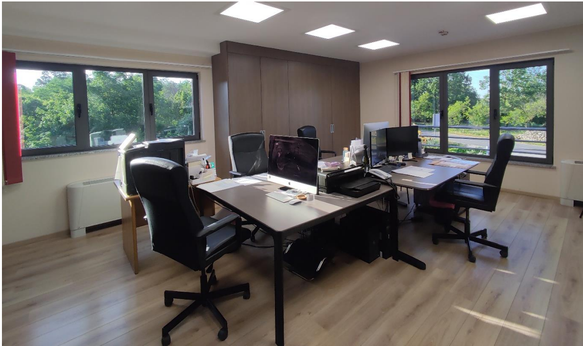
Slika 6. Ured u kojem se obavljaju administrativni poslovi