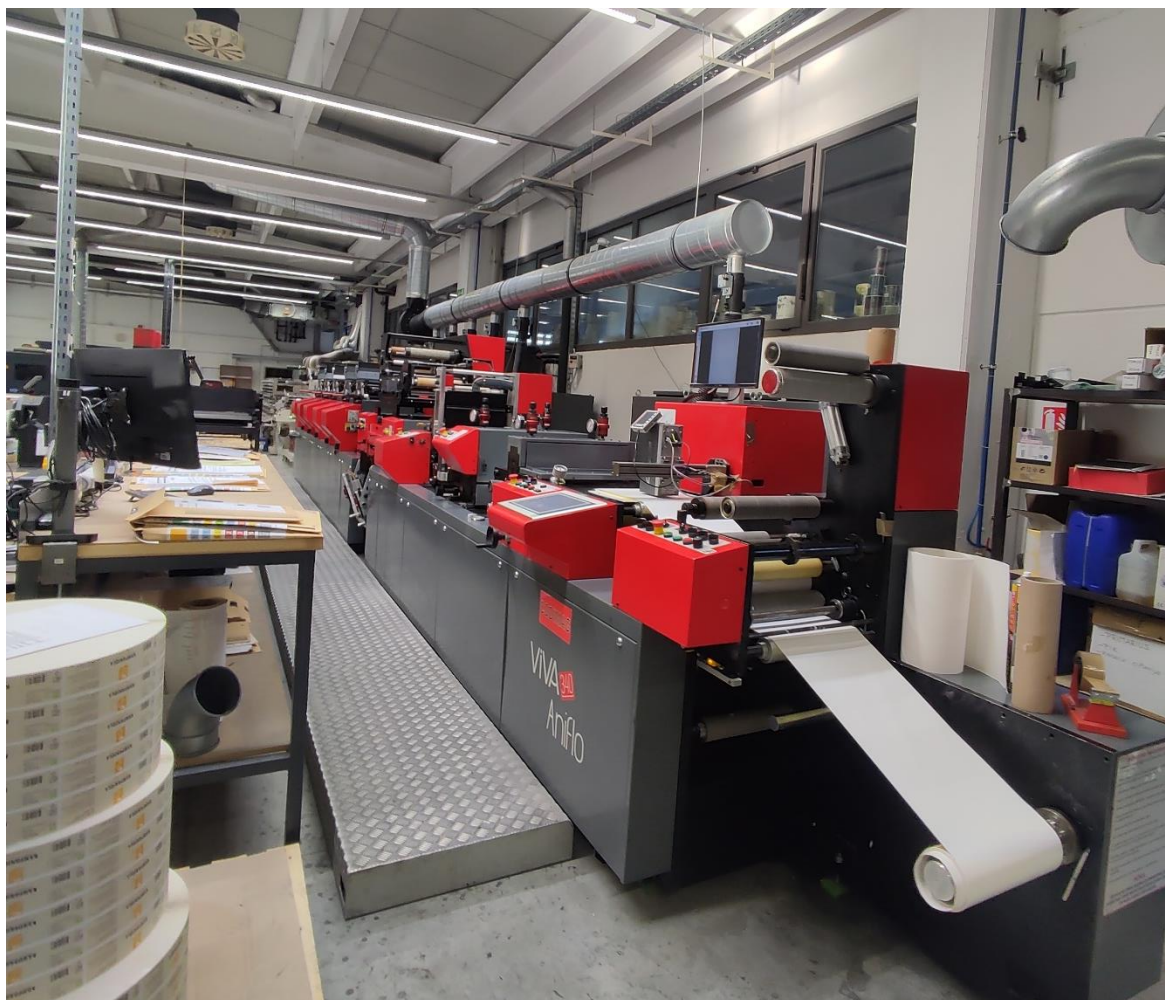
Slika 7. Stroj za offsetni tisak

rukavica, zaštitnih naočala), redovito održavanje stroja kako bi se osigurala njegova ispravnost i sigurnost, te primjenu ergonomskih principa kako bi se smanjilo opterećenje na tijelo operatera. Zatim, potrebno je utvrditi mjere za smanjenje rizika, potrebno je njihovu implementaciju provesti u praksi. To uključuje osiguravanje da su svi operateri tiskarskog stroja upoznati s mjerama i pridržavaju se sigurnosnih postupaka. Također je važno redovito praćenje i revizija mjera kako bi se osigurala njihova učinkovitost i prilagodba promjenama.