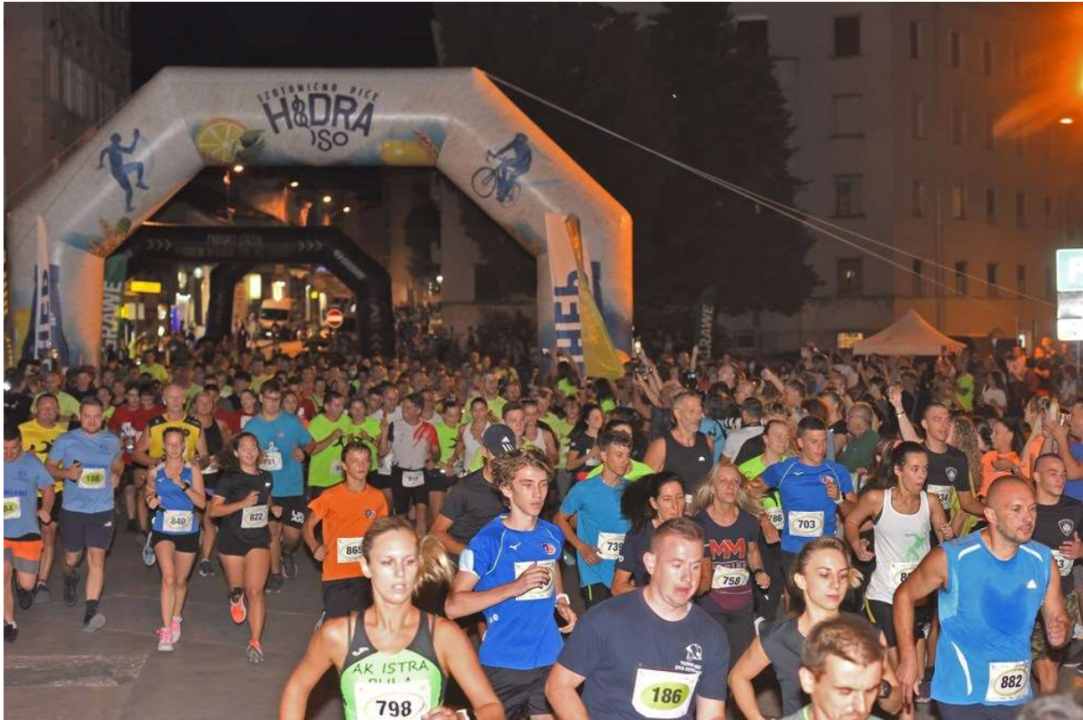
Slika 3: Brojni natjecatelji Pulske X-ice