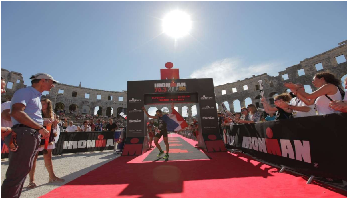
Slika 5: Ulazak u ciljnu Arenu