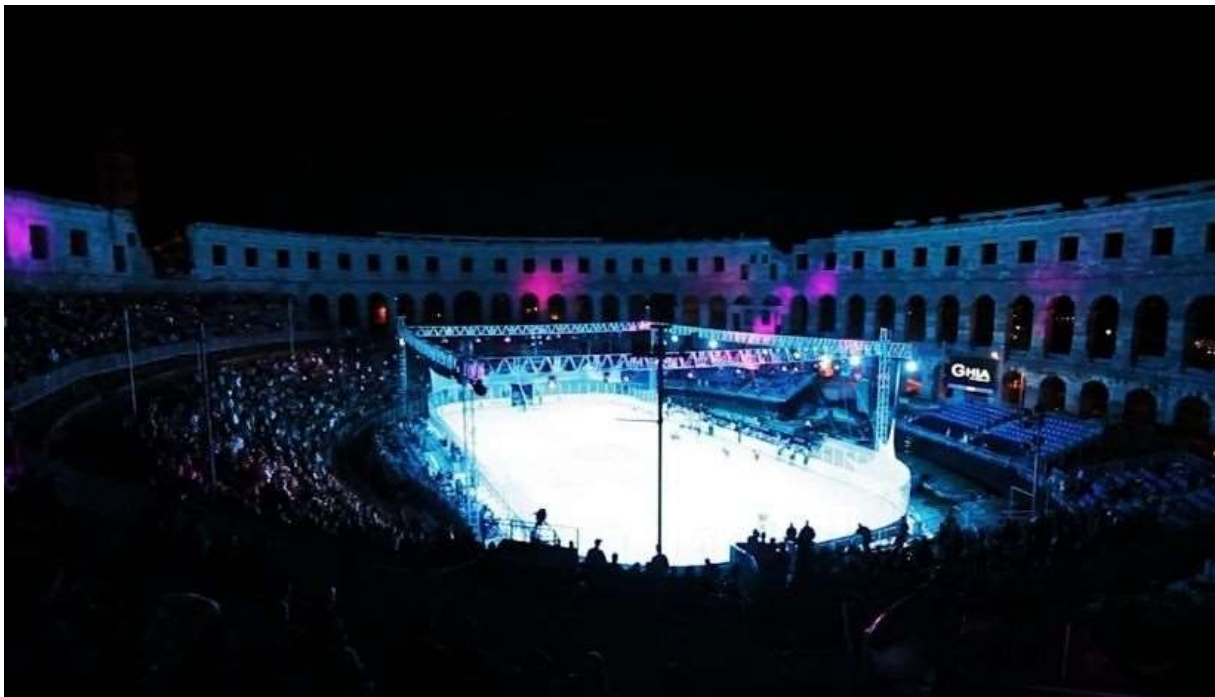
Slika 7: Hokej na ledu u pulskoj Areni