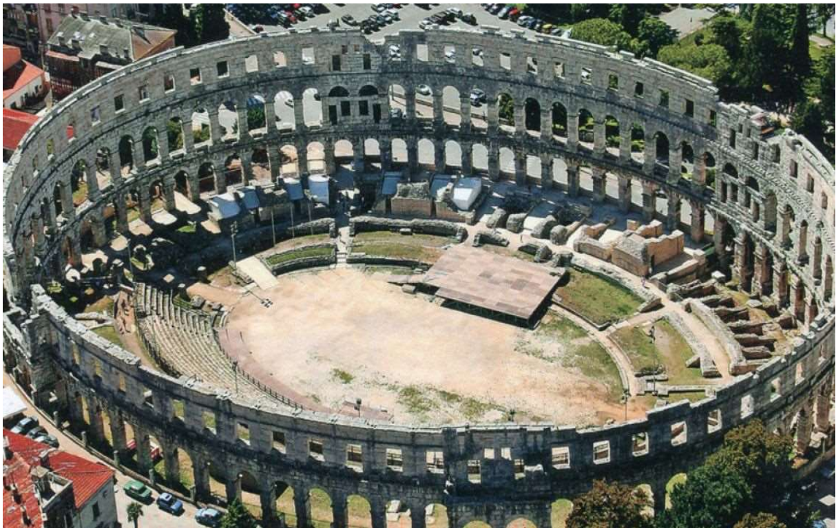
Slika 1: Amfiteatar u Puli