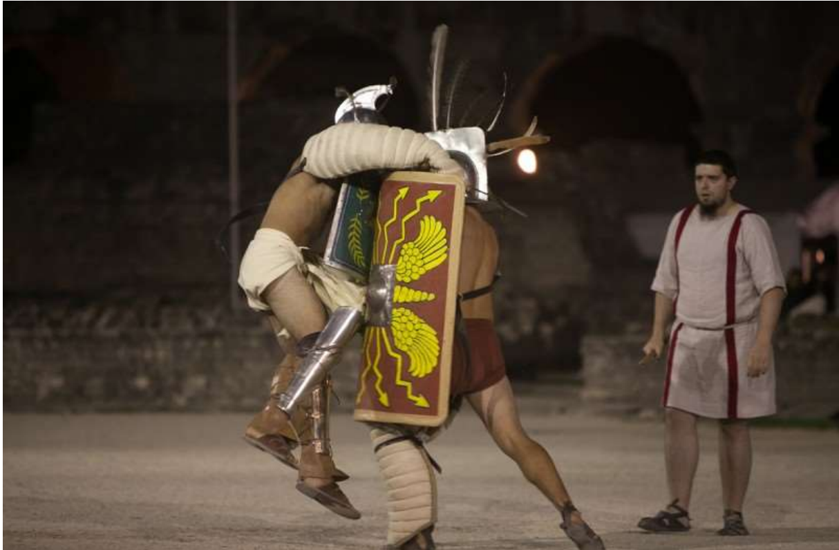
Slika 2: Borba gladijatora