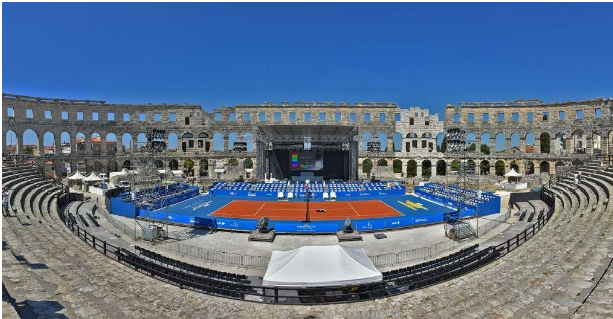
Slika 9: Pulska arena uoči teniskog turnira