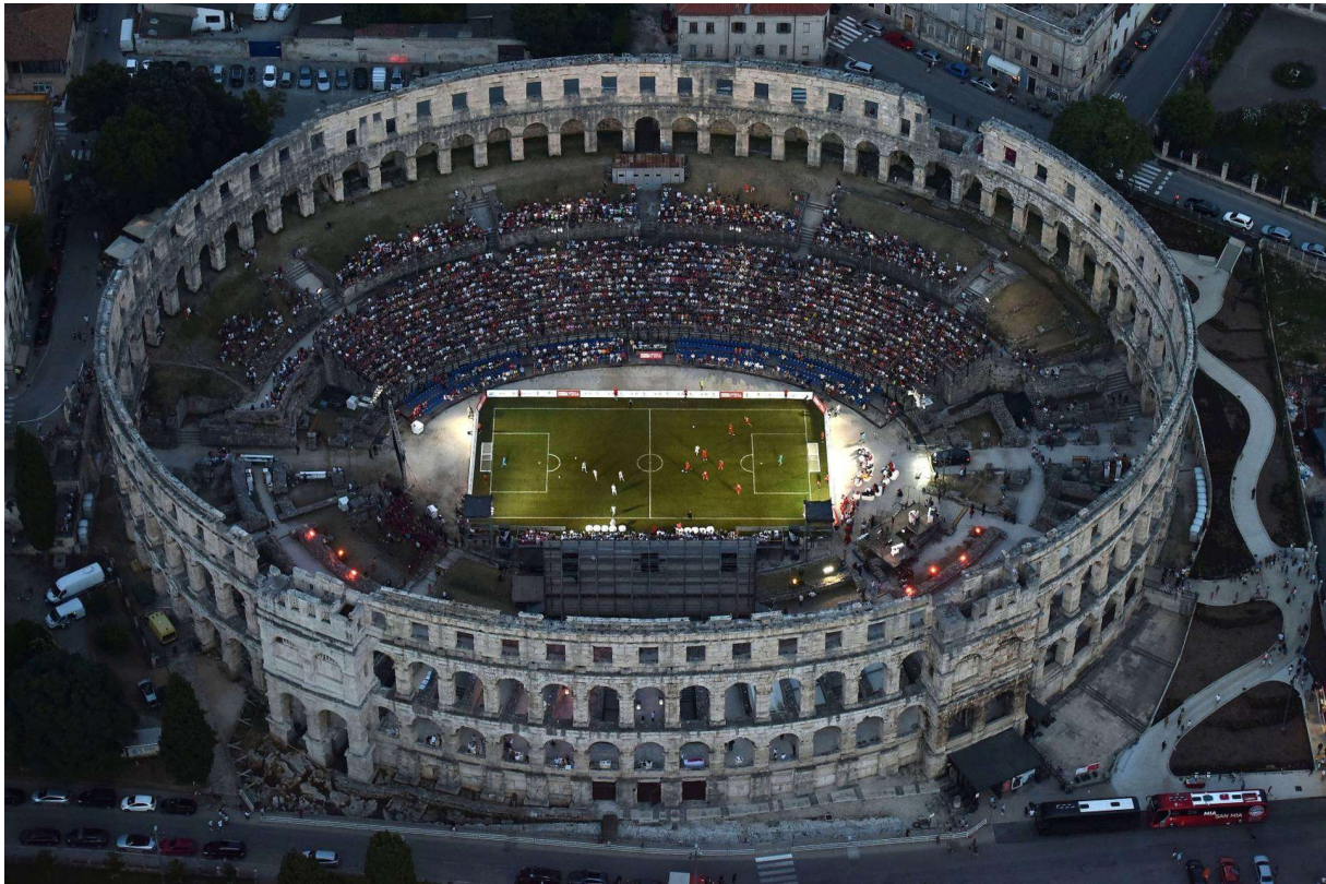
Slika 8: Nogometni spektakl u pulskoj areni