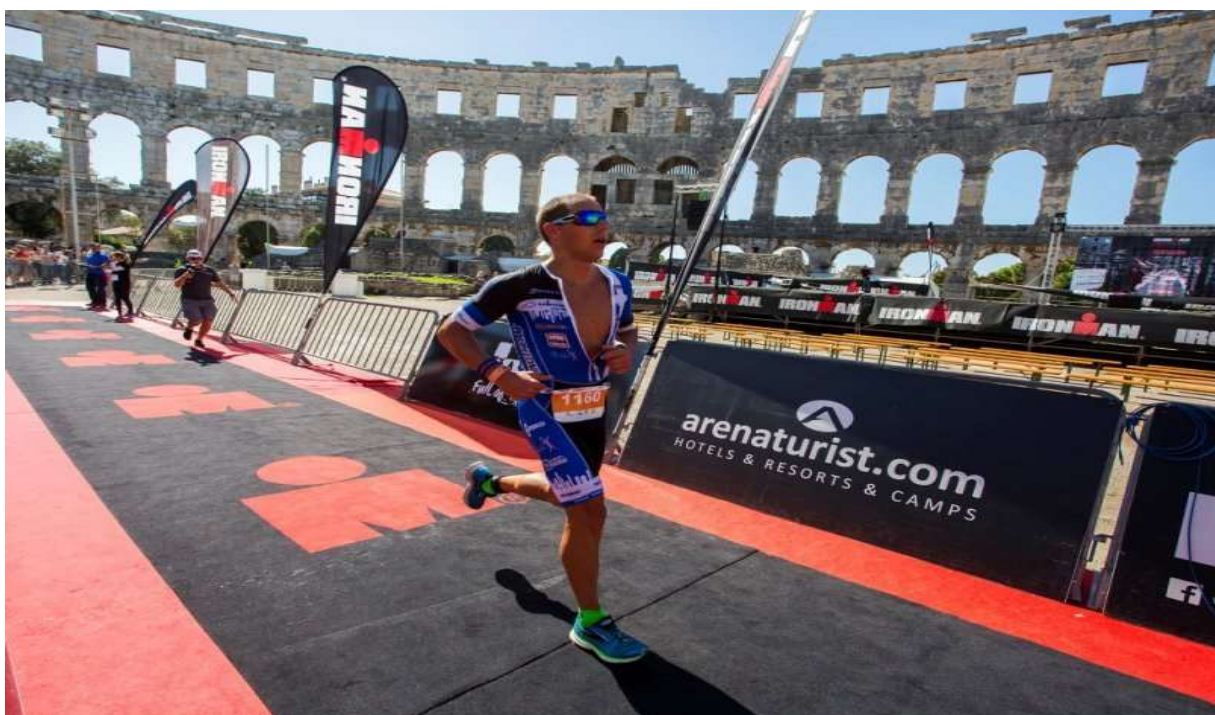
Slika 4: Ironman 70.3 Pula