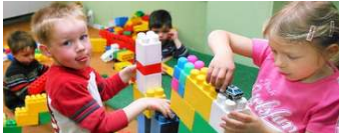
Slika 3. Djeca u vrtiću