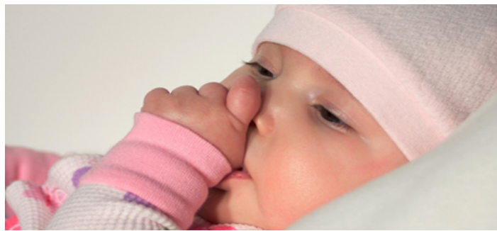
Slika 2. Dijete siše palace

Kad je majka odsutna, ili neka druga osoba o kojoj dijete ovisi, tada nema trenutačne promjene zato što dijete ima sjećanje na majku ili na njezinu mentalnu sliku, ili pak na ono što nazivamo njezinom unutrašnjom predstavom koja je aktivna određeno razdoblje. Ako majke nema toliko dugo da prelazi vremensku granicu koja se može mjeriti minutama, satima ili danima, tada sjećanje ili unutrašnja reprezentacija blijedi. Kada se to dogodi, prijelazni fenomeni postupno gube značenje i dijete ih više ne može doživjeti (Winnicott, 2004).