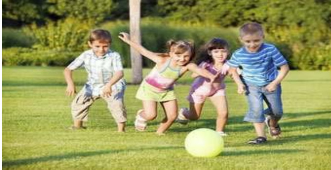
Slika 4. Djeca u igri

„Igra je dječji posao. I stoga pustite nas da se igramo jer putem igre učimo!“ ( Dryden, Vas, 2001 ).