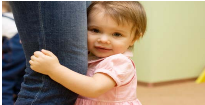
Slika 6. Majka i dijete

Zato neka oproštaj bude kratak i srdačan, u vedrom raspoloženju, te se nasmijte uz mahanje i otiđite! Pokažite djetetu da ste ponosni što je dovoljno veliko da može ići u jaslice ili vrtić i biti ondje bez vas.