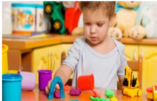
Slika 5. Igračka za dijete do treće godine

„Ako se dijete igra duže vrijeme s određenom igračkom, to je pokazatelj da ste dobro odabrali igračku! No imajte na umu, igračke treba poklanjati s mjerom, a posebnu radost za dijete čine upravo one igračke koje je izradilo ono samo ili zajedno s roditeljima“ (Dryden, Vas, 2000).