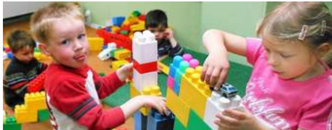
Slika 3. Djeca u vrtiću

„Ukoliko ne znate kako izaći na kraj s problemima separacije, te vam niti jedna metoda ne pomaže, svakako se obratite dječjem psihologu i zapamtite da koliko god ovo bilo teško razdoblje, važno je za emocionalno odrastanje djeteta“ ( Zibar, 2015 ).