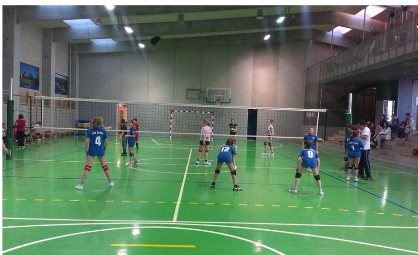
Slika 2. ŽOK Bale – mini odbojka

U prilogu se nalazi trening mini odbojke OK Fažana gdje se detaljnije može vidjeti sam izgled treninga s mlađim uzrastima – Prilog 1.