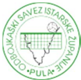
Slika 3. OSIŽ

koje u zajedničkom interesu za članice Saveza treba nastaviti su: utemeljiti višu trenersku školu, organizirati godišnje tečajeve za zvanje odbojkaškoga trenera, organizirati otvoreno prvenstvo županije za djevojčice uzrasta deset i dvanaest godina, organizirati međunarodni odbojkaški kamp za mlade uzraste oba spola, nastaviti rad s mlađim kadetskim selekcijama Saveza te organizirati kup veterana Istarske županije. 22