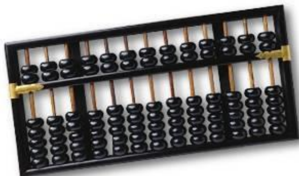
Slika 1. Abacus