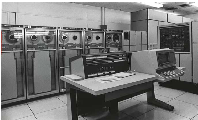
Slika 4. UNIVAC

Prekretnicom za razvoj računala smatra se 1947. godina kada su otkriveni tranzistori. To je smanjilo dimenzije računala, ali i cijene te povećalo pouzdanost i računalnu snagu. Prvo računalo UNIVAC (Slika 6.) koje je napravljeno na ovom principu bilo je za komercijalnu uporabu. Proizvedeno je bilo 1951. godine ( http://www.medskolazd.hr/media/NastavniSadrzaji/Povijesni%20razvoj%20racunala.pdf ).