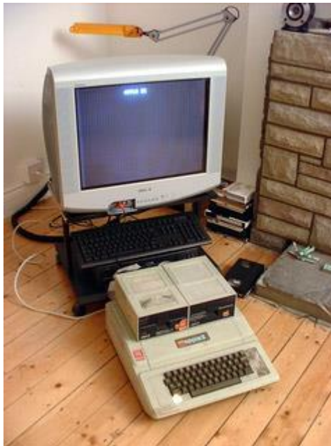
Slika 5. Apple II - prvo stolno, sastavljeno, osobno računalo

dijelova povezanih u cjelinu: tipkovnica, priključak za monitor i ugrađenu programsku podršku. Na tržištu se mogao kupiti za 2500 američkih dolara ( http://www.medskolazd.hr/media/NastavniSadrzaji/Povijesni%20razvoj%20racunala.pdf ).