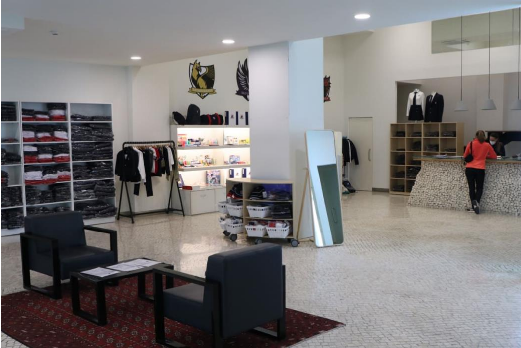
Slika 14. Školski dućan

Škola posjeduje prostoriju u kojoj se nalazi ambulanta te sukladno tome medicinska sestra svakom učeniku ili zaposleniku može pružiti prvu pomoću.