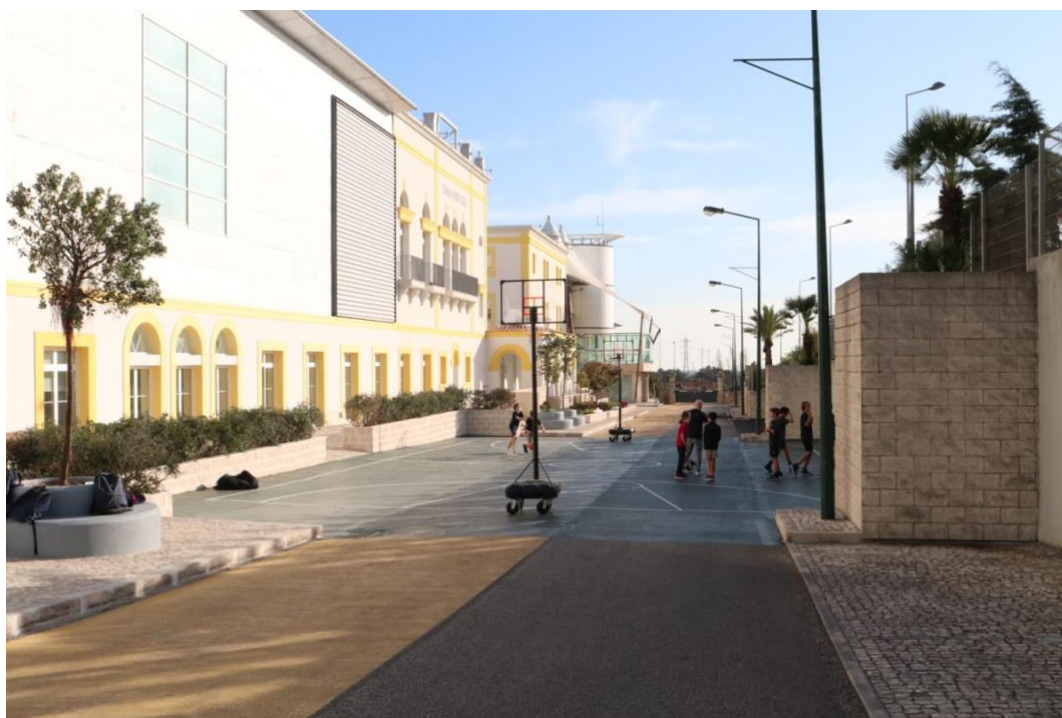
Slika 12. Vanjski sportski teren Izvor: https://www.tasisportugal.org/about/campus

https://www.tasisportugal.org/about/campus/outdoor-spaces