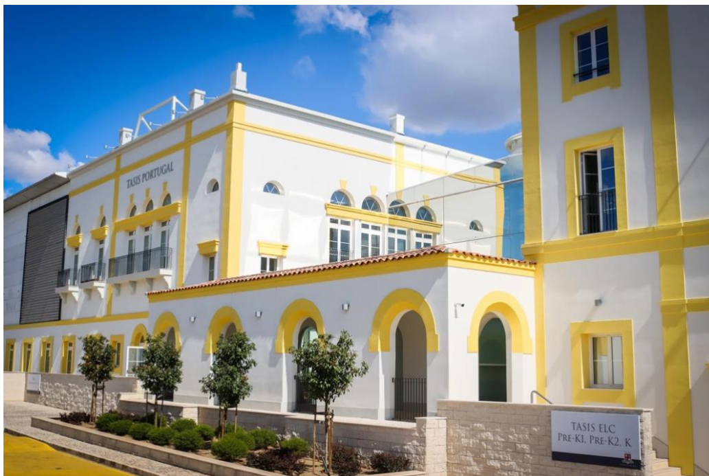
Slika 2. Zgrada Tasis Portugal škole danas

Dijelovi zgrade još uvijek su u renovaciji kako bi se učenicima i zaposlenicima omogućio što kvalitetniji i ugodniji boravak te rad u školi.