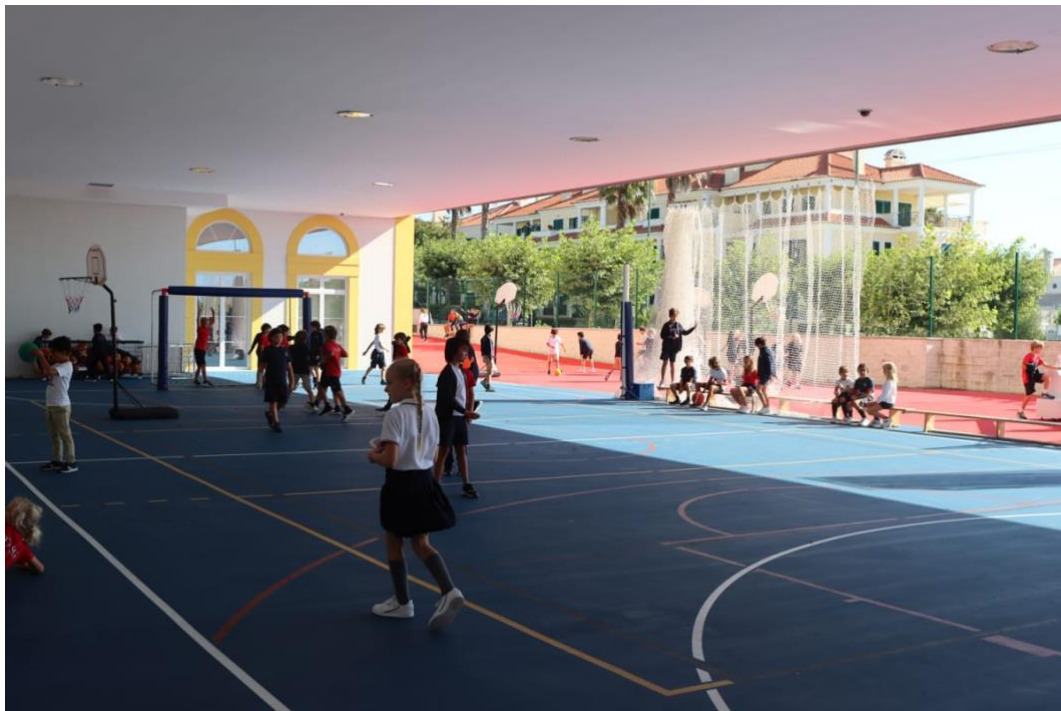
Slika 10. Natkriveni sportski teren

Učitelji i učenici na korištenje imaju tri sportska terena. Tereni služe za igranje nogometa, košarke, odbojke te ostalih tjelesnih aktivnosti.