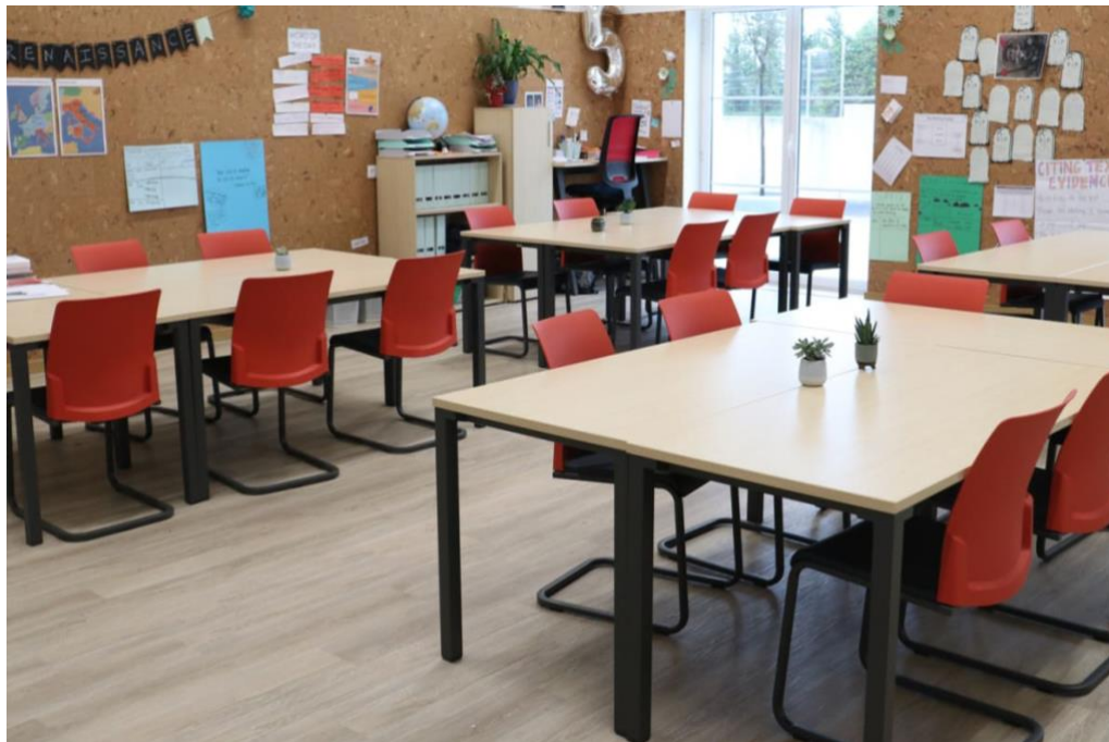
Slika 3. Učionica za 5. razrede

Učitelji se uz pametnu ploču služe magnetnom pločom po kojoj mogu pisati ili postavljati materijale i radove učenika. U učionici se nalaze ormari i police u koje učitelji i učenici pohranjuju svoje materijale za rad i udžbenike. Svaka učionica u prizemlju škole ima dva izlaza od kojih jedan vodi u unutarnji hodnik škole, a drugi na ograđeno vanjsko dvorište te je projektirana tako da pruža veliku količinu prirodnog svjetla.