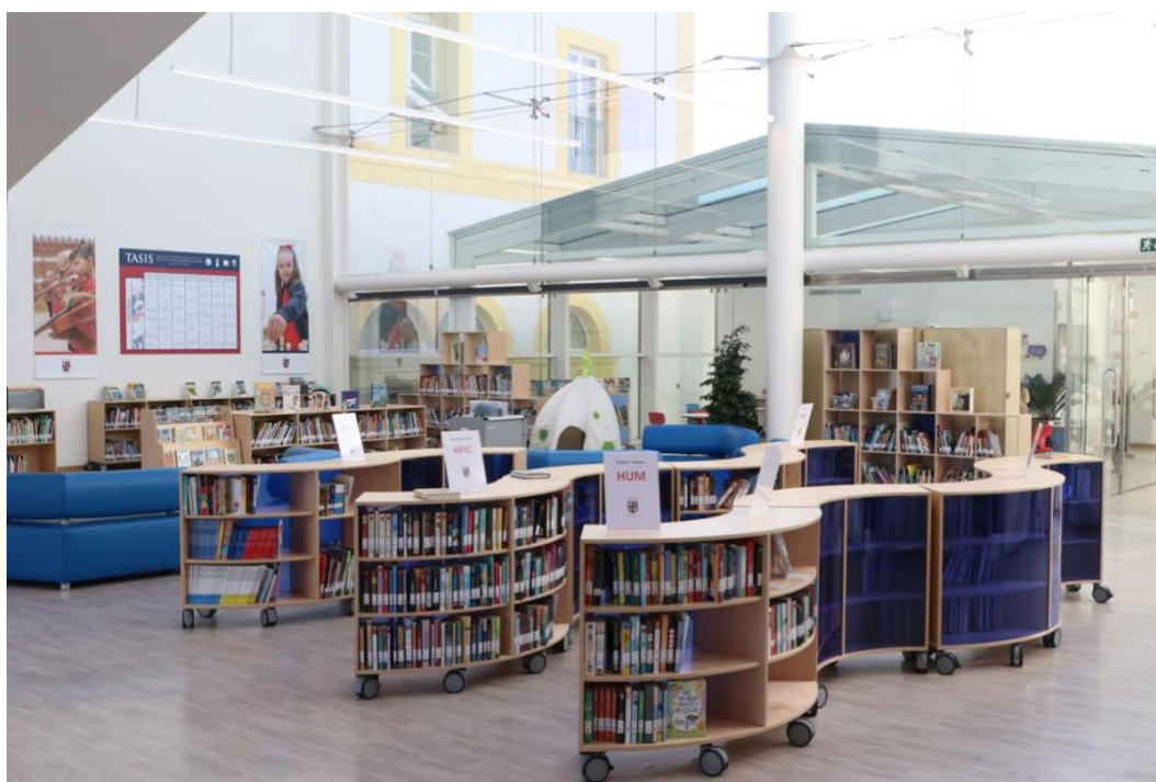
Slika 8. Knjižnica za potrebe nižih razrede osnovne škole i dječjeg vrtića