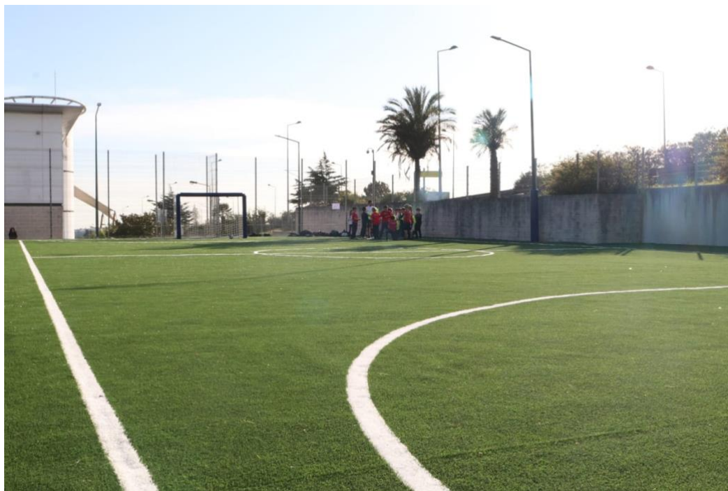
Slika 11. Sjeverni nogometni teren