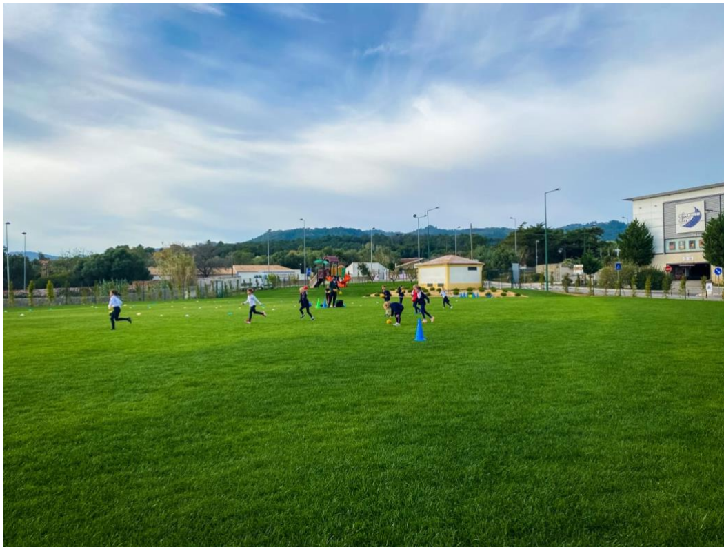
Slika 13. Nogometni teren sa dječjim igralištem