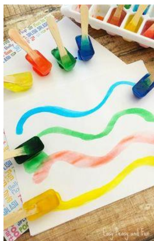
Slika 11. Slikanje obojenim kockicama leda

Idealna likovna aktivnost koja se može provesti ljeti jest slikanje šarenim ledom. Upravo zbog vrućina koje su ljeti prisutne, slikanje ledom je izvrstan način za rashladiti se i zabaviti. Izrada je vrlo jednostavna. U kalup za led sipa se voda koja je pomiješana s bojom npr. za kolače. Kada se voda u kalupu zaledi sve je spremno za likovnu aktivnost. Prilikom crtanja djeca mogu uočiti kako se led topi i ostavlja šarene tragove na bijelom papiru (Slika 11). Ova aktivnost idealna je i za starije vrtičke skupine, ali i školsku djecu, jer se može promatrati promjena agregatnog stanja vode.