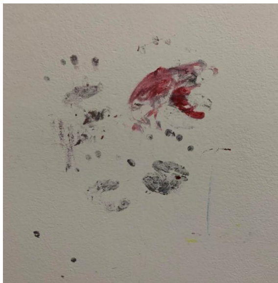
Slika 5. Slikanje 2,5 godišnjeg djeteta prstima na zidu, izvor: osobna fotografija autora