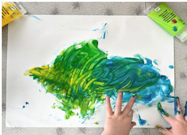
Slika 4. Proizvoljno izražavanje djeteta žutom i plavom bojom, izvor:

https://artfulparent.com/the-best-fingerpaint-for-babies/