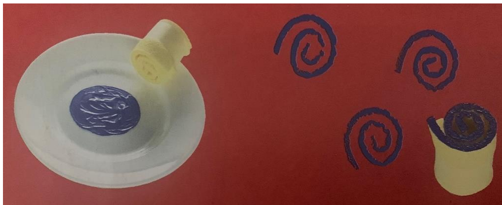
Slika 14. Otiskivanje puževa spužvastom krpicom, Watt, 2003.a:24

Osim otiskivanja uzorka djeca u likovnim igrama mogu izrađivati i pretiske. U ovoj aktivnosti djeca nisu sigurna kako će u konačnici izgledati njihov rad. U ovoj aktivnosti dijete nanosi boju na jednu stranicu papira, a kada završi s nanošenjem boje preklopi papir na pola i lagano dlanom pritiska papir. Kada se papir razdvoji na dobije se pretisak boje koja je prethodno nanesena na papir.