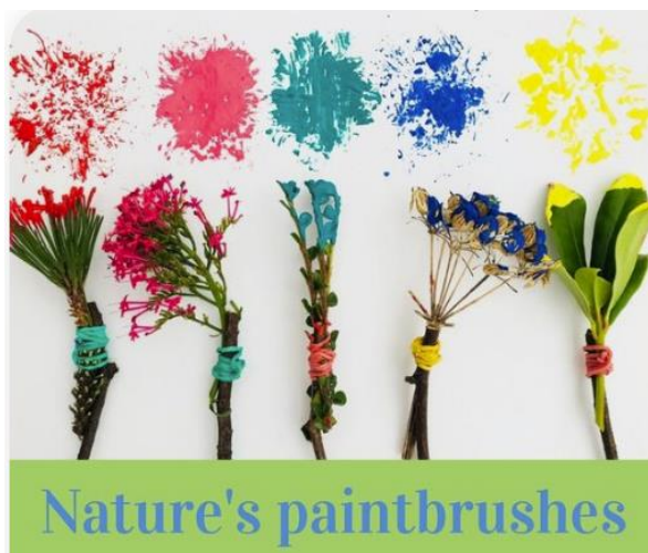
Slika 7. Crtanje suhim grančicama

bilje, zavezali bi ih te započeli crtati po papiru. Naravno, zaštili bi stol i stavili kistove i tempere, dali djeci zaštitnu odjeću te započeli aktivnost. Ovo je vrlo dobra aktivnost za motoriku te je djeci jako zabavna. Prilikom crtanja, vrlo je važno djetetu omogućiti slobodu mašte i izražavanja.