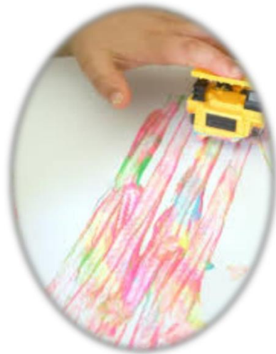
Slika 6. Slikanje kotačićima, izvor:

Likovna aktivnost započinje pripremom radnog mjesta odnosno zaštitom radne plohe novinskim papirom. Zatim se u što više plićih posudica razmuti pola šalice vode s malo tempere. Dijete uzme igračku s kotačima odnosno prijevozno sredstvo, umoči u boju i prijevoznim sredstvom prelazi preko čistog papira (Slika 8) ( https://vrtic-kustosija.zagreb.hr/UserDocsImages/zabavno%20slikanje.pdf ).