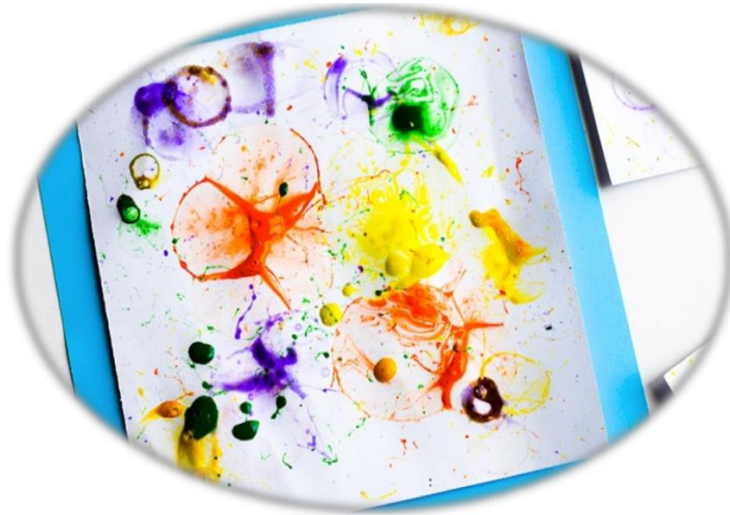
Slika 8. Slikanje balončićima od sapunice