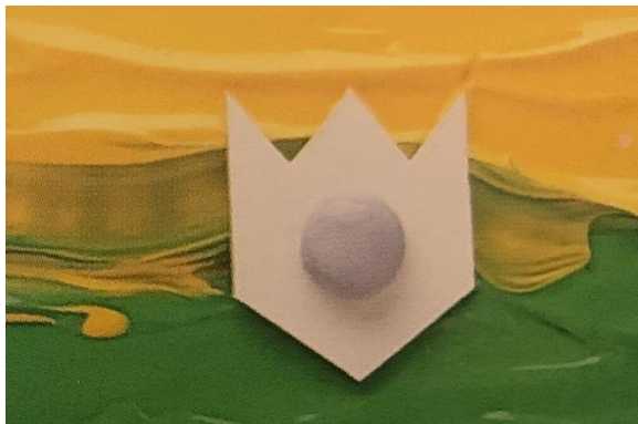
Slika 13. Dvobojno otiskivanje pomoću kartona, Watt, 2003.:18

Djeci pripremimo različite uzorke, na način da na kartončiče zalijepimo tanki konop, gumice za slavine i slične predmete ili karton izrežemo u različite oblike i s gornje strane zalijepimo držak. Nakon toga se istisne akrilna boja na novinski papir, raširi se žlicom, a izrezani kartonski oblik se umoči u boju i otisne na papir. Ako želimo otisnuti novi oblik nužno je opet kartonski oblik umočiti u boju. Ako se prilikom aktivnosti žele izrađivati dvobojni otisci (Slika 11) tada je nužno po novinskom papiru istisnuti dvije akrilne boje jednu pokraj druge (Watt, 2003).