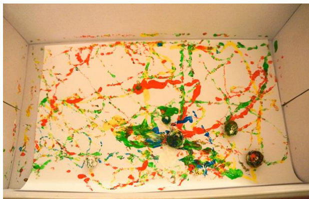
Slika 10. Slikanje kuglicama uz pomoć kutije