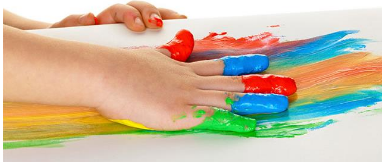
Slika 2. Slikanje prstima

Slikanje prstima omogućuje djetetu razvoj senzibiliteta za likovnost i umjetničko izražavanje. Miješanjem boja i dolijevanjem vode dijete kroz igru istražuje i najspontanije se izražava. Slikanje prstima (Slika 2) je u početku dječja potreba za igrom, a kasnije se razvija kao svjesna djelatnost ( https://vrtic-grigoraviteza.zagreb.hr/default.aspx?id=105 ).