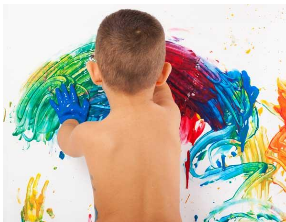
Slika 3. Slobodno slikanje prstima

Slikanje prstima predlaže se već od najranije dobi, a prilikom slikanja preporuka je koristiti se samo crvenom, žutom i plavom bojom (Slika 3 i 4) koja se najčešće istisne na površinu na kojoj se dijete izražava.