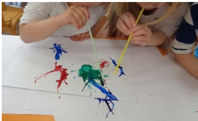
Slika 9. Slikanje puhanjem, izvor:

https://www.cvrca.vt.hr/ieNews/media/9384-DSC06700.JPG