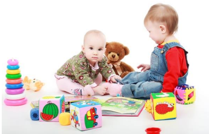
Slika 1. Igra u jaslčkoj dobi, izvor: Smiljić, 2016.

Prema Smiljić (2016) jedna od osnovnih životnih potreba je i potreba djeteta za igrom. Ako navedena potreba nije zadovoljena može doći do stagniranja psihofizičkog, emocionalnog ili socijalnog razvoja djeteta. Djetinjstvo je razdoblje u kojem se igra i učenje isprepliću i međusobno nadopunjavaju. Stoga je igra i oblik i sredstvo odgoja. Veliki dio intelektualnog razvoja, apstraktnog mišljenja, logičkog zaključivanja odvija se kroz igru. Igrom se također potiče i usvajanje različitih pojmova i simbola. Prema Hrvatskoj enciklopediji (2022) u pedagogiji se igra smatra sredstvom odgoja i obrazovanja koju većina autora povezuje s djetinjstvom.