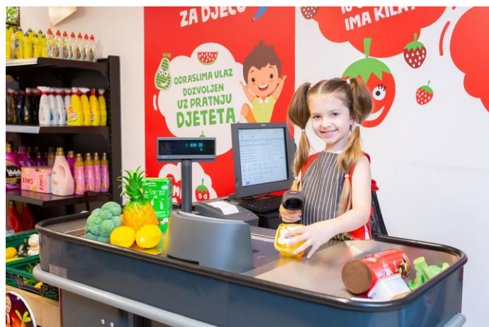
Slika 4. Tematska kućica Konzum prodavaonica