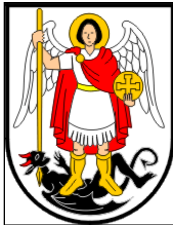
Slika 2. Grb grada Šibenika

Izvor: http://www.sibenik.hr/naslovna , 25. kolovoza 2016.