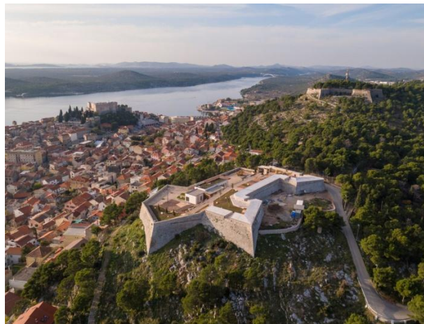
Slika 7. Tvrđava Barone