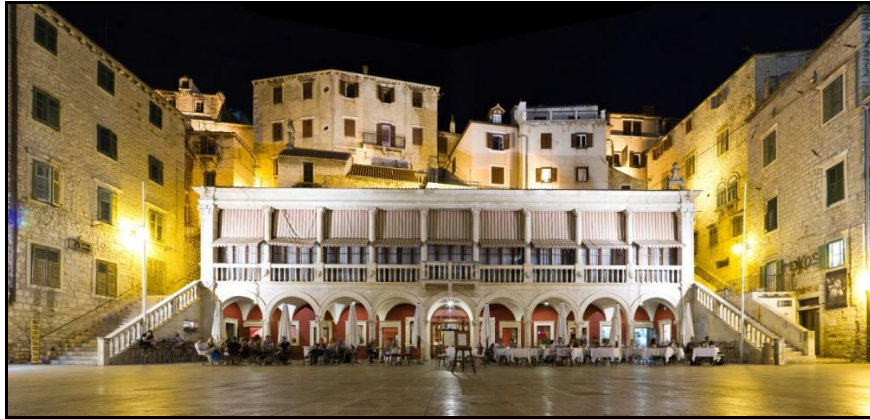
Slika 4. Gradska vijećnica