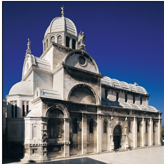
Slika 3. Katedrala svetog Jakova