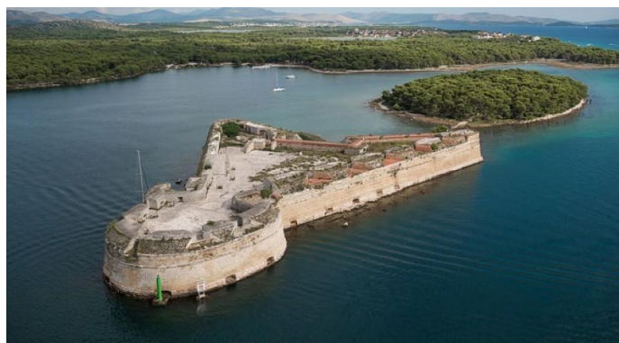
Slika 6. Tvrđava svetog Nikole