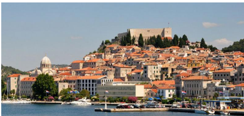
Slika 1. Šibenik