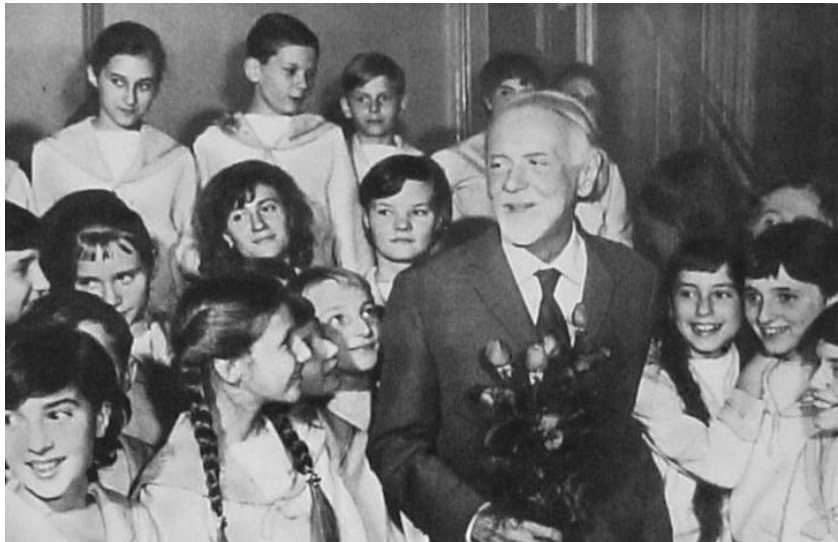
Slika 1. Zoltán Kodály s djecom