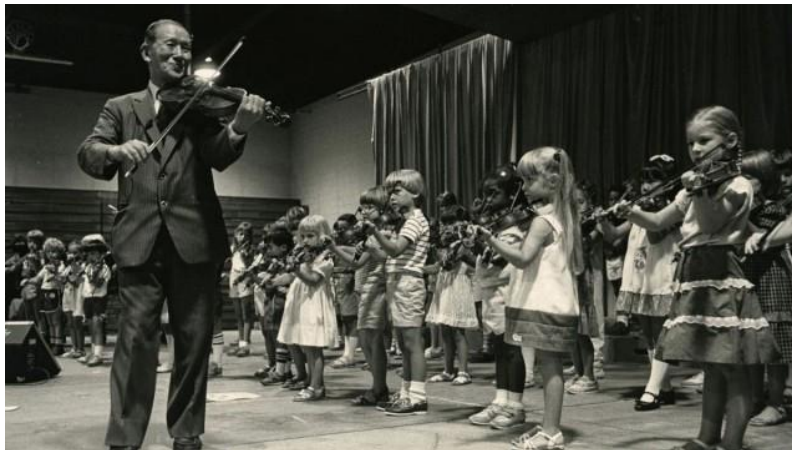
Slika 2. Shinichi Suzuki poučava djecu putem vlastite Suzuki metode