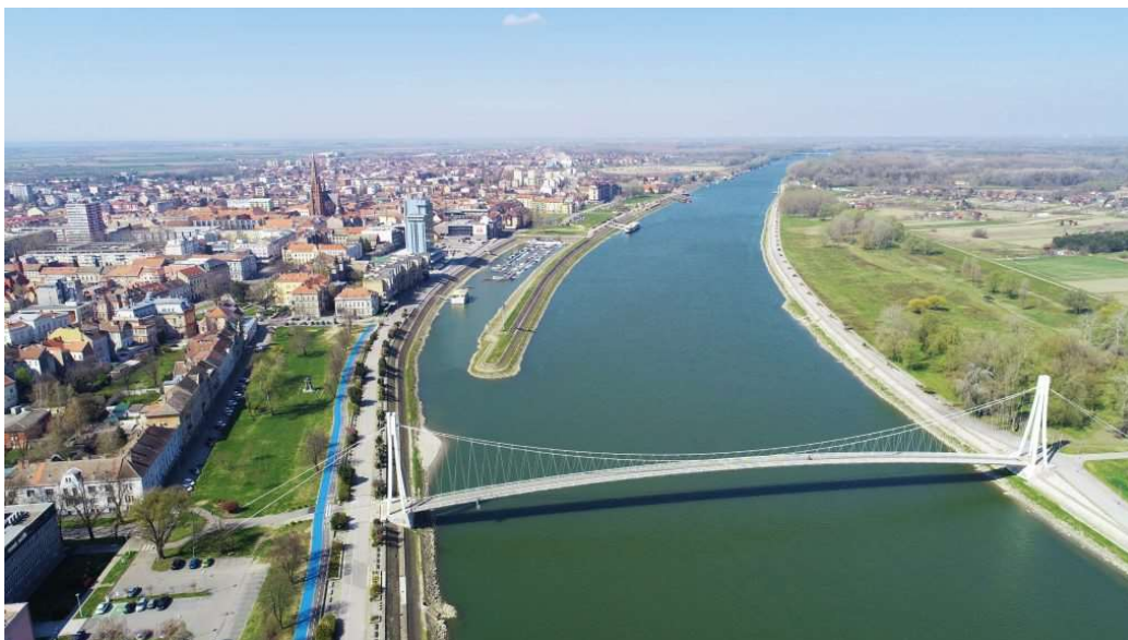
Slika 5. Rijeka Drava i pješački most

Izvor: Google slike, dostupno na: https://www.tzosijek.hr/romansa-drave-i-dunava-79 , 15.04.2024.