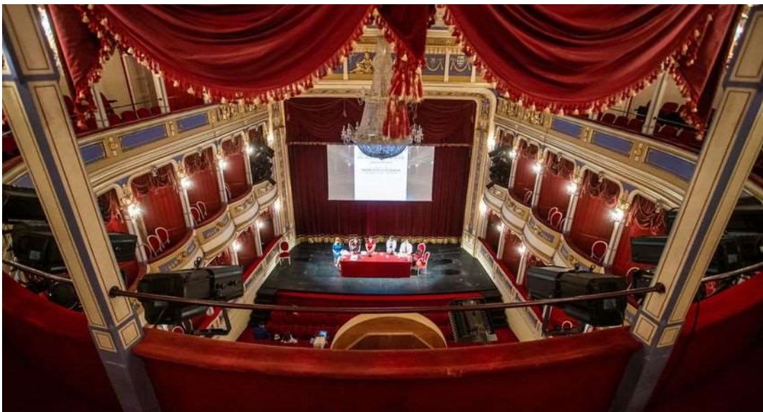
Slika 9. Hrvatsko narodno kazalište u Osijeku