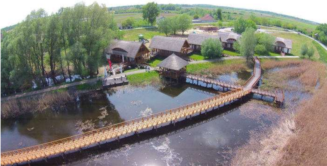
Slika 4. Park prirode Kopački rit