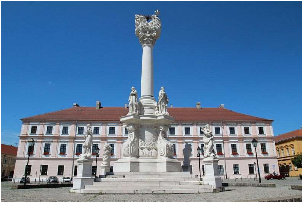
Slika 8. Trg svetog Trojstva