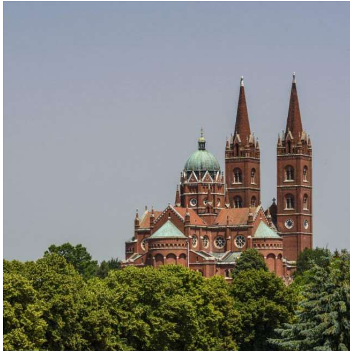
Slika 7. Katedrala sv. Petra u Đakovu