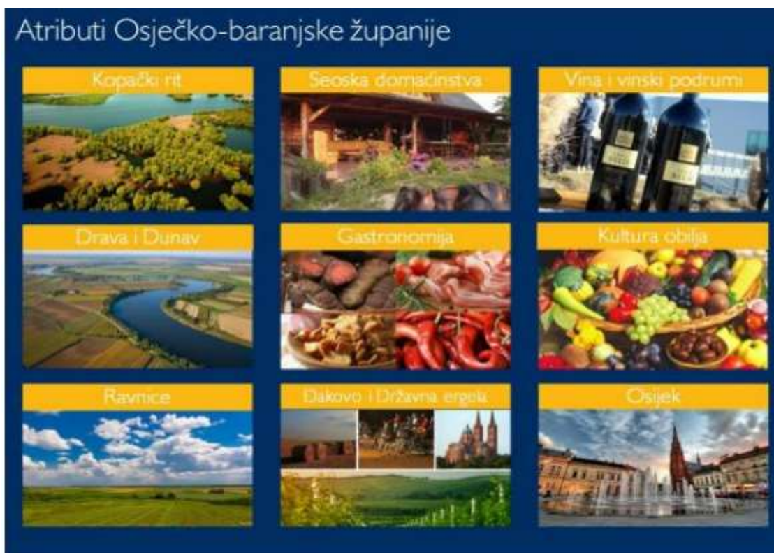
Slika 3. Atributi Osječko – baranjske županije