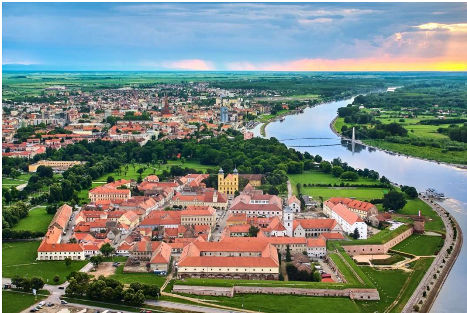
Slika 6. Tvrđa