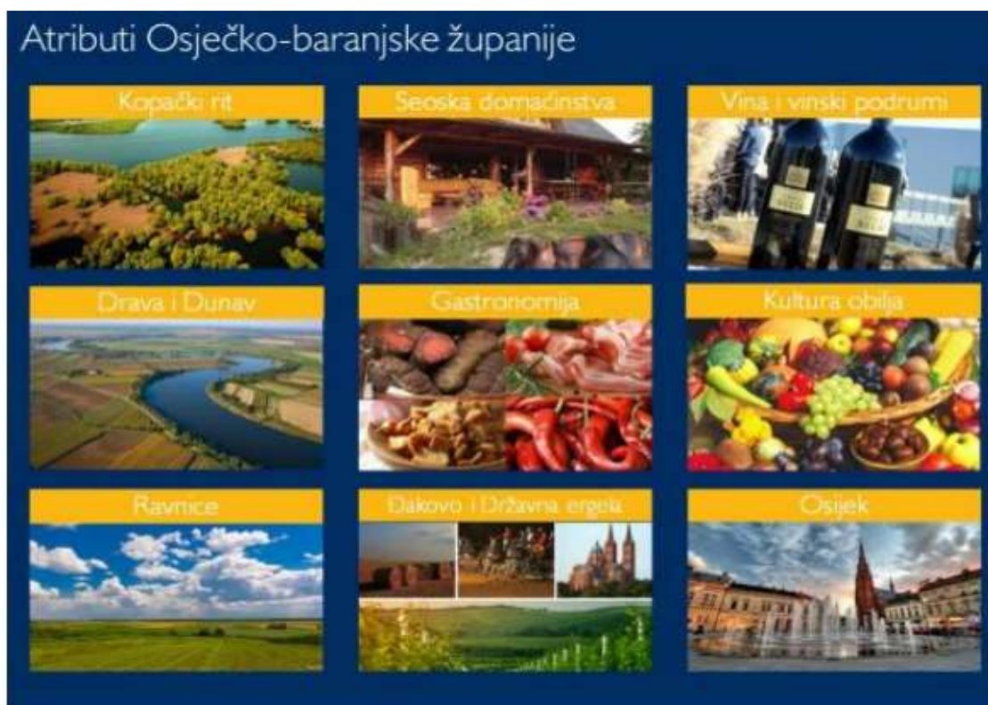
Slika 3. Atributi Osječko – baranjske županije