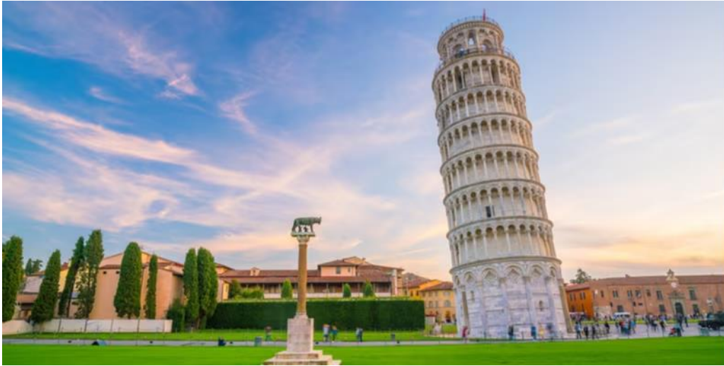
Slika 5: Torre Pendente ili Kosi toranj