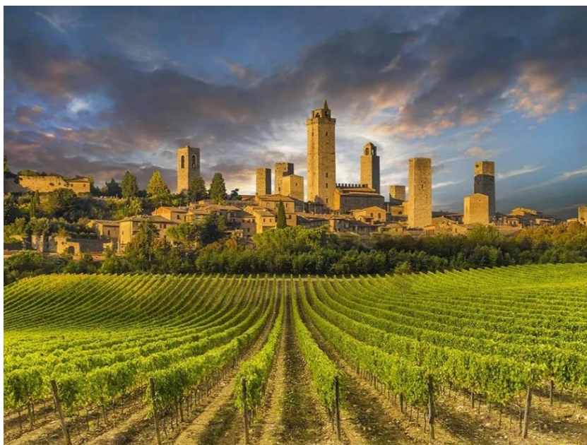
Slika 6: San Gimignano