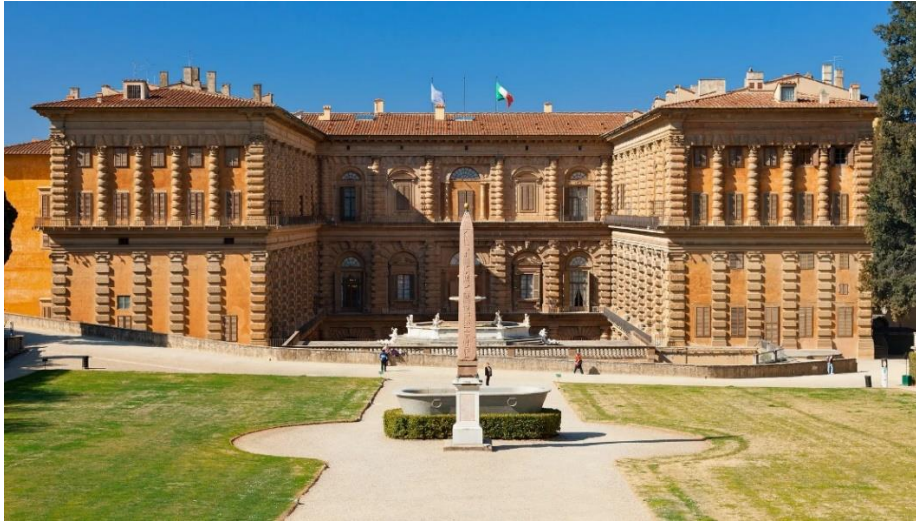
Slika 8: Palača Pitti