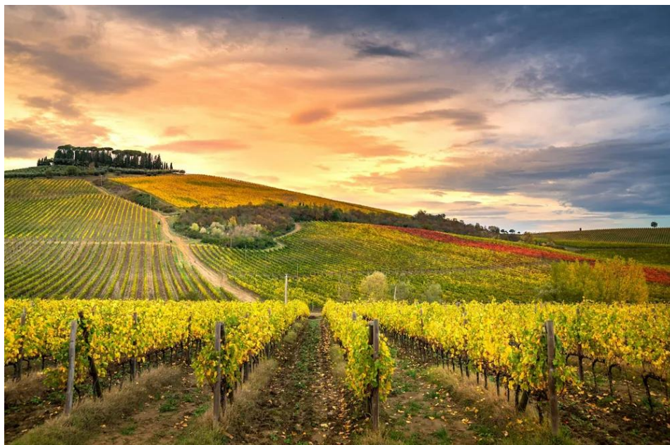
Slika 1: Regija Chianti