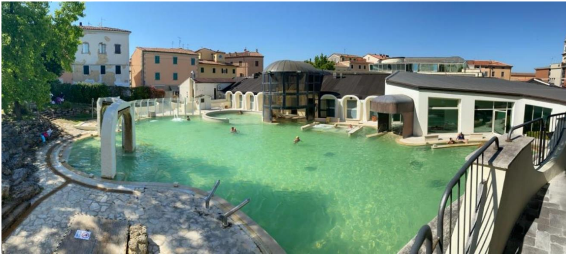
Slika 23: Terme di Casciana