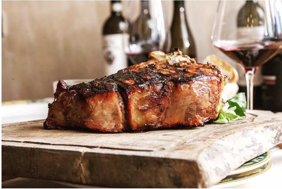
Slika 10: Bistecca alla fiorentina