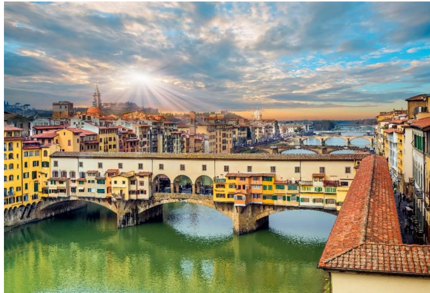
Slika 3: Ponte Vecchio