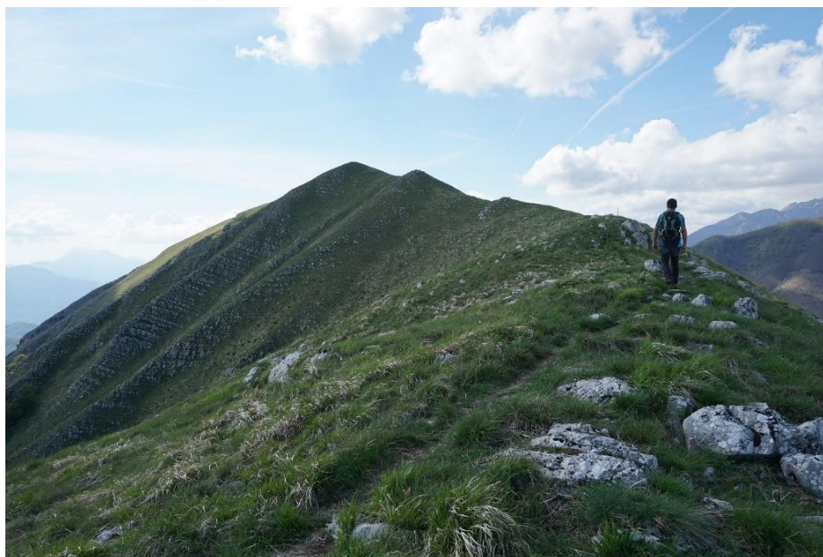
Slika 20: Planina Pratofiorito