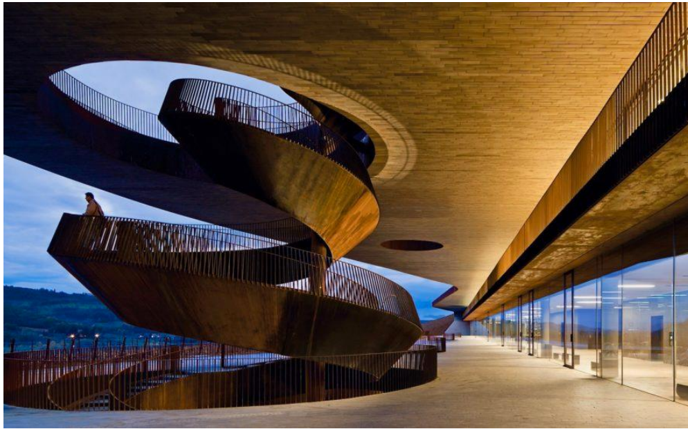
Slika 15: Vinarija obitelji Antinori izgrađena 2012. godine