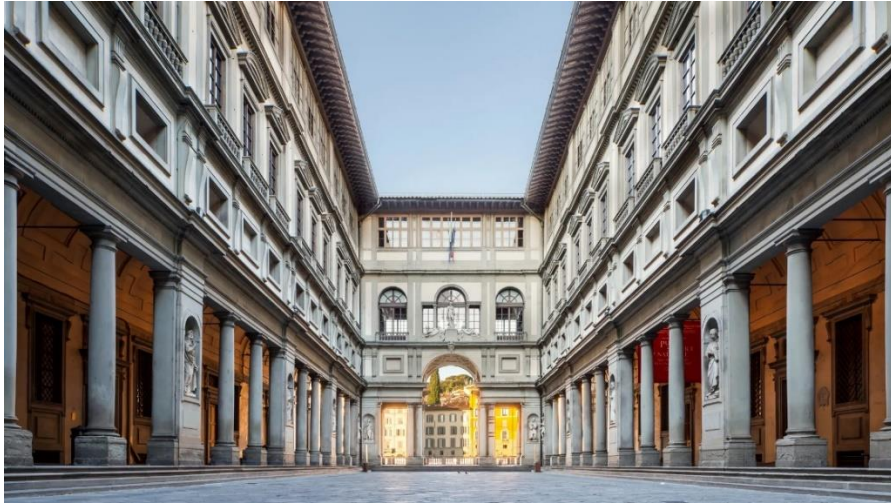
Slika 7: Galerija i muzej Uffizi