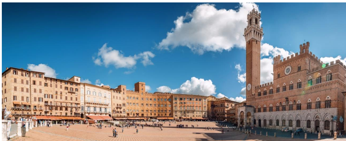
Slika 4: Piazza del Campo