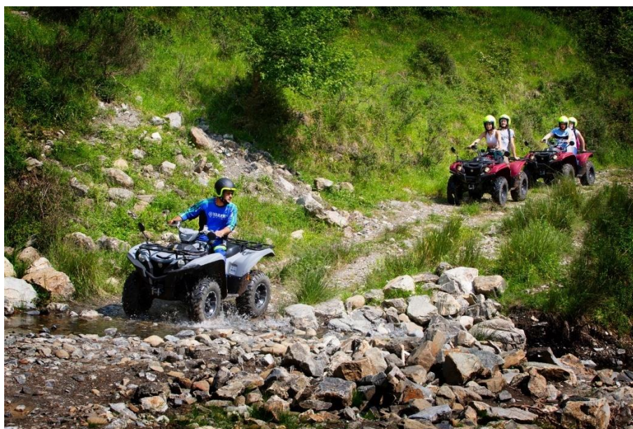
Slika 19: Izlet quadom, Val di Lima