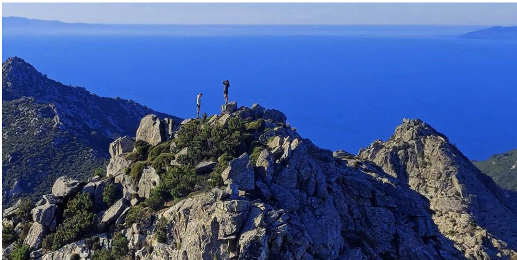
Slika 17: Planina Monte Capanne