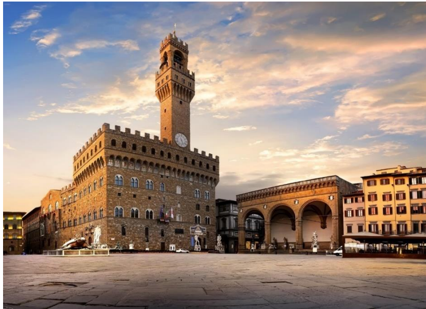
Slika 9: Palača Vecchio