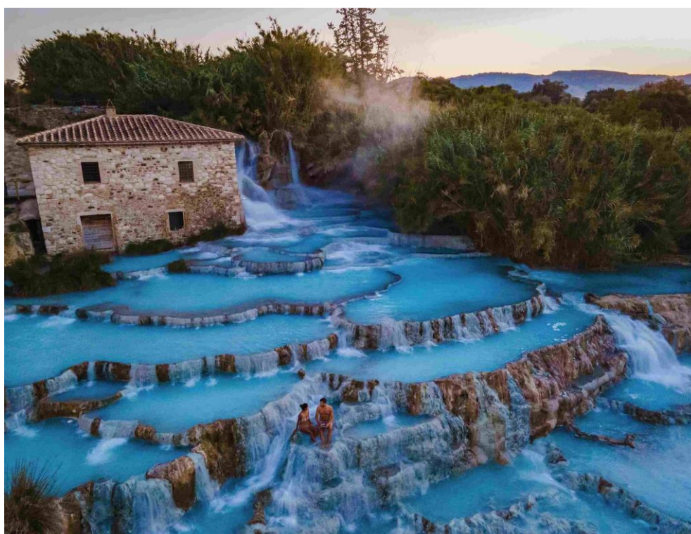
Slika 22: Terme di Saturnia