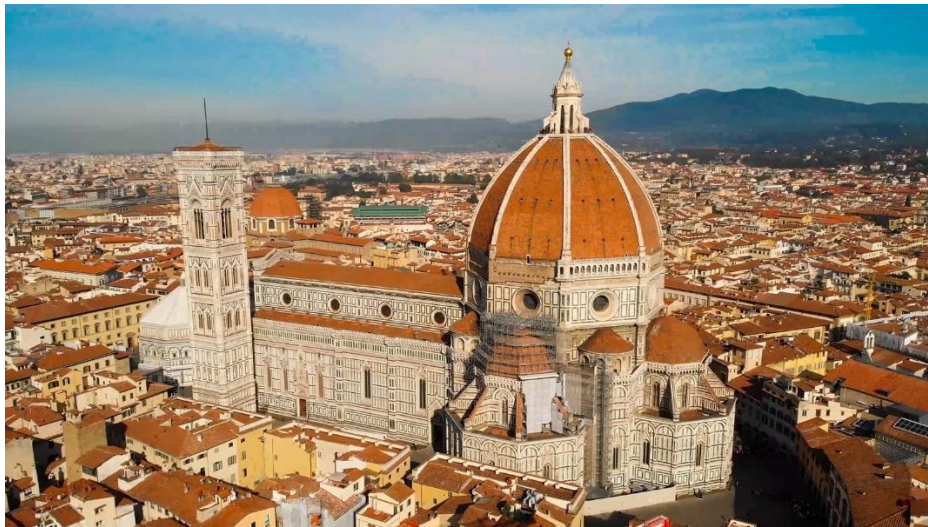
Slika 2: Firentinska katedrala