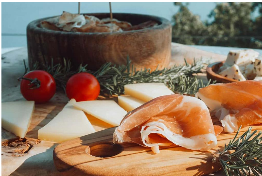
Slika 11: Cinta Senese