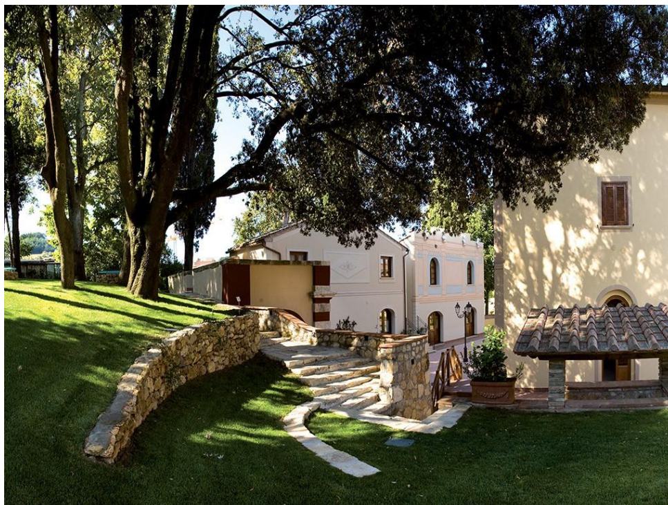
Slika 24: Villa Borri