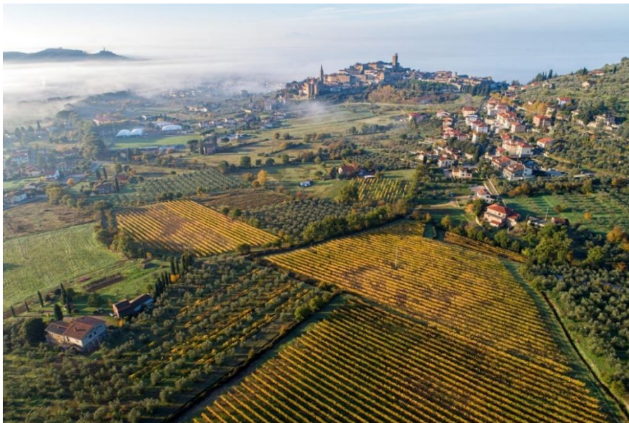
Slika 14: Terre di Arezzo