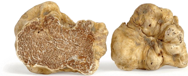
Slika 12: Bijeli tartuf: Tuber Magnatum Pico