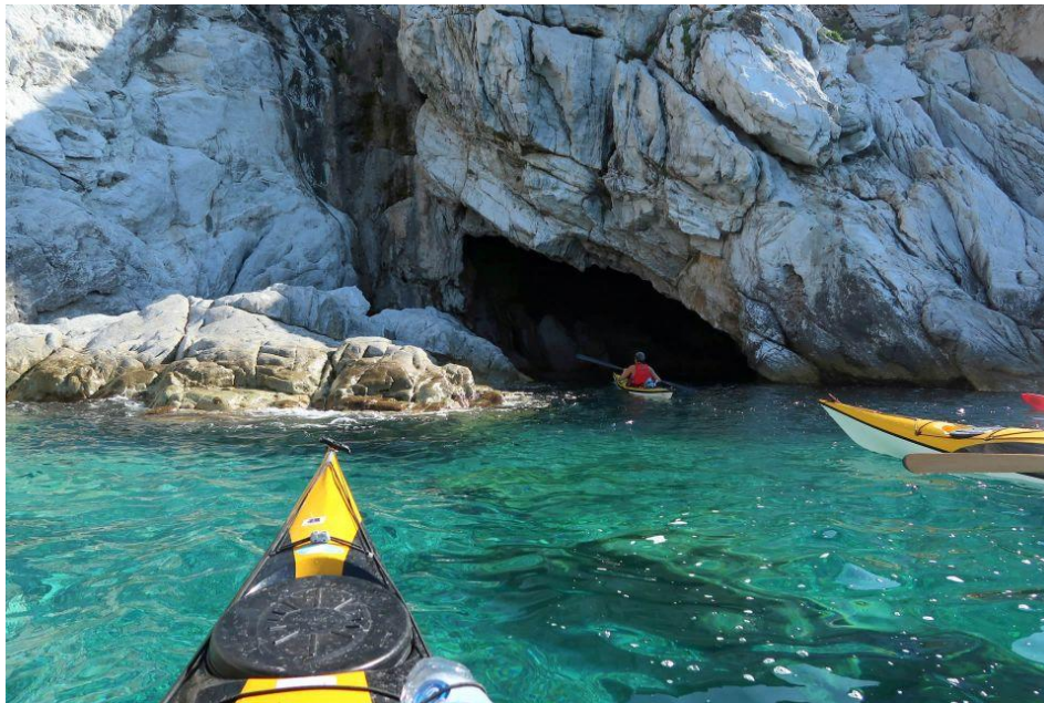
Slika 16: Kajaking, otok Elba