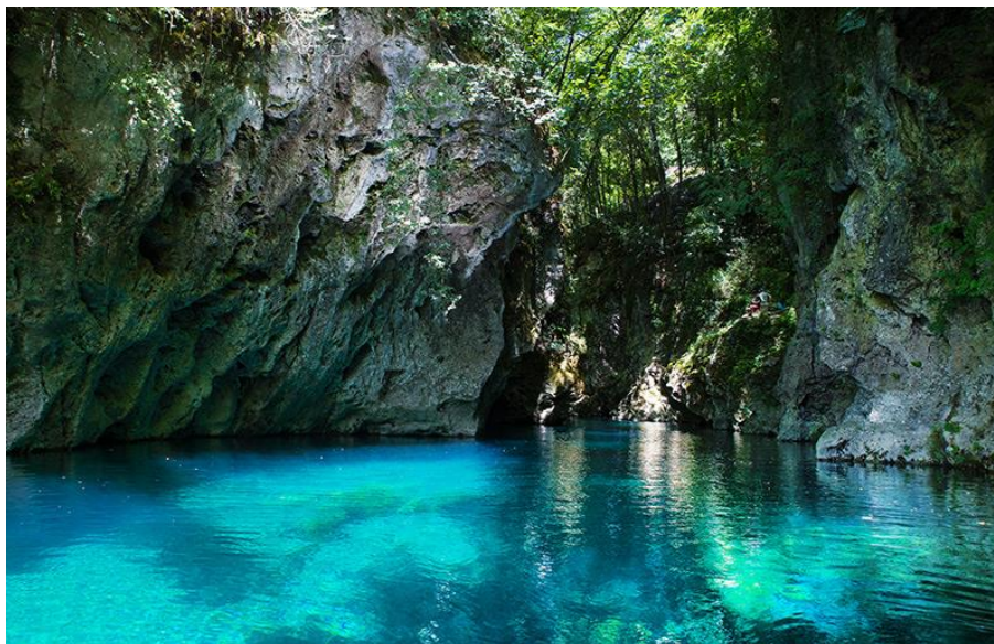
Slika 18: Val di Lima