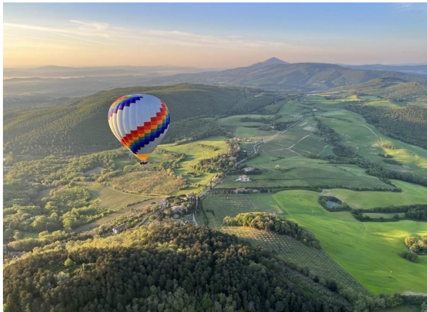
Slika 21: Balon na vrući zrak, Val d'Orcia