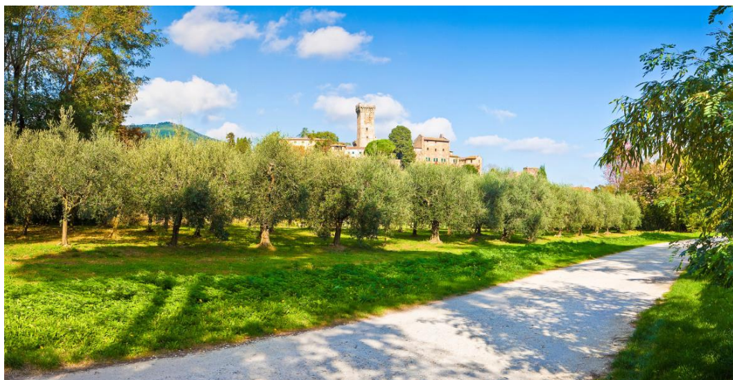
Slika 13: Strada dell'Olio dei Monti Pisani