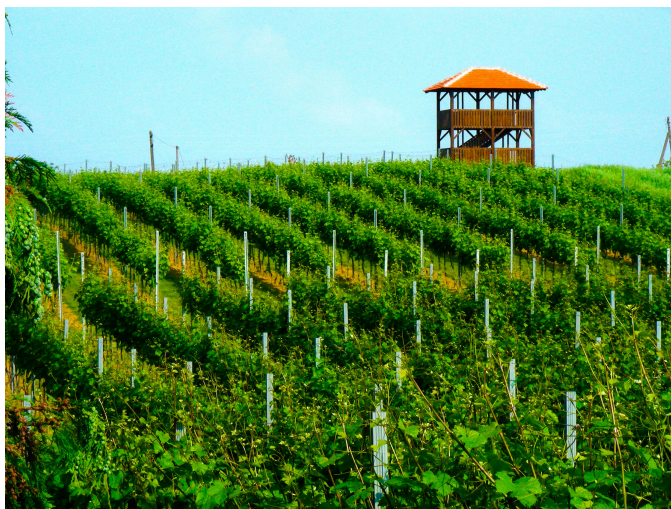
Slika 13. Bilogora