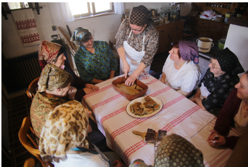
Slika 8. Posluživanje pogače s orasima

Kao što je već spomenuto, pogača z oreji , odnosno pogača s orasima (Slika 8.), upisana je na listi zaštićenih nematerijalnih kulturnih dobara od 2017. Zaštitu pogače pokrenula je đurđevačka Udruga žena. Priprema se od pet sastojaka, brašna, vode, soli, šećera i oraha. U posljednjih je 50 godina neizostavni kolač na izložbi Picokijade . 68 Uz nju se još na izložbi kolača prezentira i Svetojanska zlevanka.