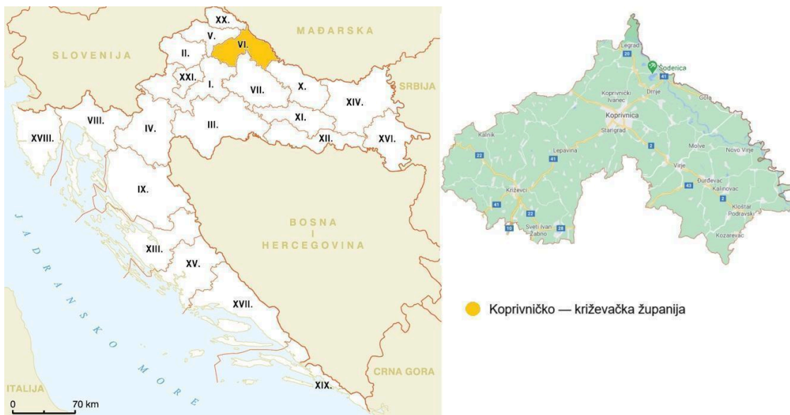
Slika 1. Republika Hrvatska i Koprivničko-križevačka županija

Grad Križevci jedino su veće naselje na tom području, dok ostala naselja karakterizira ruralna atmosfera s negativnim demografskim trendovima. Koprivničko-križevačka županija smještena je u Panonskoj regiji i pripada centralnim županijama Republike Hrvatske. 2