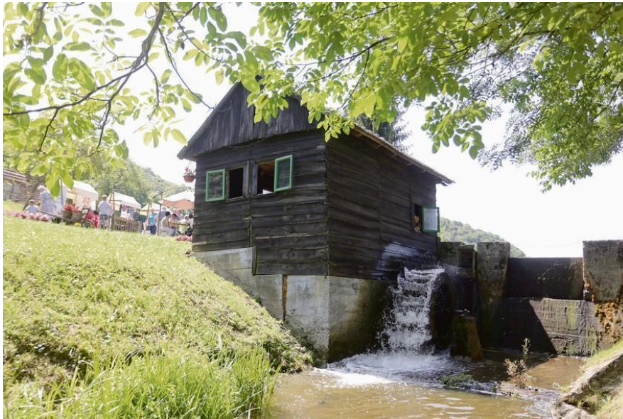
Slika 6. Vodenica Sveta Ana

godine, a potpomognuta je Vodenicom Svete Ane (Slika 6.), odnosno kukuruznim brašnom koje se izrađuje u vodenici. 49 Rene Lovrenčić i Paškal Cvekan tvrde da se gradina iznad Svete Ane prvotno nazivala Tybonyncz , međutim, Ranko Pavleš to osporava analizirajući popise poreza s početka 16. stoljeća. Ti popisi jasno ukazuju da je Tiboninec bio u kotaru Rača, dok je Sušica bila u kotaru Komarnica. Stoga se zaključuje da su to bile dvije potpuno različite gradine. 50