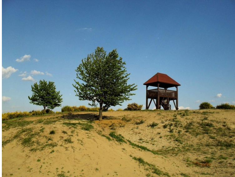
Slika 12. Đurđevački pijesci

Radovan Kranjčev također je pokušao vratiti nestalu crnkastu sasu u rezervat, ali unatoč uspješnom presađivanju 1982., vrsta je ponovno nestala te je sadnja ponovljena 2005. 78