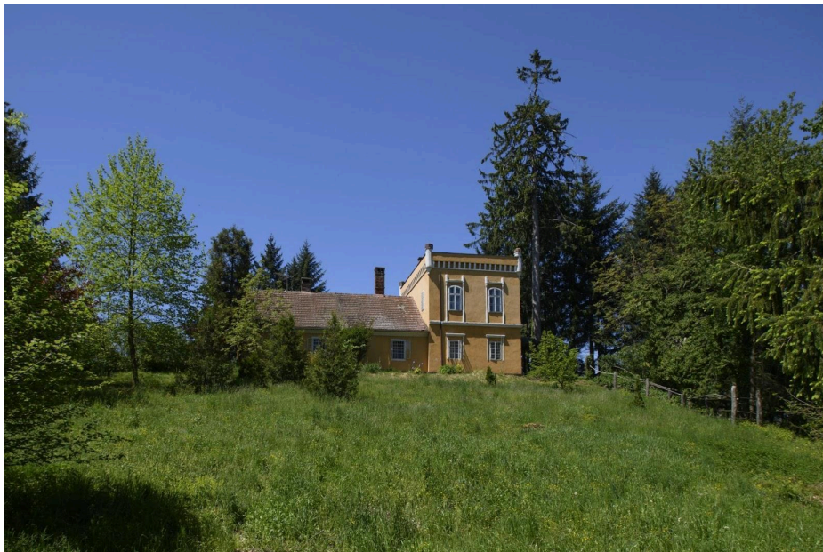
Slika 5. Dvor Barnagor

Dvor Barnagor (Slika 5.) nalazi se u susjednom selu Čepelovac. Ovaj seoski posjed prema usmenoj predaji izgrađen je uz zamisao Petra von Trezića koji posjed i titulu dobiva prema zaslugama u bitci kod Solferina 1859. Izgrađen je u godinama 1862. – 1867., L — osnovom uz unutarnje dvorište i s izdvojenom obrambenom kulom. U turističkoj ponudi se mogu izdvojiti galerijski prostori, dvorište, Kazalište u šumi uz šumske drvene stube i Park pijetlova; nudi organizaciju ekološkog i seminarskog turizma, promocije umjetničkih fotografija, promocije etno-glazbe i knjiga, foto-safari i radionicu keramike. 48