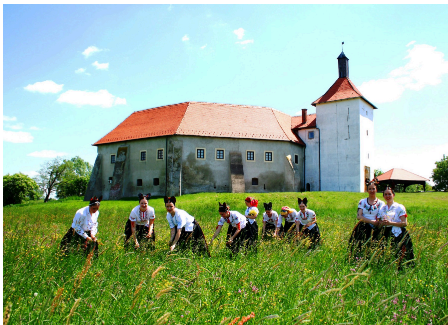
Slika 10. KUD „Petar Preradović” i Đurđevčice

Kulturno-umjetničko društvo „Petar Preradović” (Slika 10.), nastaje 1873. i djeluje kroz razne oblike kulturnih djelatnosti, uz tamburašku, folklornu, likovnu, dramsku sekciju i pjevački zbor. Njihov se repertoar sastoji od 12 koreografija i 30-ak instrumentalnih, vokalnih i vokalno-instrumentalnih izvedaba. Đurđevčice su vokalni ženski ansambl nastao krajem 19. stoljeća. 70