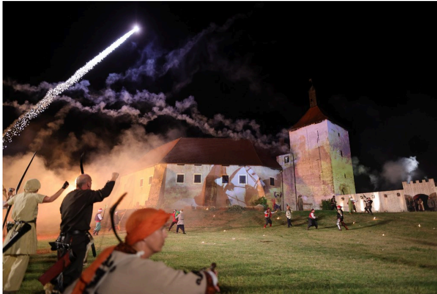
Slika 7. Prikaz legende na sceni