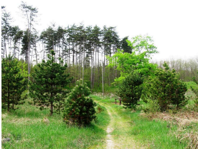
Slika 15. Park šuma Borik

U šumi je 2021. dovršen projekt izrade hotela za djecu, gdje su ukupni prihvatljivi izdaci projekta iznosili 17.319.657,97 HRK. Projekt izgradnje hostela za djecu sufinancirala je Europska unija, Europskim fondom za regionalni razvoj (ERDF) u sklopu Operativnog programa Konkurentnost i kohezija 2014. – 2020. , s ukupnim iznosom od 13.678.947,16 HRK. 83