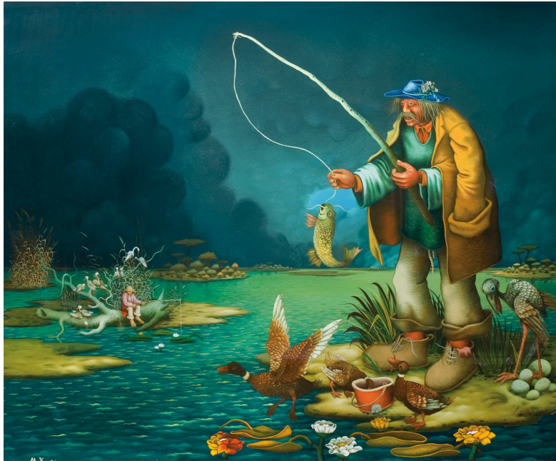
Slika 11. Podravska naiva