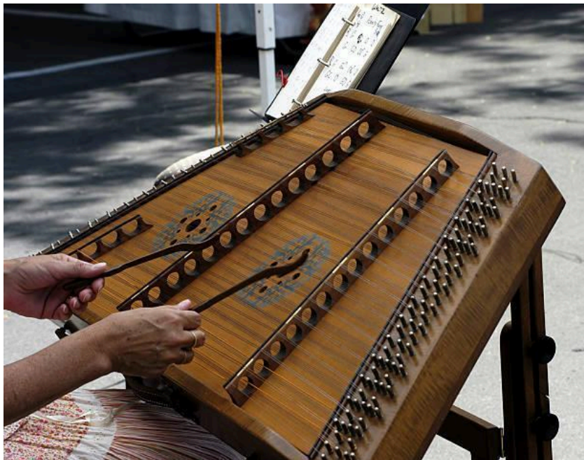
Slika 9. Cimbal

Žičano glazbalo cimbal (Slika 9.) porijeklom je iz Perzije, a u Mađarskoj se koristi u 18. i 19. stoljeću. Skladatelji Stravinski i Listz uključuju cimbele u svoja djela i tijekom 20. stoljeća. U to vrijeme također se udomaćuju na glazbenoj sceni sjeverozapadne Hrvatske, danas se izrađuju i slušaju u đurđevačkoj Podravini. Izrađuju se u privatnim i malim radionicama, a 2012. proglašene su nematerijalnim kulturnim dobrom. Članovi Udruge cimbalista u Hrvatskoj najveći su promotori ovog instrumenta. 69