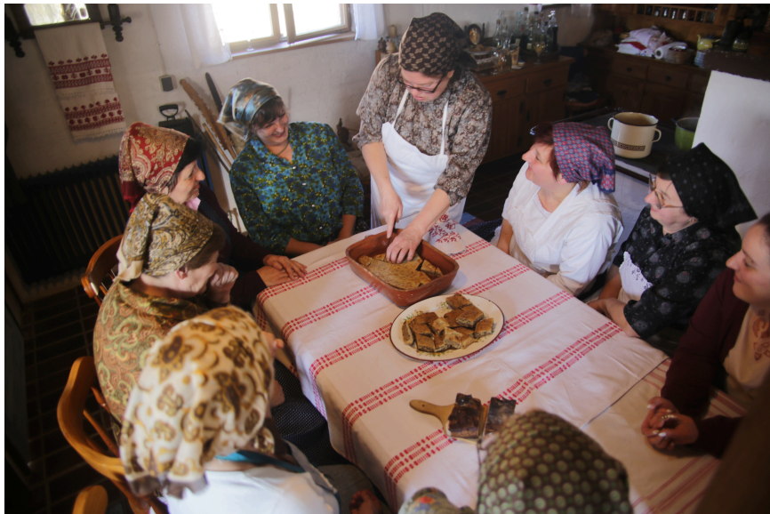
Slika 8. Posluživanje pogače s orasima

Kao što je već spomenuto, pogača z oreji , odnosno pogača s orasima (Slika 8.), upisana je na listi zaštićenih nematerijalnih kulturnih dobara od 2017. Zaštitu pogače pokrenula je đurđevačka Udruga žena. Priprema se od pet sastojaka, brašna, vode, soli, šećera i oraha. U posljednjih je 50 godina neizostavni kolač na izložbi Picokijade . 68 Uz nju se još na izložbi kolača prezentira i Svetojanska zlevanka.