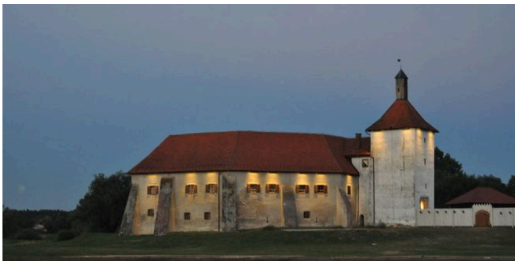
Slika 4. Utvrda Stari grad

Utvrda je nekada bila okružena močvarom, što je stvaralo prirodni oblik za zaštitu pa zato pripada tipu Wasserburga . Gradi se do 16. stoljeća. U vrijeme osmanlijskih napada i pada grada Virovitice 1552. pod njihovu vlast, utvrda je bila osobito značajna. Nakon njihova povlačenja iz Europe, više nema obrambenu ulogu. Uz osmanlijske napade na grad Đurđevac nastala je Legenda o Picokima. Pored utvrde se danas nalazi Hrvatska sahara koja je stanište četiriju deva i brojnim domaćim životinjama. 47