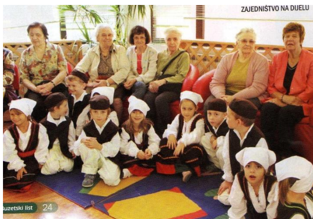
Slika 4. Korisnice Programa pomoći u kući i Dnevnog boravka donijele djeci narodne nošnje