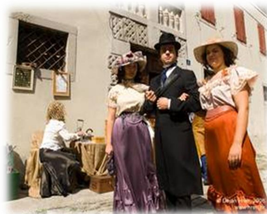
Slika 2. Dame i gospoda u šetnji gradom