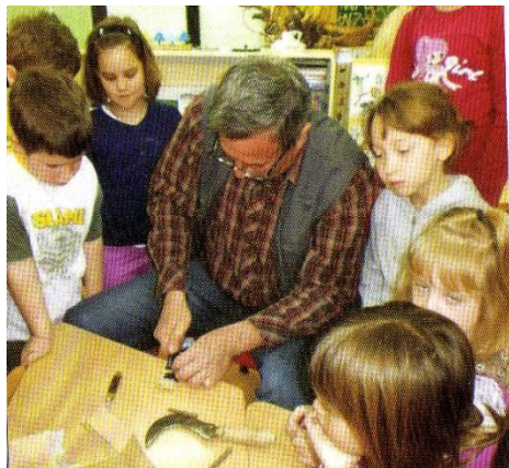
Slika 3. Nono u dječjem vrtiću uči djecu izradi košara