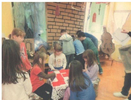
Slika 14. Centar kulturne baštine