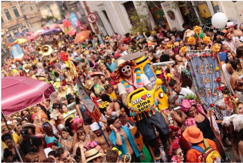
Slika 7. Ulična zabava „blocos“