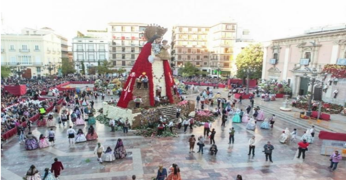
Slika 4. Prinošenje cvijeća Djevici nemoćnih