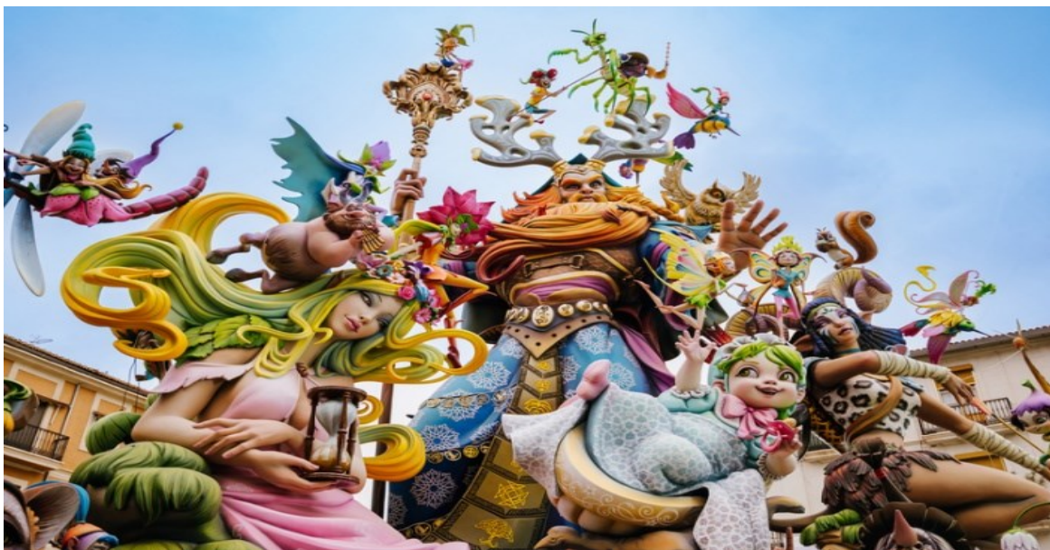
Slika 2. Falla