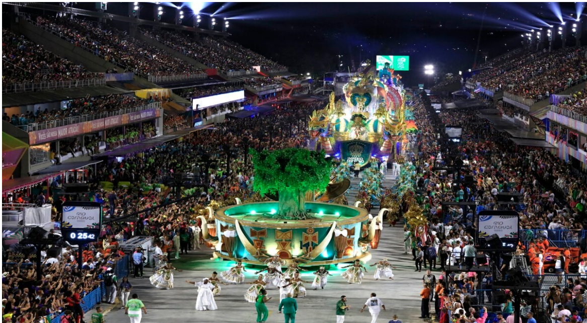
Slika 5. Povorka plesnih škola sambe