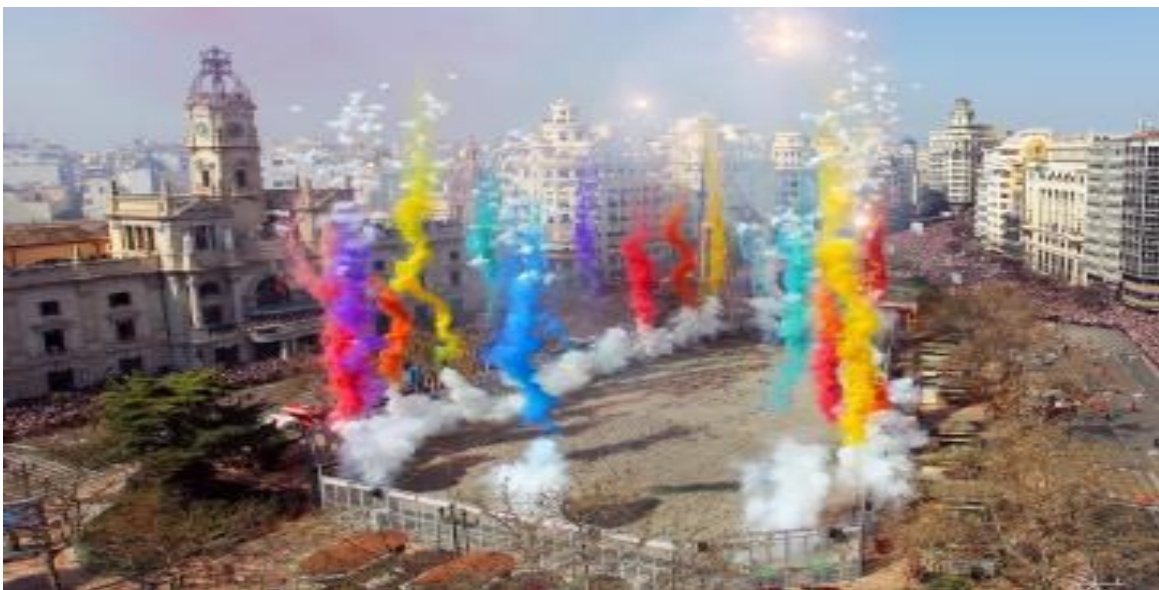
Slika 3. Vatromet mascletà