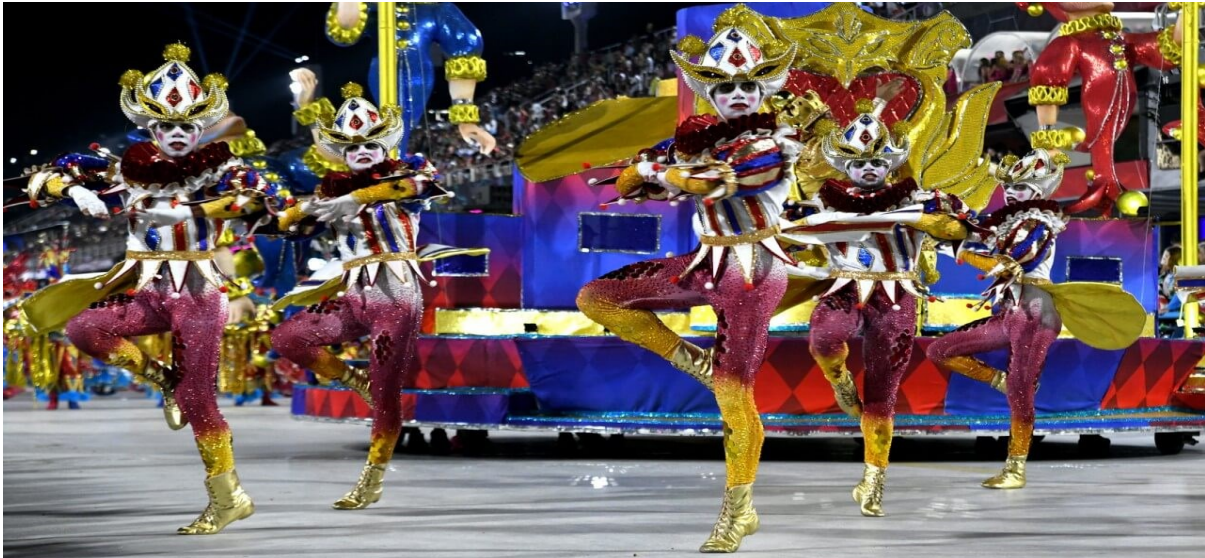
Slika 6. Ručno rađeni kostimi plesne skupine