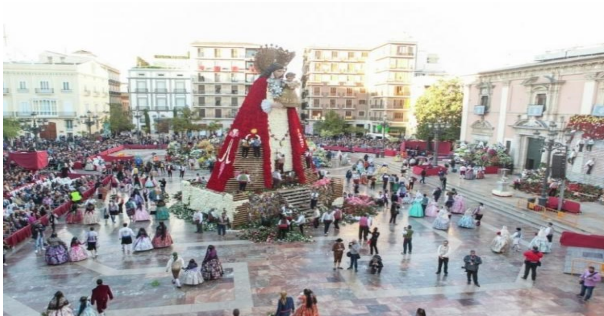
Slika 4. Prinošenje cvijeća Djevici nemoćnih