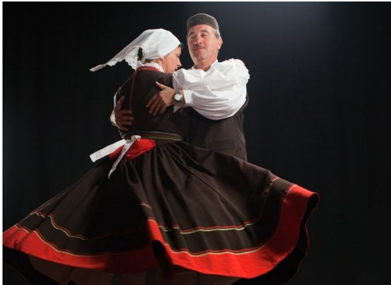
Slika 10: Istarska narodna nošnja