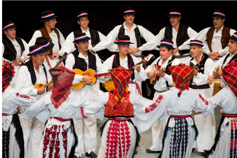
Slika 14: Slavonsko kolo