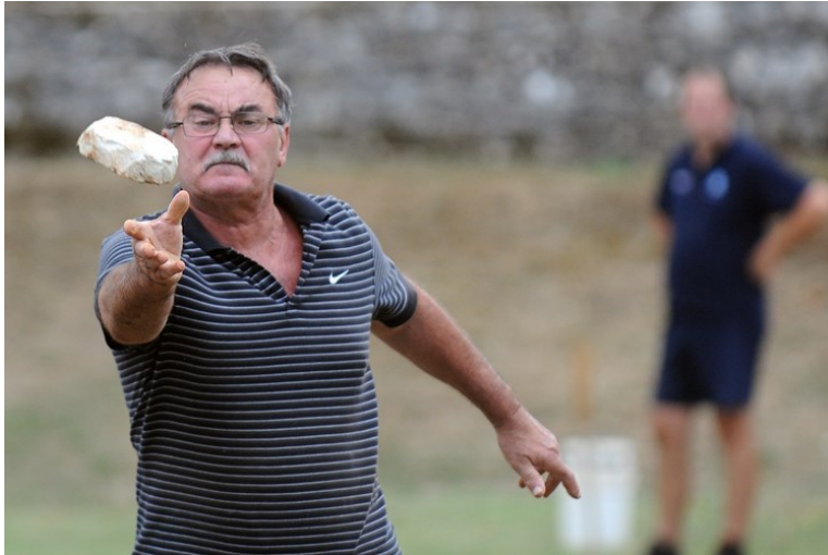
Slika 12: Pljočkanje