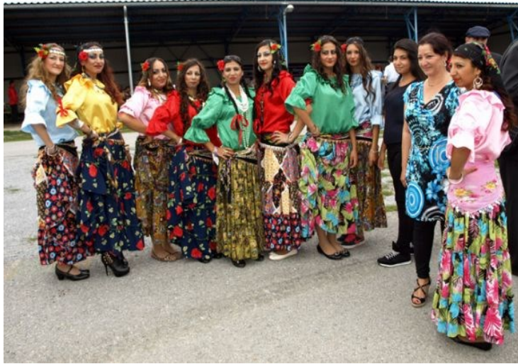
Slika 20: Romi