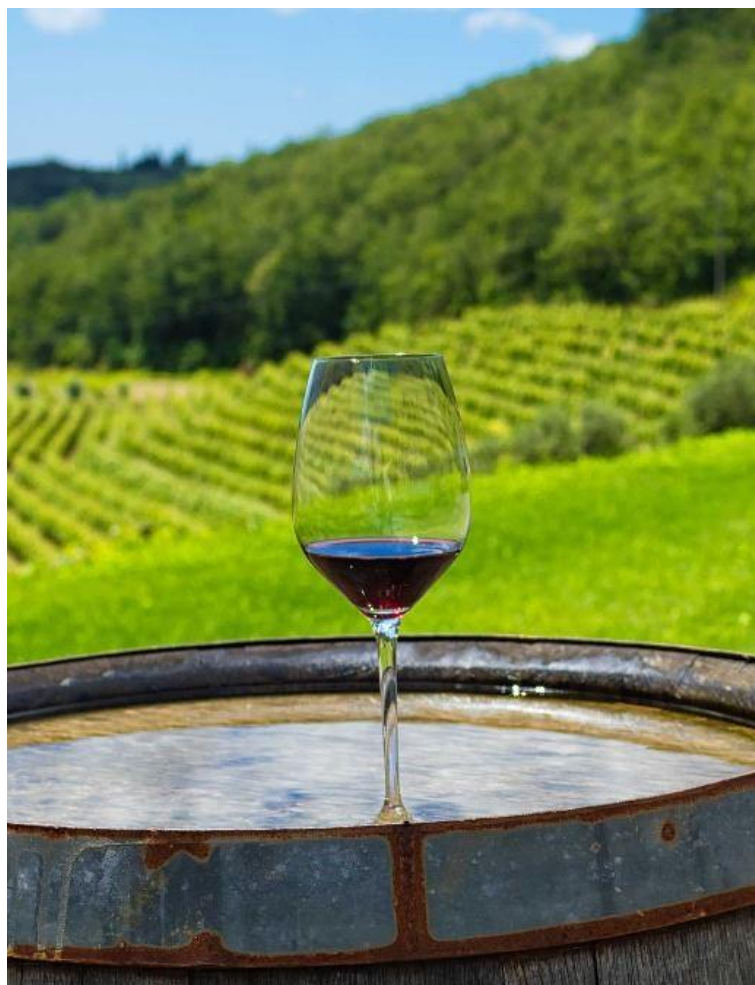
Slika 8 - Teran