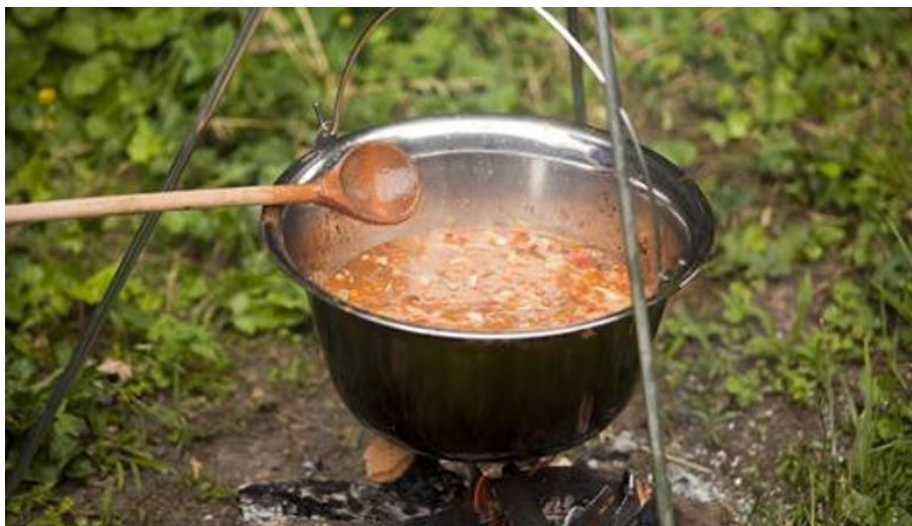
Slika 19 - Čobanac

Čobanac se najčešće radi za više ljudi, najukusniji je kada se jede u dobrome društvu, a odličan je i kad malo odstoji. U čobancu se skrivaju najmanje tri vrste mesa među kojima glavninu drže svinjetina i junetina, a dodaje se još i minimalno jedna vrsta divljači. U kotao se prvo doda luk koji se izdinsta kako bi dobili gustoću, a zatim se dodaje ostalo povrće te se nakon povrća dodaje meso. Meso se dodaje ovisno o žilavosti, prvo se ubacuje junetina, zatim divljač pa svinjetina/teletina. Nezaobilazan dodatak je i lovor, sol, papar, mljevena slatka paprika te ljuta paprika po izboru. Glavno je obilježje ovoga jela njegova ljutina koja se dobije od ljute paprike i sušenih ljutih papričica. Dodatan okus čobancu daje i vino koje se ulijeva, najčešće graševina zbog svoje kiselosti, a može se dodati i malo konjaka. Čobanac je jelo koje se kuha sporo i dugo tako da bi se sve povrće raskuhalo, a meso postalo mekano. Danas postoje brojna natjecanja u pripremi ovoga jela, a poseban šarm nosi njegova duga priprema te okupljanje oko otvorene vatre i visećega kotlića iz kojega se dimi. 57