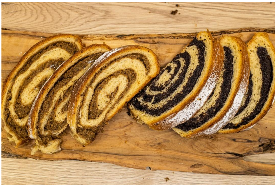
Slika 22 - Orahnjača i makovnjača