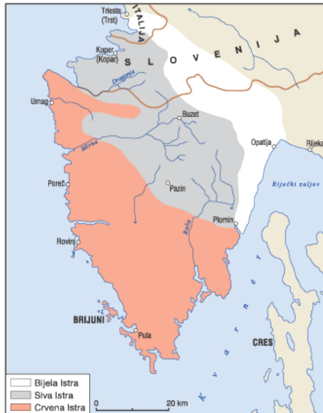
Slika 12 - Prikaz geomorfologije Istre