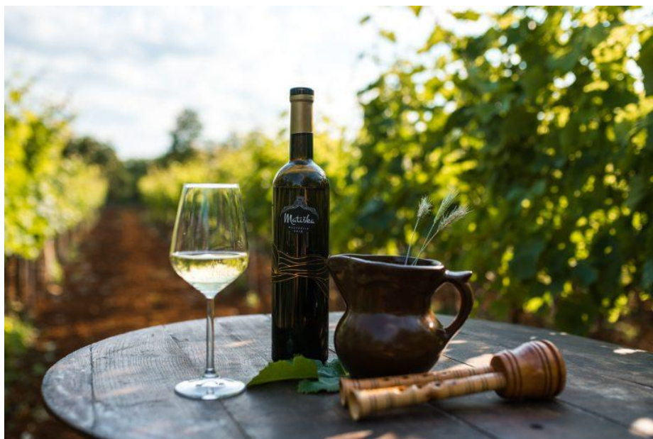
Slika 7 - Malvazija