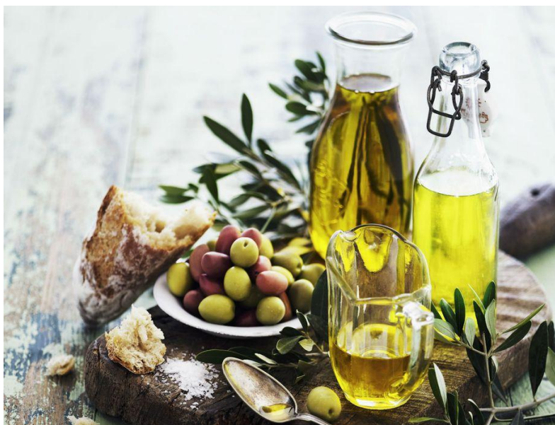
Slika 3 - Maslinovo ulje