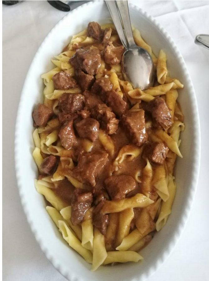
Slika 4 - Domaći fuži sa šugom