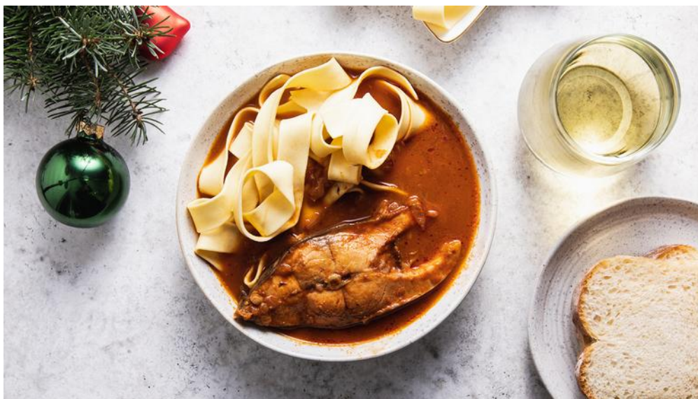
Slika 20 - Fiš paprikaš

Ribljí paprikaš, ili u Slavoniji zvan samo fiš, bogato je jušno jelo s riječnom ribom. Smatra se da su fiš donijeli doseljenici iz južne Njemačke, povezuje ga se i s Mađarima koji su nekada nastanjivali prostor sadašnje Baranje, a danas je poznat u cijeloj državi kao poseban specijalitet ovih dviju regija. Fiš paprikaš je tradicionalno jelo koje se priprema u bakrenome kotliću obješenom iznad otvorene vatre, baš kao i čobanac. U kotlić se stavlja voda i u nju se ubacuju narezani komadi očišćene ribe poput soma, šarana ili štuke te luk i mljevena paprika, potom se sve zajedno zakuha na vatri. Prepoznatljivu crvenu boju dobije od mljevene slatke i ljute paprike koja je ovdje čest dodatak jelima. Također, i u fiš se dodaje bijelo vino. Fiš se poslužuje uz široke domaće rezance, a slastan će biti i uz domaći pečeni kruh. 58