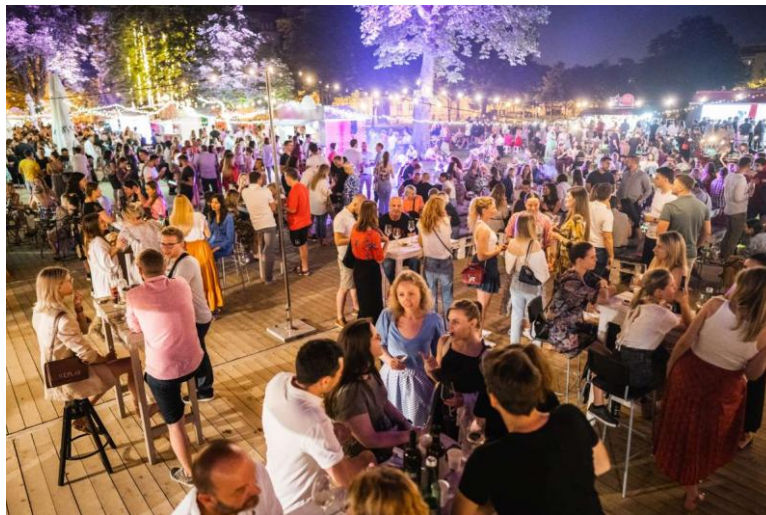
Slika 16 - Vinski grad u Puli

Na ulazu u Vinski grad potrebno je unajmiti staklenu čašu u određenome novčanom iznosu dok se konzumacija vina plaća kuponima koji su kupljeni unaprijed ili plaćeni kreditnim karticama. Sam ulaz u Vinski grad besplatan je i dostupan svima.