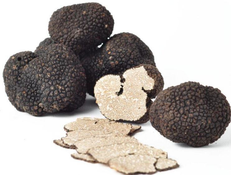
Slika 1 – Svježi crni tartuf

Tartuf je vrsta jestive gljive koja raste pod zemljom, najčešće uz korijenje stabala poput hrasta, bukve, topole, vrbe i brijesta. Izgledaju poput gomolja i često ih se izgledom uspoređuje s krumpirom. Uglavnom narastu od veličine trešnje do veličine jabuke, no ponekad se zna pronaći i znatno veći primjerak. U kulinarskom su svijetu najpopularnije dvije osnovne vrste: crni i bijeli tartuf. Tartufi rastu diljem Europe, Azije, Sjeverne i Južne Amerike, no najznačajnijim nalazištima smatraju se Francuska i Italija. Najpoznatije nalazište tartufa u Hrvatskoj je dolina rijeke Mirne u Istri. Potragu ili takozvani lov vodi stručnjak tartufar dok same tartufe pronalaze trenirani psi. Nekada su tartufe pronalazile svinje, no danas je to rijetkost jer sve što pronađu, najčešće i pojedu. 28