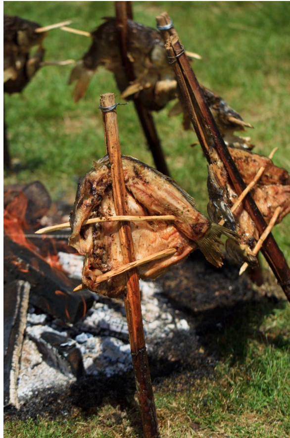
Slika 21 - Šaran na rašljama

sati, a posljednjih je desetljeća jelo koje se sve više traži u restoranima i na različitim manifestacijama. 59