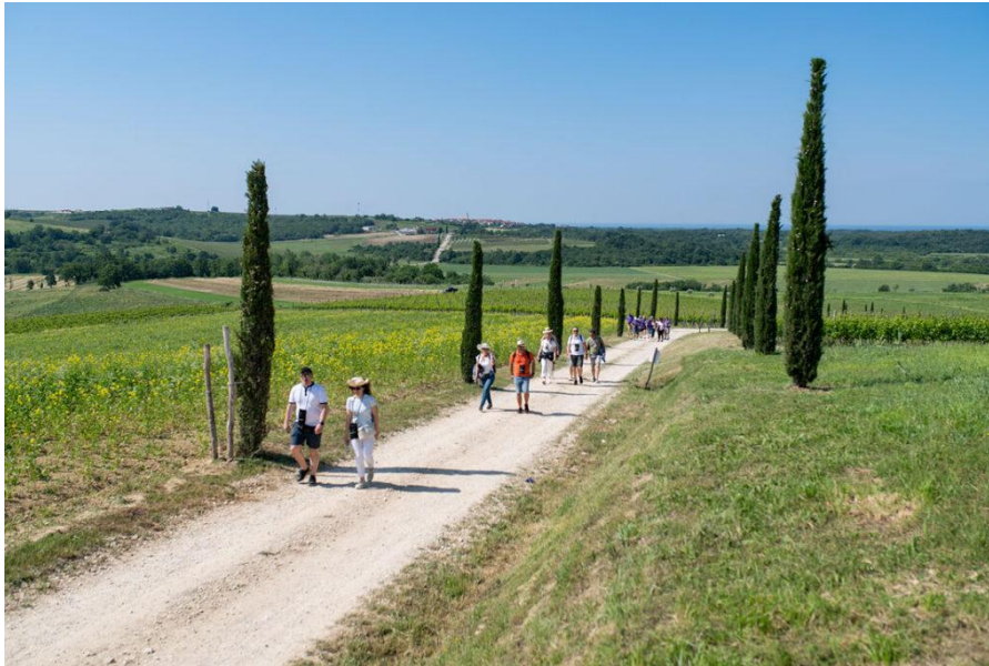
Slika 15 - Istria wine&walk

tunjevine, vlasca, gljiva i pršuta. Također su se mogle probati i druge delicije poput salata od sipe, domaće šunke sa sirevima, istarski BQ pulled pork sendvič, palenta sa svinjetinom... Manifestaciju Istria wine&walk organizira klaster sjeverozapadne Istre, koji čine udružene turističke zajednice Umaga, Novigrada, Brtonigle, Motovuna, Grožnjana i Oprtja. 52