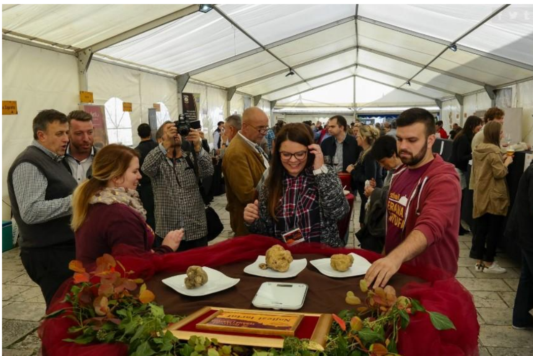
Slika 13 - Festival terana i tartufa