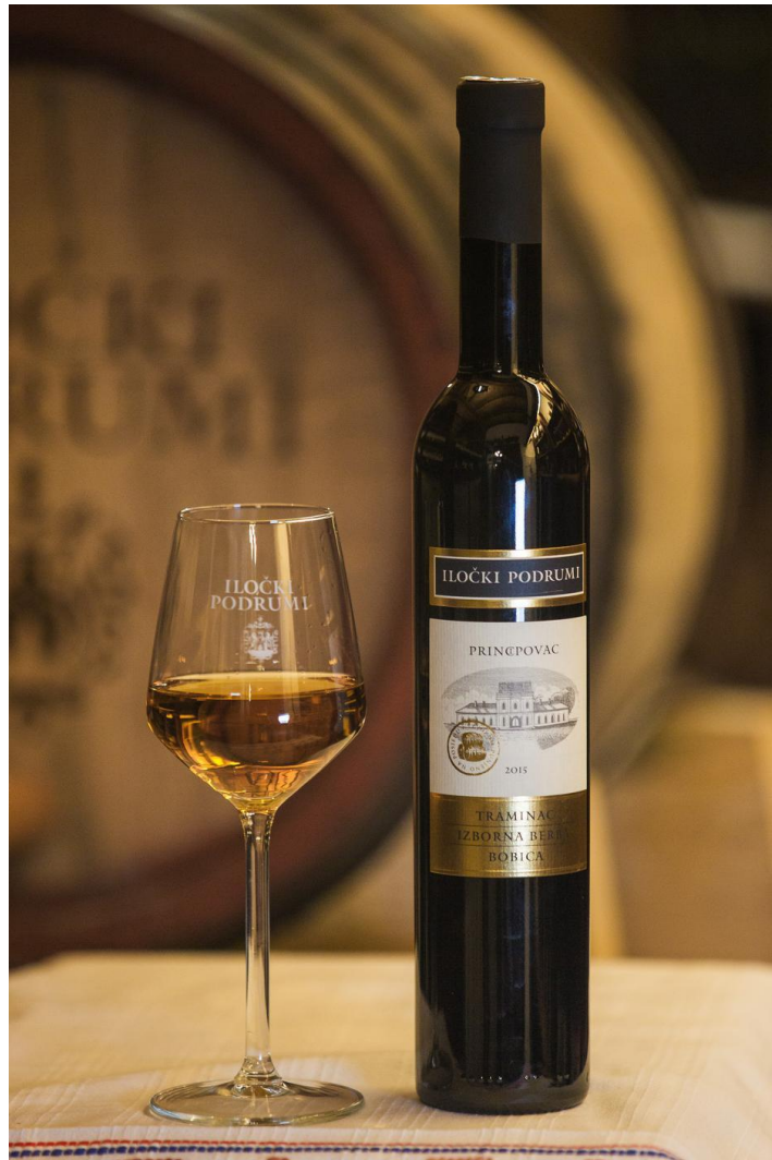
Slika 23 - Iločki traminac