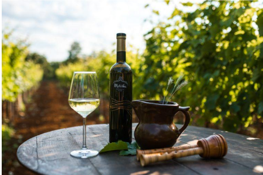
Slika 7 - Malvazija