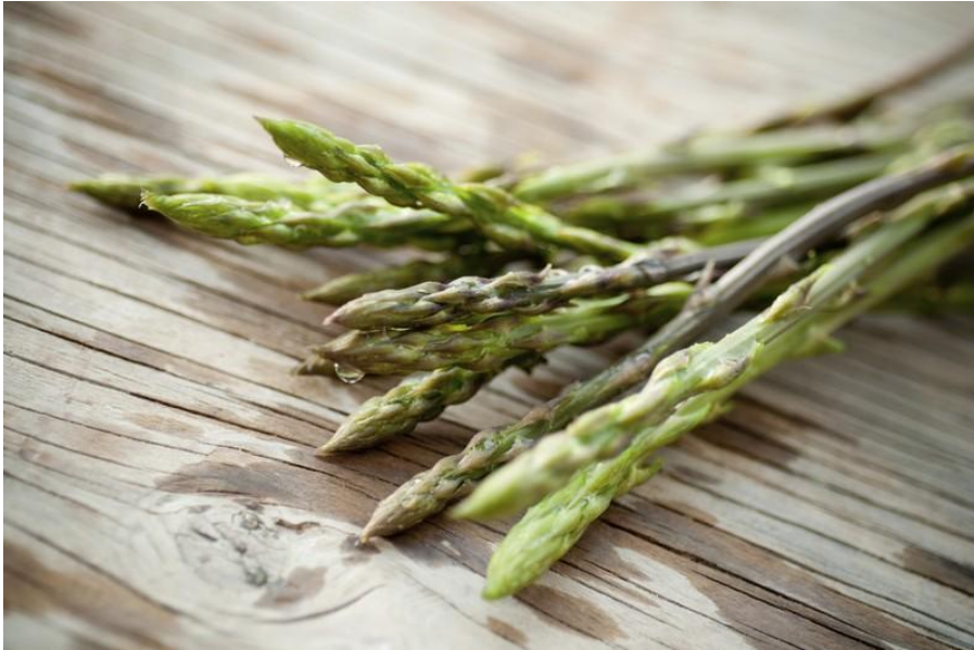
Slika 2 - Šparoge

Šparoga je jedna od najcjenjenijih samoniklih biljaka koje uspijevaju na području Istre. Divlja šparoga ima počasno mjesto na istarskoj trpezi – vitka i tamna, ona je simbol vitalnosti, zdravlja i užitka za nepce te će u svaku kuhinju unijeti dašak primorskoga življenja. U proljeće divlja šparoga raste u izobilju po šumarcima i livadama uz širi obalni pojas Istre. Finoga, gorkastog okusa i karakterističnog mirisa, šparoga inspirira i vrhunske majstore kuhinje, ne ostajući tek puki sastojak narodne kuhinje. 29