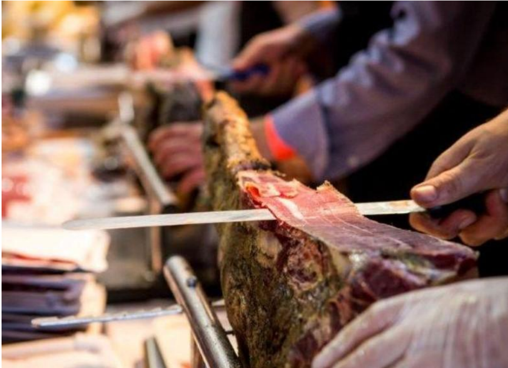
Slika 14 - Istarski sajam pršuta u Tinjanu