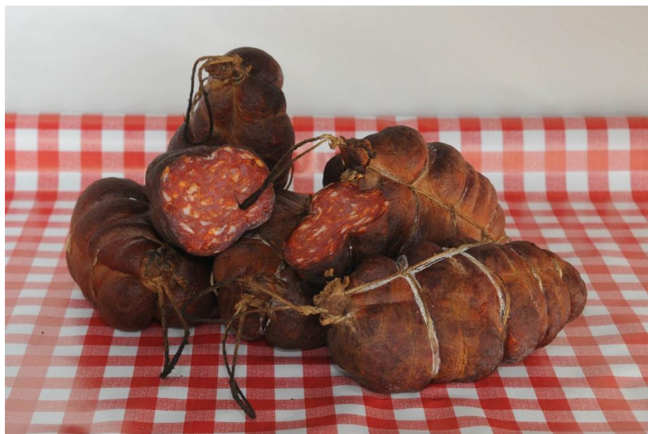
Slika 17 - Slavonski kulen

Bitno je naglasiti da među slavonske suhomesnate delicije spadaju i kobasica, šunka, peka, slanina, krvavica te mnogi drugi proizvodi od svinjskoga mesa.