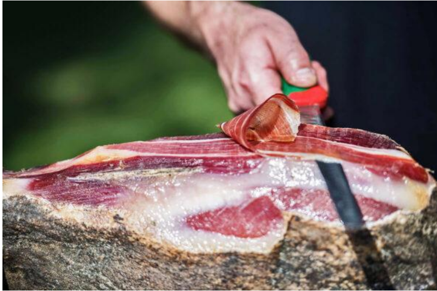
Slika 5 - Starski pršut