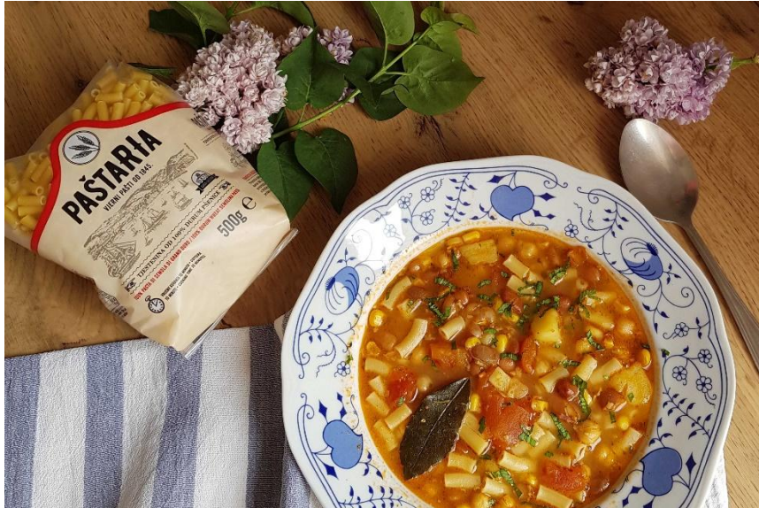
Slika 6 Istarska maneštra