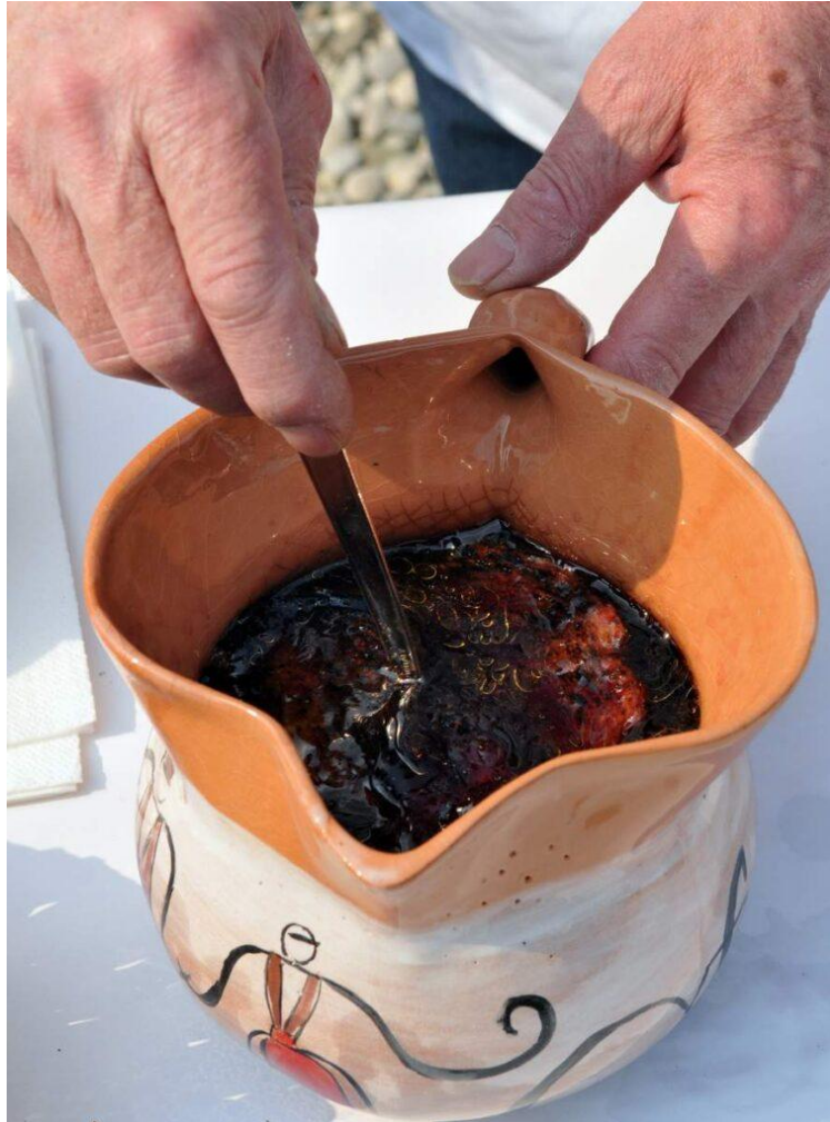
Slika 9 - Istarska supa