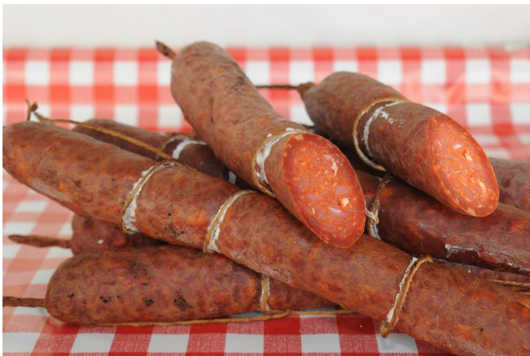
Slika 18 - Kulenova seka