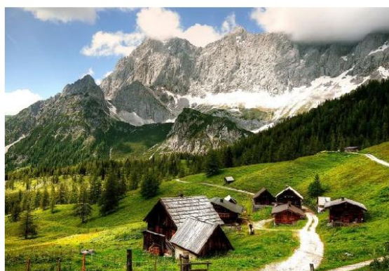
Pješačenje u Gutensteinskim Alpama - Beč