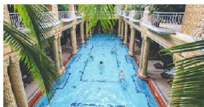
Termalne kupke za vodeni sport - Budimpešta