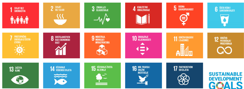
Slika 3. UN-ovi ciljevi održivog razvoja 2015.