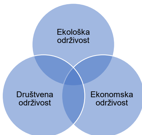
Slika 1. Ilustracija odnosa između dimenzija održivosti

Izvor: M. A. Rosen, „Issues, concepts and applications“, Glocalism: Journal of culture, politics and innovation , vol. 3, 2018., str. 5.