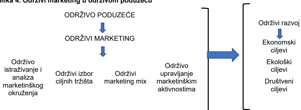
Slika 4. Održivi marketing u održivom poduzeću