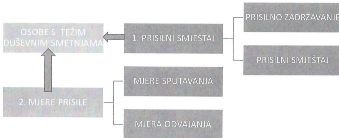
Slika 2: PHOSP osoba s težim duševnim smetnjama