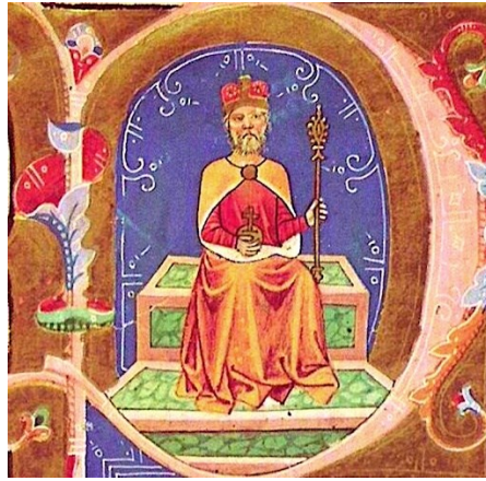
Slika 1. Veliki knez Mađara Gejza (vladavina 972.-997.), dostupno na https://sh.wikipedia.org/wiki/Gejza (7. travnja 2024.)