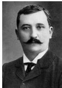
Slika 10. Frano Supilo (1870.-1917.), hrvatski političar i publicist, https://www.enciklopedija.hr/clanak/supilo-frano (19. lipnja 2024.)