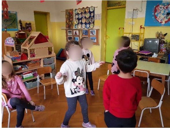
Slika 13. Izražavanje tuge i ljutnje