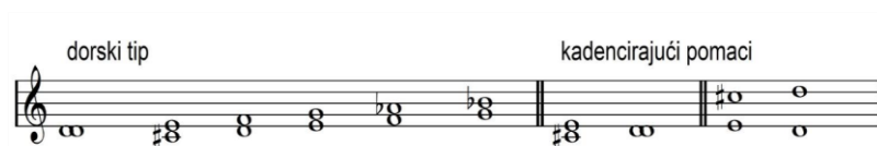
Slika 2. Istarska ljestvica – dorski tip (Matetić Ronjgov, bez dat.)

Primjer pjesme Lovran je bili grad koji je prikazan tijekom aktivnosti vokalni je oblik u izvedbi Ansambla narodnih plesova i pjesama Hrvatske LADO koju je aranžirao hrvatski skladatelj Slavko Zlatić.