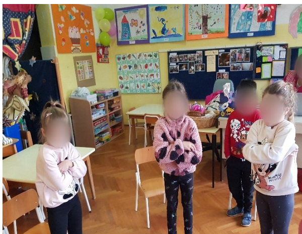
Slika 11. Izražavanje ljutnje