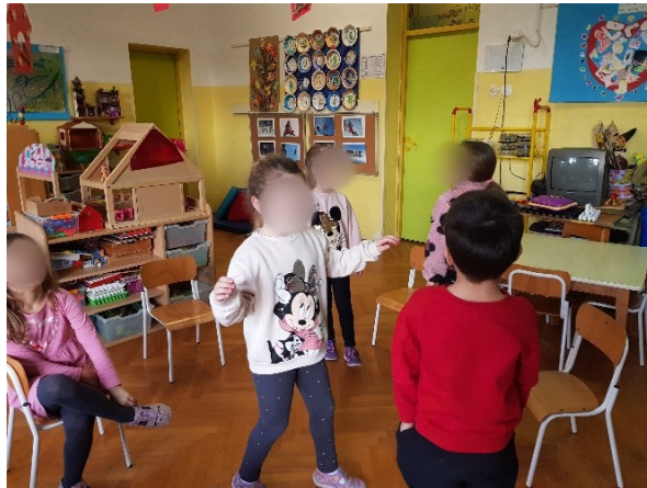
Slika 13. Izražavanje tuge i ljutnje