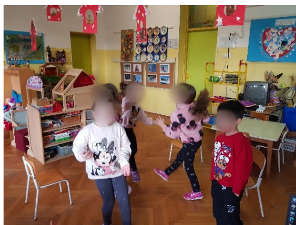
Slika 20. Izražavanje radosti