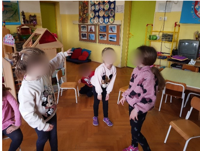
Slika 22. Izražavanje tuge