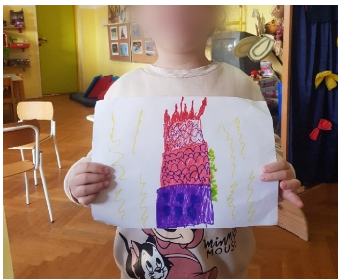
Slika 27 Prikaz crteža torte

Nakon provedene aktivnosti može se zaključiti kako su ponuđena glazbena djela utjecala na djecu te da su izazvala pojavu određene emocije. Tijekom slušanja umjetničke glazbe kod djece se primjećuje pojavljivanje svih emocija koje su se prethodno predstavile za vrijeme igre – radosti, tuge, ljutnje, iznenađenja, poletnosti i straha. Najveći broj različitih emocija mogao se zamijetiti za vrijeme slušanja skladbe Can Can , a želju za ponovnim puštanjem te skladbe djeca su izrazila i u završnom dijelu. Kada je riječ o djelima folklorne glazbe, zamjećuje se pojavljivanje svih emocija izuzev iznenađenja, dok su kod pjesama za djecu bile izražene samo tri emocije – radost, tuga i poletnost. Provedena aktivnost slušanja pokazala je postojanje utjecaja glazbe na pojavu emocija kod djece. S obzirom na to da su mogla slobodno izraziti vlastite emocije bez nametanja tuđih dojmova, djeca su, potaknuta glazbom, izražavala emocije ekspresijama lica, samoinicijativno započela s kretanjem u prostoru u obliku plesa te izražavala vlastiti glazbeni doživljaj. Jednako tako tijekom aktivnosti se moglo primijetiti da djeca pažljivo slušaju glazbu iako možda ne bi izrazili doživljaj pokretom ili značajnijom ekspresijom lica. Posebno je to vidljivo u slučaju djevojčice koja je tijekom aktivnosti suzdržano sjedila i pokretom izrazila tek poneku emociju, no isto je tako na izniman način dočarala vlastiti doživljaj likovnim izražavanjem nacrtavši veliku bubamaru potaknuta pjesmom Nije lako bubamarcu .