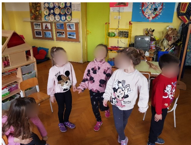
Slika 18. Izražavanje tuge