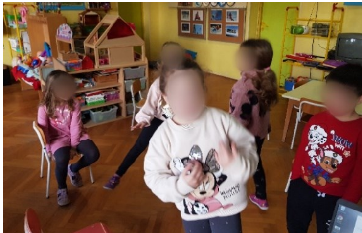
Slika 16. Izražavanje radosti