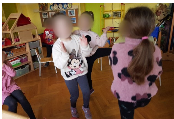
Slika 21. Izražavanje radosti