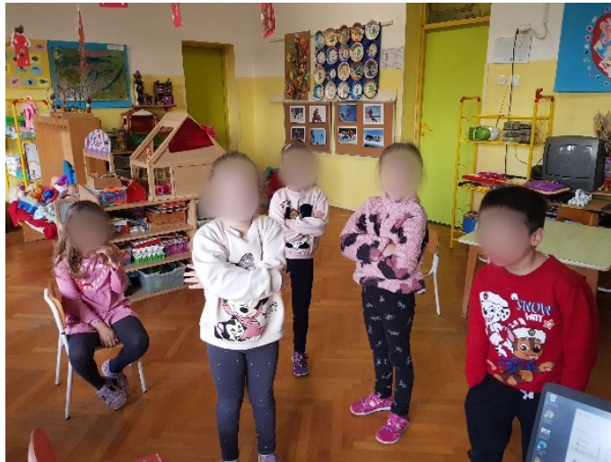
Slika 15. Izražavanje straha i ljutnje