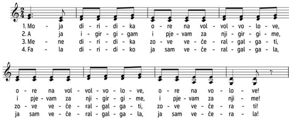
Slika 3. Notni zapis pjesme Moja diridika („Moja diridika“, bez dat.)