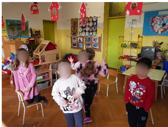
Slika 19. Izražavanje radosti