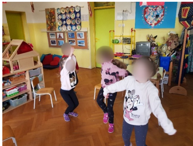
Slika 25. Izražavanje radosti