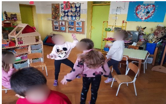
Slika 9. Izražavanje radosti