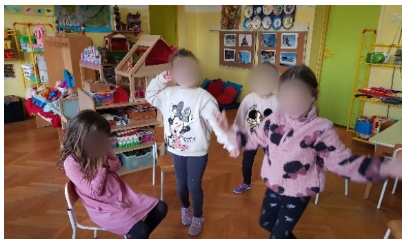
Slika 10. Izražavanje poletnosti