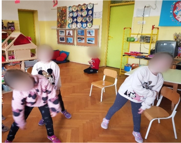
Slika 24. Izražavanje tuge