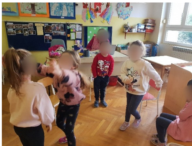
Slika 12. Izražavanje tuge