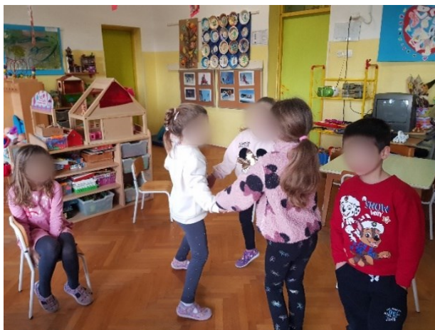
Slika 17. Izražavanje radosti

9. Narodna, Međimurje: Međimurje malo kak si lepo ravno Djeca se kreću u prostoru laganim i usporenim koracima, izrazom lica odražavaju osjećaj tuge.