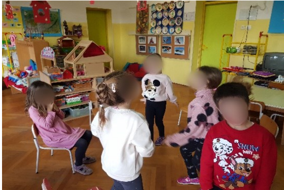
Slika 8. Izražavanje iznenađenja