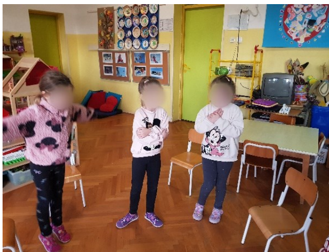
Slika 7. Izražavanje straha