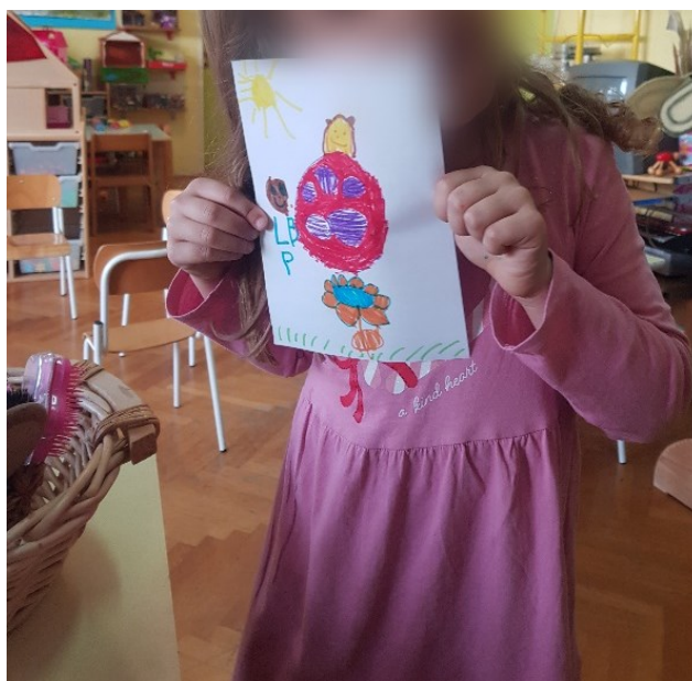
Slika 26 Prikaz crteža bubamare

Završni dio obilježen je dječjim slobodnim odabirom centra aktivnosti u kojem je svatko predstavio vlastite dojmove nakon slušanja glazbenih djela. Tako su pojedina djeca odabrala likovni centar aktivnosti u kojem su uz ponuđene poticaje – flomastere i bijeli papir, likovno predočila vlastite dojmove koji su bili prisutni i nakon slušanja glazbe. Djevojčica koja je tijekom slušanja sjedila na stolici i nije pokretom izražavala emocije (izuzev jedne pjesme), nego je iste dočarala ekspresijama lica, svoj dojam predočuje uz pomoć crteža te tako potaknuta pjesmom Nije lako bubamaru crta svoju vlastitu bubamaru. Druga djevojčica koja je u glavnom dijelu aktivnosti sudjelovala na način da iskazuje emocije i ekspresijama lica i pokretom, nacrtala je nakon slušanja veliku tortu. Ostala su djeca završni dio aktivnosti nastavila provoditi kao aktivno slušanje. Inzistirali su na puštanju glazbenog djela Jacquesa Offenbacha Can Can uz koje su plesali i ponovno proživljavali skladbu, a nakon toga su također u likovnom centru crtali prema vlastitoj želji.