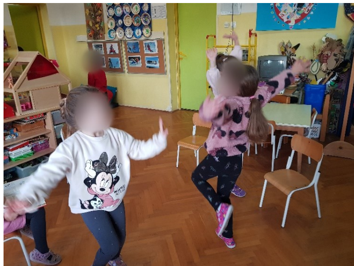
Slika 23. Izražavanje poletnosti