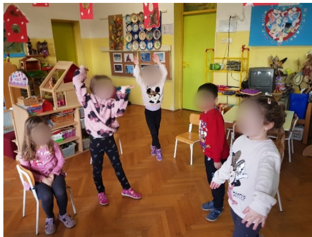
Slika 14. Izražavanje poletnosti