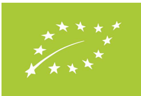
Slika 1. Logotip EU za ekološke proizvode