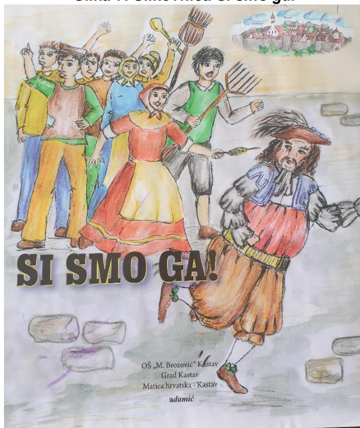
Slika 7. Slikovnica Si smo ga!

Upravo ta važnost čuvanja lokalne baštine postaje glavnom temom potičući nas da razmišljamo o vlastitoj odgovornosti prema kulturnom naslijeđu i o važnosti prenošenja tih vrijednosti na buduće generacije. Slikovnica je most između prošlosti i sadašnjosti ukazujući na trajni značaj čuvanja vlastite kulturne i povijesne baštine. Dragocjen je podsjetnik na to da su priče naše prošlosti nešto što treba čuvati, dijeliti i nositi kao svjetionik koji osvjetljava put ka boljoj budućnosti.