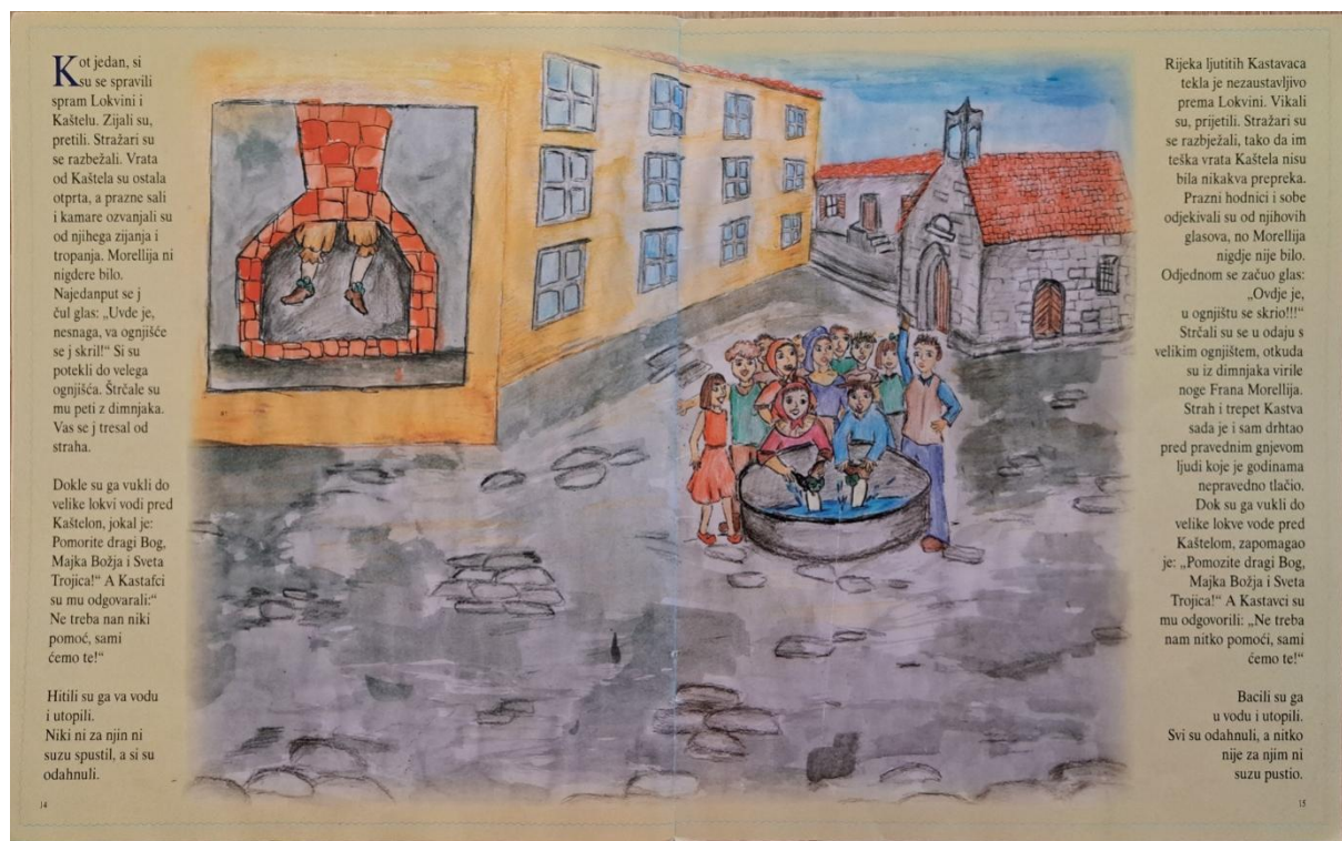
Slika 10. Slikovnica Si smo ga! – prikaz Kastavaca

Ispred Lokvine, Kastavci su vikali, prijetili i tražili Morellija koji se je skrivao: "Prazni hodnici i sobe odjekivali su od njihovih glasova, no Morellija nigdje nije bilo" (Stanić, 2009:15). Odlučni u namjeri da privedu pravdi onoga tko im je nanosio nepravdu, nisu se zaustavili dok ga nisu pronašli.