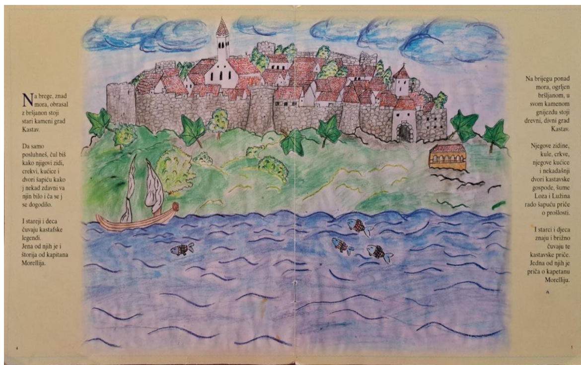
Slika 5. Uvodni dio slikovnice Si smo ga!