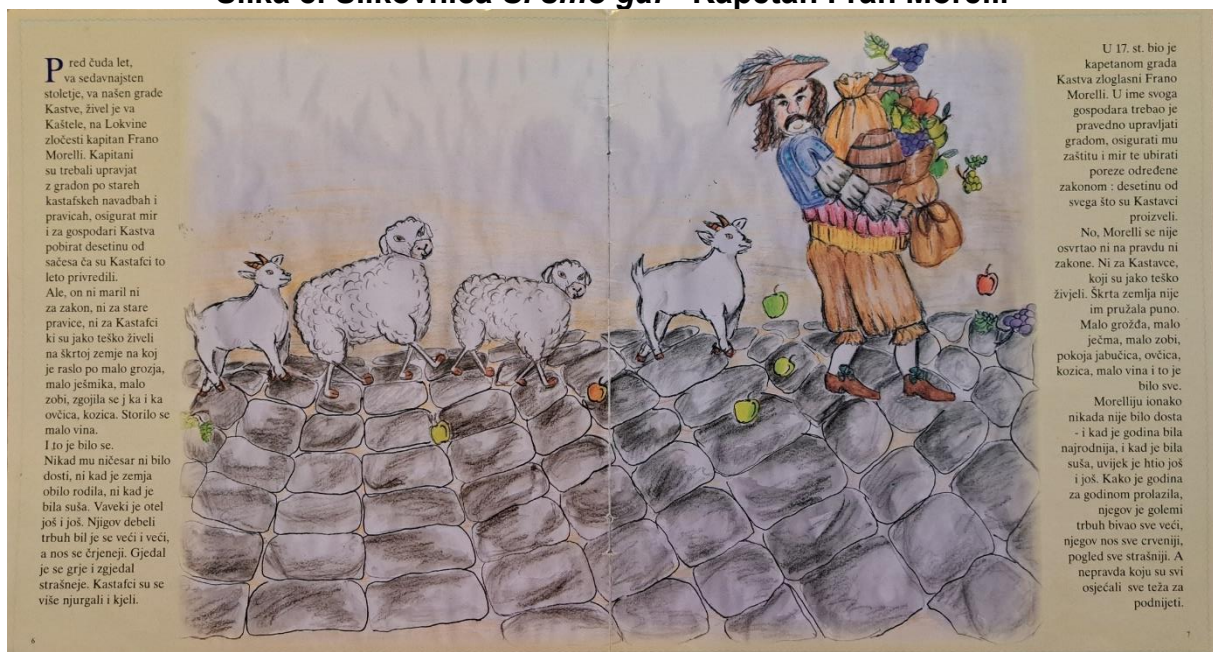
Slika 8. Slikovnica Si smo ga! - Kapetan Fran Morelli

Kapetan Morelli simbolizira pohlepu i nepravdu koje zajednica odlučuje nadići u korist pravde i slobode. On je ključni antagonist priče zbog kojeg je naglašena važnost pravde, slobode i hrabrosti zajednice da se suprotstavi nepravdi.