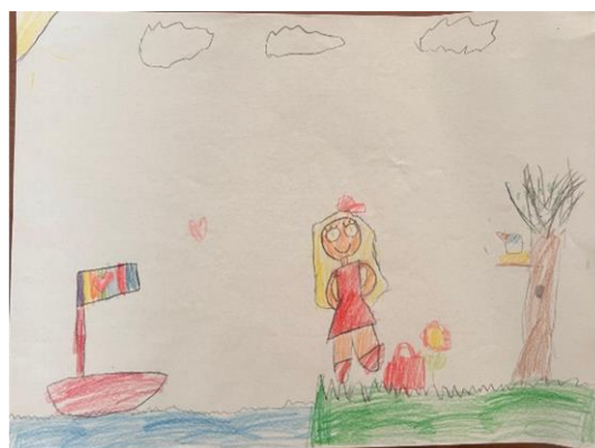
Slika 9. T.M. „Mjesečeva sonata“