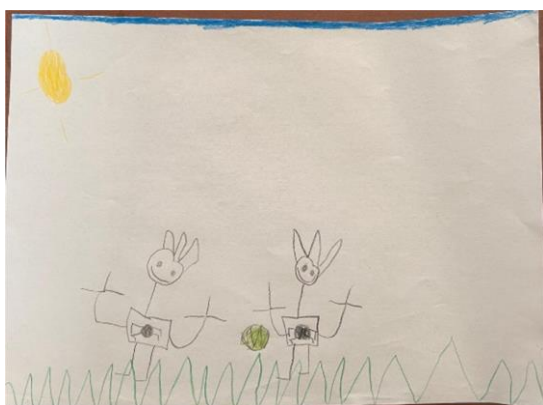
Slika 8. L.L. „Nogomet“