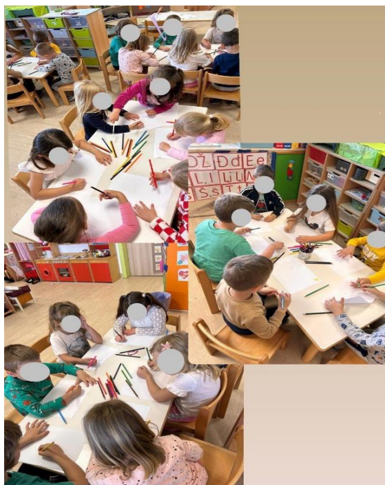
Slika 5 Djeca crtaju slušajući glazbu

Promatrajući dječje reakcije tijekom prvog slušanja, može se reći kako su djeca bila opuštena i vrlo koncentrirana tijekom slušanja skladbe. S obzirom na to da su prethodne dvije aktivnosti slušanja skladbe provodili sjedeći u krugu, primijetilo se kako su djeca tijekom sjedenja za stolom bila više koncentrirana. Trinaestero djece prepoznalo je da je skladba izvedena samo na klaviru dok je šestero djece smatralo da uz klavir skladbu izvodi i violina. Većina djece zna kako se svira klavir te da klavir ima tipke, crne i bijele. Starija djeca, predškolarci, znali su prepoznati da je skladba bila sporija dok su mlađa djeca smatrala da je skladba u određenim trenucima bila spora, ali i brza. Individualnim razgovorom sa svakim pojedinim djetetom dobiveni su rezultati kako se pojedino dijete osjećalo tijekom slušanja. Sedamnaestero djece osjećalo se sretno. Od njih sedamnaestero koji su se osjećali sretno, troje djece osjećalo se opušteno te se dvoje osjećalo sretno i tužno. Jedno dijete se osjećalo samo opušteno, a tužno se osjećalo jedno dijete. Prije crtanja djeca su bila sumnjičava, no nakon što su poslušali skladbu započeli su crtati bez ikakvih poteškoća (Slika 5.).