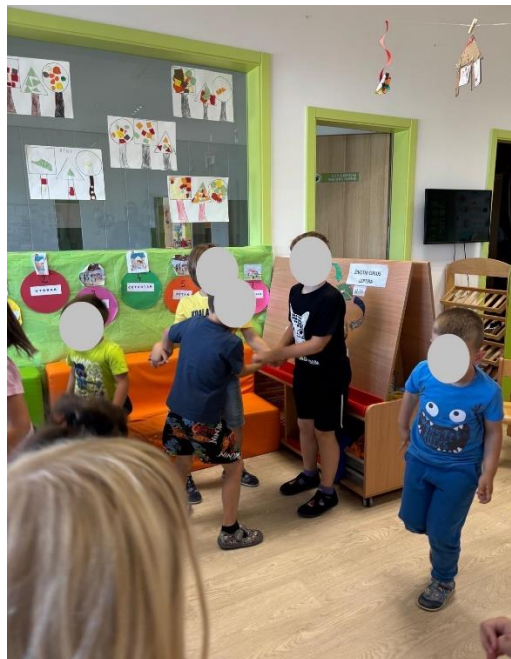
Slika 10 Dječaci skakuću u krugu držeći se za ruke.

Promatrajući kako su djeca prolazila svojim prstićima po rukama, ustanovljeno je kako djeca prepoznaju tempo skladbe, ali neka djeca, većinom ona mlađa u dobi od 3 do 4 godine, možda još uvijek ne razumiju pojmove brzo i sporo. Od devetnaestero djece, šesnaestero ih je prepoznalo da je skladba brza i živahna. Četvero djece (mlađi) reklo je kako je skladba brza, ali da je i spora. Također, jedan dječak (L.L.) primijetio je kako se melodija cijelo vrijeme ponavlja uz male izmjene. Djeca su se kretala tijekom slušanja skladbe, neka su skakutala poput konjića, baš u ritmu skladbe. Dobro je primijetiti da su neka djeca uglavnom samostalno plesala, a nekoliko dječaka skakutalo je u krug držeći se za ruke (Slika 10).