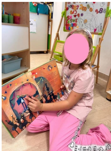
Slika 1 Djevojčica pronalazi u knjizi instrumente koji izvode skladbu.

Rezultati su pokazali kako se od osamnaestero djece, sedamnaestero djece osjećalo opušteno te se jedno dijete osjećalo tužno. Skladba je odabrana iz razloga što je u autorici budila mir i opuštenost, a isto je utjecala i na djecu. Na pitanje što su osjećali tijekom slušanja, većina djece rekla su da su sanjali i bili u svijetu snova: „Ja sam sanjala da smo ja i prijateljice šetale i gledale smo ptičice uz rijeku.“ (H.J.); „Ja sam sanjala da sam na oblaku i da skačem.“ (D.D). Djeca su izrazila želju da još jednom poslušaju skladbu te se razgovaralo o instrumentima. Šesnaestero djece je prepoznalo instrumente kojima je skladba odsvirana, klavir i violončelo. Nekolicina njih rekla su kako je to violina, a dvoje djece reklo je kako čuju trubu. Krećući se u ritmu i tempu skladbe, većinom su sudjelovale djevojčice koje su se kretale lagano, elegantno na prstićima poput balerina. Dječaci su uglavnom stajali sa strane te ih je djevojčica T.M. pozivala na ples. Djevojčica S.M. i dječak V.Z. plesali su u paru. Uslijedila je slobodna igra po centrima (Slika 1).