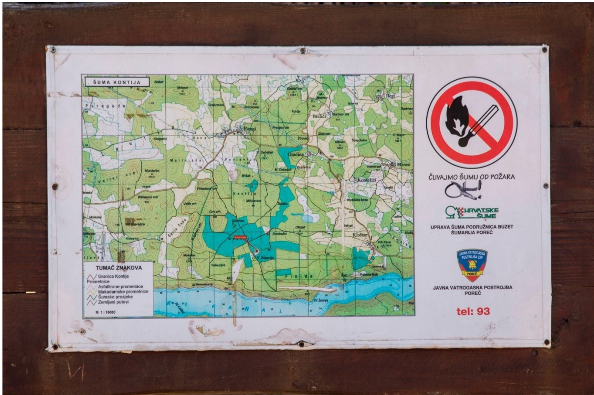
Slika 1. Karta šume Kontija