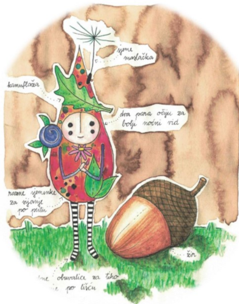
Slika 4. Kontići

Primjer Kontića ilustrira šumskog patuljka s posebnim obuvalicama za tiho kretanje, listom na glavi kao kamuflažom te sjemenkama za sijanje po putu, naglašavajući prirodnu povezanost s okolišem. Ilustracija Kontića prikazana je na slici 4.