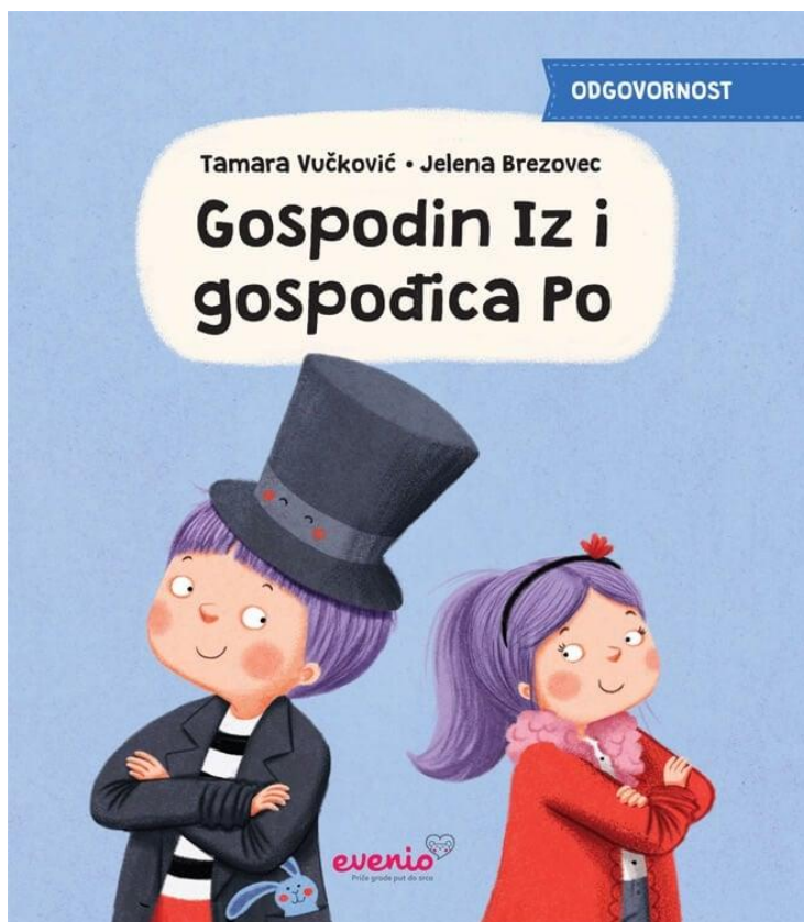
Slika 2. „Odgovornost“

Gospodin Iz i gospođica Po predstavljaju jednu od priča iz serije slikovnica koje potiče razvoj socio-emocionalnih kompetencija. Ova priča ističe važnost odgovornosti i razvoja samostalnosti kao osnovnog koraka ka preuzimanju obveza u obavljanju svakodnevnih zadataka. Iz slikovnice djeca uče da u svakom trenutku imaju izbor i da donesene odluke nose svoje posljedice. Te posljedice mogu biti neugodne ili ugodne, a proces učenja odgovornosti iz iskustva podrazumijeva prihvaćanje grešaka i spremnost za ponovne pokušaje.