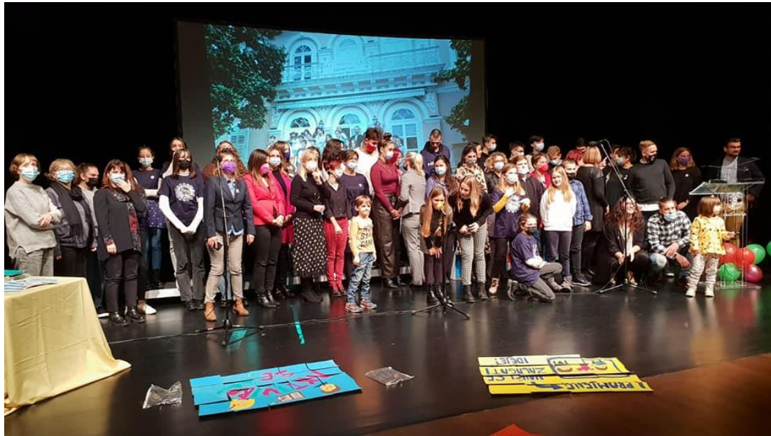
Slika 11. Susret NEF-a Hrvatske 19