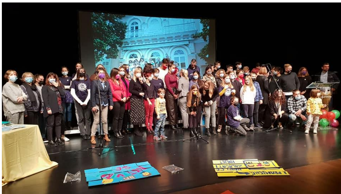
Slika 11. Susret NEF-a Hrvatske 19