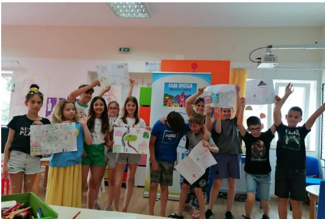
Slika 7. Radionice DGV-a Grada Opatije 12

Vijećnici Dječjeg gradskog vijeća Grada Opatije raspisuju natječaj za dodjelu sredstava iz proračuna Dječjeg gradskog vijeća „Ruke moje rastu k tebi sve veće, jer želim dati i tebi sreće“ u visini od 1.600,00 eura i jedini su u Republici Hrvatskoj koji imaju sredstva na raspolaganju koja samostalno dodjeljuju projektima koji se prijave na natječaj, kao i u davanju prijedloga za veliki gradski proračun. Prema Škorić (2022) ostvareni projekti zahvaljujući „malom proračunu“ DGV-a Opatija: Seksualni odgoj u školi – radionice za VII. i VIII. razrede; organiziran i osmišljen I. susret Dječjih vijeća Hrvatske, održan u Opatiji 25. rujna 2004. godine; dječji putokazi Opatijom – prvi prospekt za djecu preveden na četiri strana jezika; Monografija Dječjeg gradskog vijeća – povodom 10 godina rada i djelovanja Dječjeg gradskog vijeća Grada Opatije; opremanje knjižnog fonda u područnim školama; školski ormarići u IV. razredima osnovne škole; tisak transparenata Za sigurni koračić od kuće do škole, koji se uoči nove školske godine postavljaju na više lokacija u gradu u