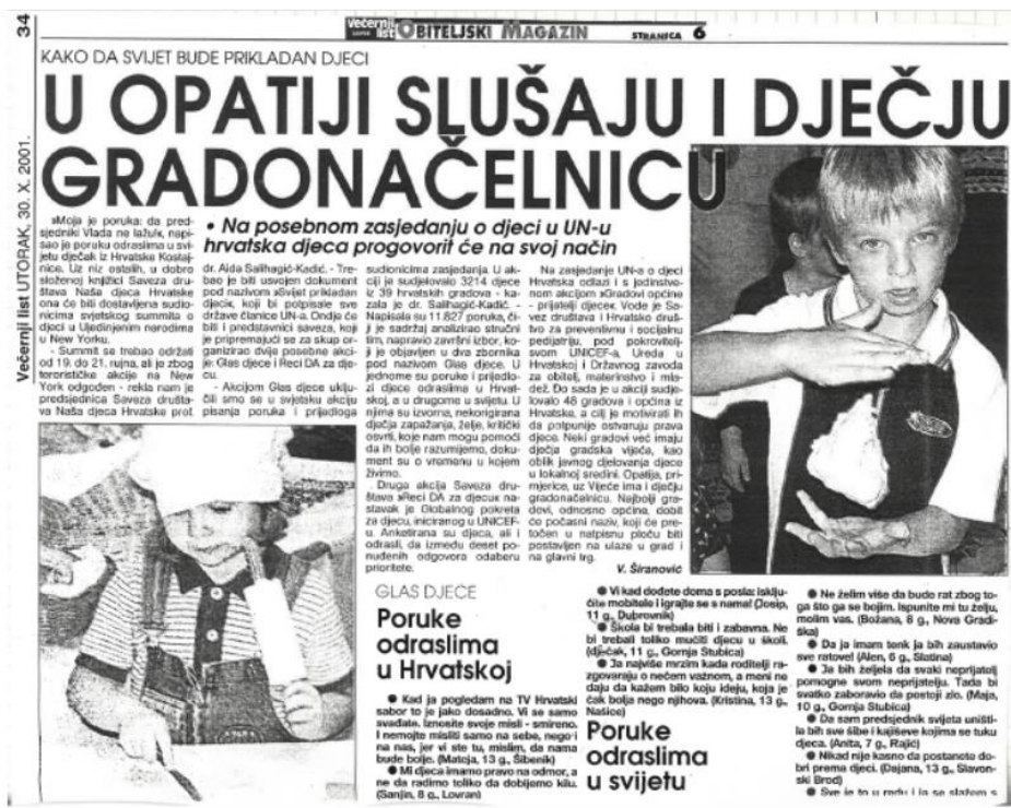
Članak u Večernjem listu, 2001.

a Hrvatske i Hrvatskog društva za socijalnu i preventivnu pedijatriju 1 Gradovi i općine prijatelji djece 2 , koja se provodi pod pokroviteljstvom UNICEF-a Hrvatske 3 i Odluku o osnivanju Dječjeg gradskog vijeća Grada Opatije (Slika 1.).