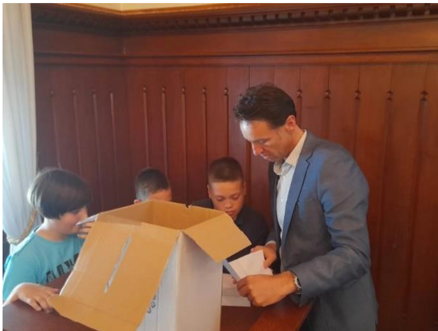
Slika 4. Brojanje glasova 9

Ukoliko je dječji gradonačelnik odabran iz sedmog razreda, mandat mu prestaje završetkom osnovnoškolskog obrazovanja, te vijećnici ponovno odabiru novog gradonačelnika/icu na sjednici.