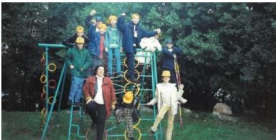
Dječje igralište Ružmarin, snimanje priloga za HTV, 2001.