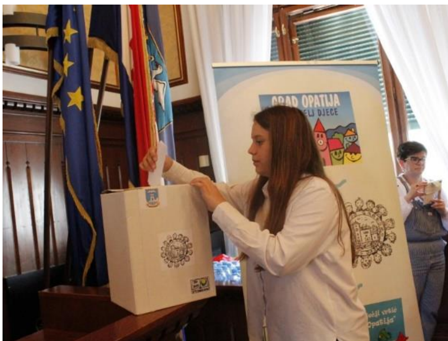
Slika 3. Tajno glasovanje 8

Mandat vijećnika Dječjeg gradskog vijeća Grada Opatije je dvije godine. Na konstituirajućoj sjednici dječji vijećnici biraju dječjeg gradonačelnika ili gradonačelnicu i temu projekta kojom će se baviti u svome mandatu. Vijećnici Dječjeg gradskog vijeća Grada Opatije podnose pisanu kandidaturu za funkciju dječjeg/ dječje gradonačelnika/gradonačelnice ravnatelju svoje škole, koji kandidature prosljeđuje Upravnom odjelu Grada Opatije, u roku od osam dana od objave rezultata izbora. Dječjeg/dječju gradonačelnika/gradonačelnicu biraju vijećnici Dječjeg gradskog vijeća Grada Opatije tajnim glasovanjem, na konstituirajućoj sjednici. Za funkciju dječjeg gradonačelnika izabran je onaj kandidat koji je dobio najveći broj glasova (Slika 3. i Slika 4.).