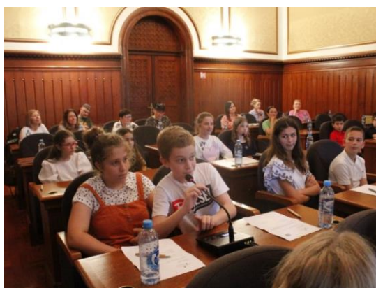
Slika 5. Sjednica DGV-a Grada Opatije 10

Prema Škorić (2022) u radu s vijećnicima Dječjeg gradskog vijeća Grada Opatije participativnim učenjem djeca i odrasli zajedno stvaraju okruženje koje ohrabruje dječje istraživanje i sudjelovanje u aktivnostima. Kako bi djeca aktivno participirala važno je pridržavati se uputa za rad: vijećnici na početku mandata izrađuju svoja pravila ponašanja koja se tijekom mandata nadopunjuju; ravnopravnost u radu se pokazuje kroz sjedenje u krugu i otvoren razgovor i spremnost na raspravu i dijalog; u rasprave i aktivnosti se uključuju svi koji dobrovoljno i slobodno žele izraziti svoje stavove i mišljenje; kroz različite metode potiču se i različite vrste kreativnog izražavanja kao što je pismeno izražavanje, usmeno izražavanje, crtanje, sudjelovanje u grupnom radu ili radu u parovima, poticanje učenja kroz igru i igranje uloga, suradnički i iskustveni oblici učenja, različiti oblici likovnog izražavanja, prezentacija i demonstracija, analiza i razgovora, prikupljanja informacija, istraživanja, interpretacija te značajnog broja drugih oblika kreativnog rada (Škorić, 2022). U svakom mandatu vijećnike se informira o važnim dokumentima grada, poput raspolaganja proračunom, urbanističkim planovima, inicijativama, planovima i programima prostornog uređenja, socijalne i zdravstvene skrbi, društvenim inicijativama i slično (Slika 5.) (Škorić, 2022).