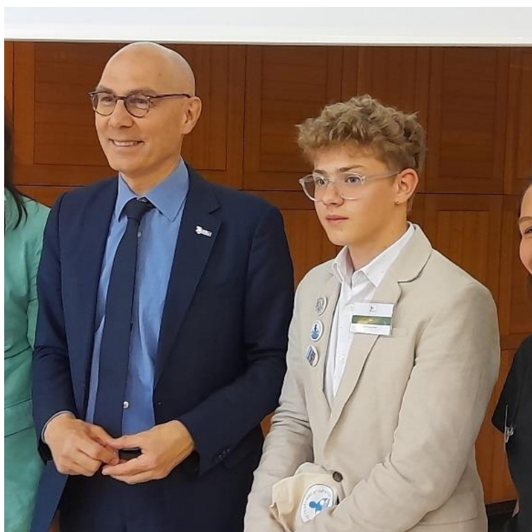
Slika 10. Proslava 40. godina Child Rights Connect organizacije, panel rasprava s Volkerom Turkom 18