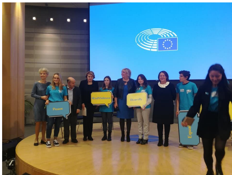
Slika 9. Obilježavanje Međunarodnog dana dječjih prava 17