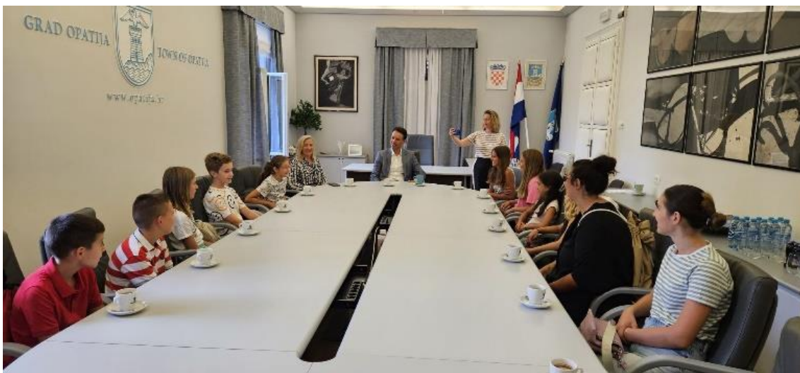
Slika 6. Posjet gradskim institucijama 11

Radionice se održavaju jednom na tjedan, a po potrebi i više puta tjedno u grupama od nekoliko vijećnika. Obrađuje se tema koju su odabrali, pripremaju se za prezentiranje rada na sjednicama. Vijećnike se educira kako pisati projekte, prikupljati mišljenja, stavove i prijedloge vršnjaka, prezentirati teme koje su odabrali, izraditi prezentacije, pretraživati materijale kritički, uče se pravilima ponašanja u online okruženju, osmišljavaju aktivnosti projekta i sadržaje kojima se žele baviti (Slika 7.).