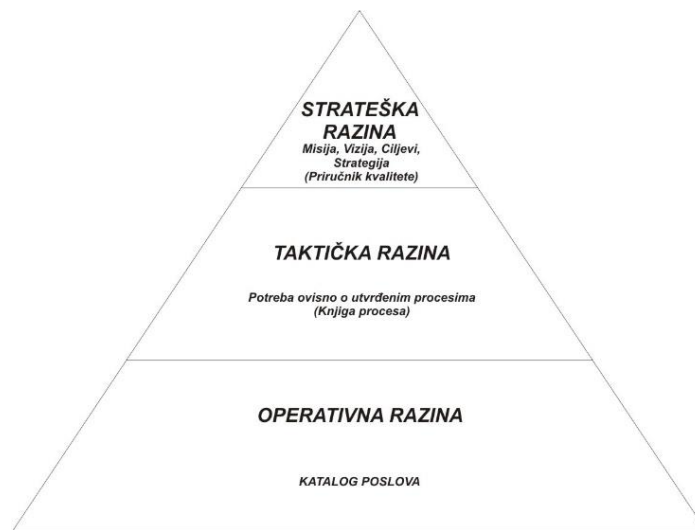
Slika 2. Razine menadžmenta