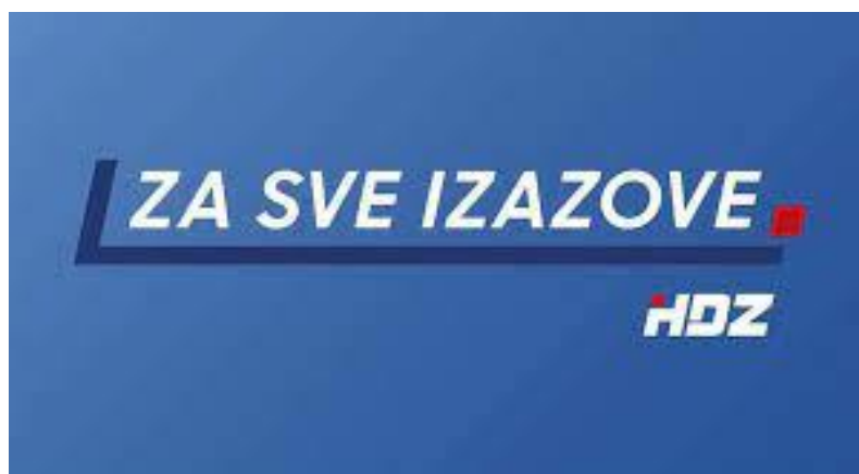
Slika 7: Slogan HDZ-a - ZA SVE IZAZOVE.