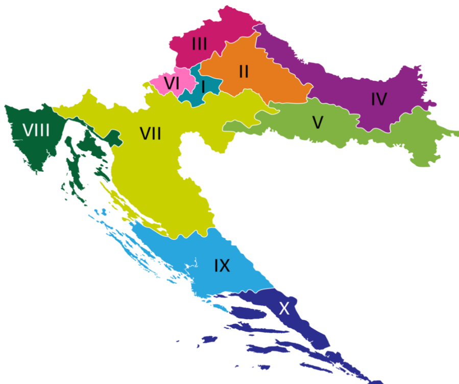
Slika 9: Prikaz izbornih jedinica