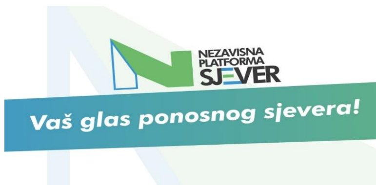
Slika 47: Slogan Nezavisne platforme Sjever - Vaš glas ponosnog Sjevera!

Tekst slogana je napisan bijelim slovima, pružajući jak kontrast u odnosu na zelenu i plavu pozadinu, što osigurava visoku čitljivost. Slova su velika i podebljana, naglašavajući važnost poruke. Font je moderan i čist, bez nepotrebnih ukrasa, što doprinosi ozbiljnosti i jasnoći dok je gradijentna traka s tekстом blago zakrivljena, što može sugerirati dinamiku i napredak. Slogan je centralno postavljen na plakatu, čineći ga glavnim fokusom. Iznad slogana nalazi se logo stranke.