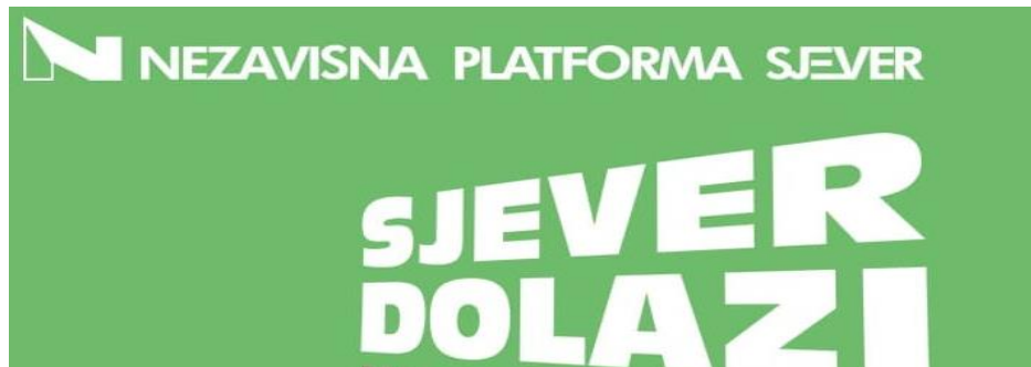
Slika 55: Slogan "SJEVER DOLAZI"

Poetska funkcija slogana "Sjever dolazi" manifestira se kroz izražavanje ritmičkog i motivacijskog tona. Riječ "dolazi" implicira nadolazeću promjenu ili napredak, što može potaknuti nadu i očekivanje među biračima sjevernih regija.