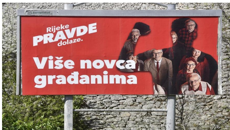
Slika 5: Slogan "Više novca građanima"

sredstava za građane. Ovaj slogan djeluje kao poziv na akciju (konativna funkcija), potičući birače da podrže stranku ili kandidata koji se obavezuju na financijsku podršku građanima.