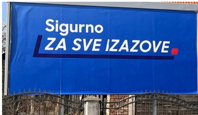
Slika 43: Slogan "Sigurno ZA SVE IZAZOVE."