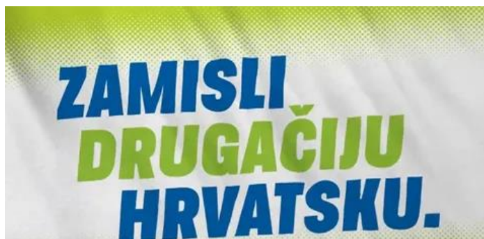
Slika 59: Slogan stranke MOŽEMO!

Plakat je dizajniran s naglaskom na slogan "Zamisli drugačiju Hrvatsku." na jednostavnoj, ali upečatljivoj pozadini. Pozadina ima gradijent boja koji se kreće od svijetlo zelene na vrhu do bijele prema dnu, doprinoseći dubini i vizualnom interesu. Gornji dio pozadine ima blagi točkasti uzorak koji dodaje dinamiku i suvremen izgled. Tekst je postavljen centralno i napisan je velikim i podebljanim fontom kako bi istaknuo važnost poruke. Riječi "ZAMISLI" i "HRVATSKU." su izražene tamnoplavom bojom, što ih čini vrlo vidljivima na svijetloj pozadini. Riječ "DRUGAČIJU" je napisana zelenom bojom, koja se uklapa u gornji dio pozadine, ali istovremeno se ističe na bijeloj podlozi, stvarajući kontrast i naglašavajući ključne dijelove poruke.