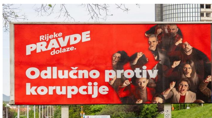
Slika 6: Slogan "Odlučno protiv korupcije"

Još jedan slogan koji se koristi istim funkcijama jest slogan "Odlučno protiv korupcije" (Slika 6). Ovaj slogan se ističe kao dodatna poruka koja naglašava čvrst stav stranke protiv korupcije, što je ključna tema u javnom diskursu i bitan faktor prilikom odlučivanja birača. Kombinacija različitih slogana poput "Rijeke pravde dolaze" i "odlučno protiv korupcije" pokazuje strategiju SDP-a da adresira širok spektar tema i da se pozicionira kao stranka koja se bori za transparentnost, integritet i društvenu odgovornost.