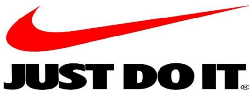
Slika 5: Slika slogana tvrtke Nike

Uspješnost slogana ovisi o jasnoći i jednostavnosti poruke, koja brzo prenosi željeni apel ili poziv na akciju te poznavanje željene publike/primatelja. U kontekstu prijevoda, slogan "Just Do It." ima konativnu funkciju jer djeluje kao direktan poziv na akciju ili odlučnost, potičući pojedinca da se pokrene. Često se prevodi kao samo naprijed ili samo učini, što jasno izražava imperativni ton i motivacijski karakter slogana.