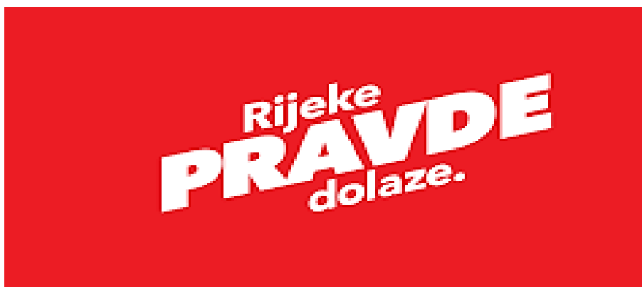
Slika 4 : Slogan SDP-a - RIJEKE PRAVDE DOLAZE

Plakat SDP-a koristi jednostavan, ali efektan dizajn za prenošenje svoje poruke. Na crvenoj pozadini, koja je prepoznatljiva boja stranke i simbolizira energičnost, ističe se slogan "Rijeke PRAVDE dolaze." (Slika 4). Slogan je napisan velikim bijelim slovima, pri čemu je riječ "PRAVDE" posebno istaknuta većim fontom i smjelim slovima, dok su riječi "rijeke" i "dolaze." napisane manjim fontom. Ova kombinacija naglašava važnost pravde kao ključne poruke kampanje. Dizajn je jednostavan, čist i direktan, što omogućava lako razumijevanje poruke. Upotreba crvene boje privlači pažnju i stvara vizualni kontrast s bijelim tekstom, što povećava čitljivost. Nagib teksta dodaje dinamičnost i osjećaj kretanja naprijed, što simbolizira dolazak promjena i pozitivne akcije.