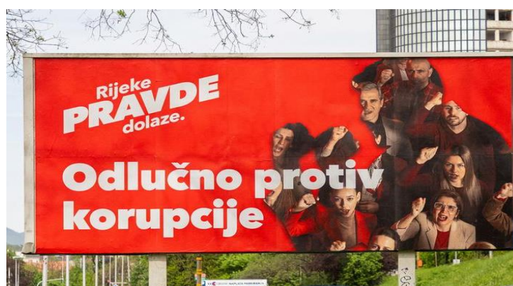
Slika 6: Slogan "Odlučno protiv korupcije"

Još jedan slogan koji se koristi istim funkcijama jest slogan "Odlučno protiv korupcije" (Slika 6). Ovaj slogan se ističe kao dodatna poruka koja naglašava čvrst stav stranke protiv korupcije, što je ključna tema u javnom diskursu i bitan faktor prilikom odlučivanja birača. Kombinacija različitih slogana poput "Rijeke pravde dolaze" i "odlučno protiv korupcije" pokazuje strategiju SDP-a da adresira širok spektar tema i da se pozicionira kao stranka koja se bori za transparentnost, integritet i društvenu odgovornost.