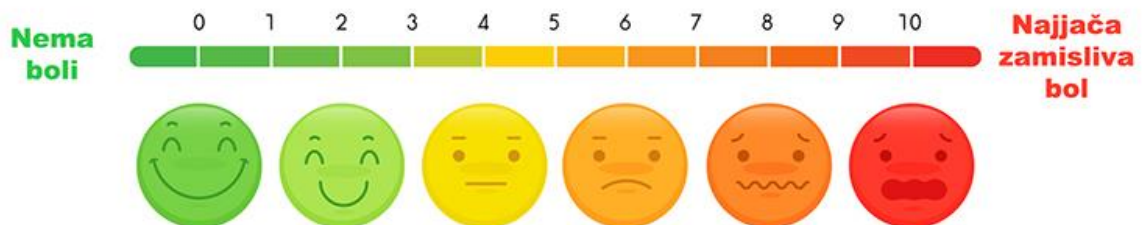
Slika 2. Jednodimenzionalna skala za procjenu bola izrazima lica

tbn0.gstatic.com/images?q=tbn:ANd9GcQFgmoaUkF9dPXoK3SI2eXsalRooVuCLcuMZQ5gQFk3Dw&s