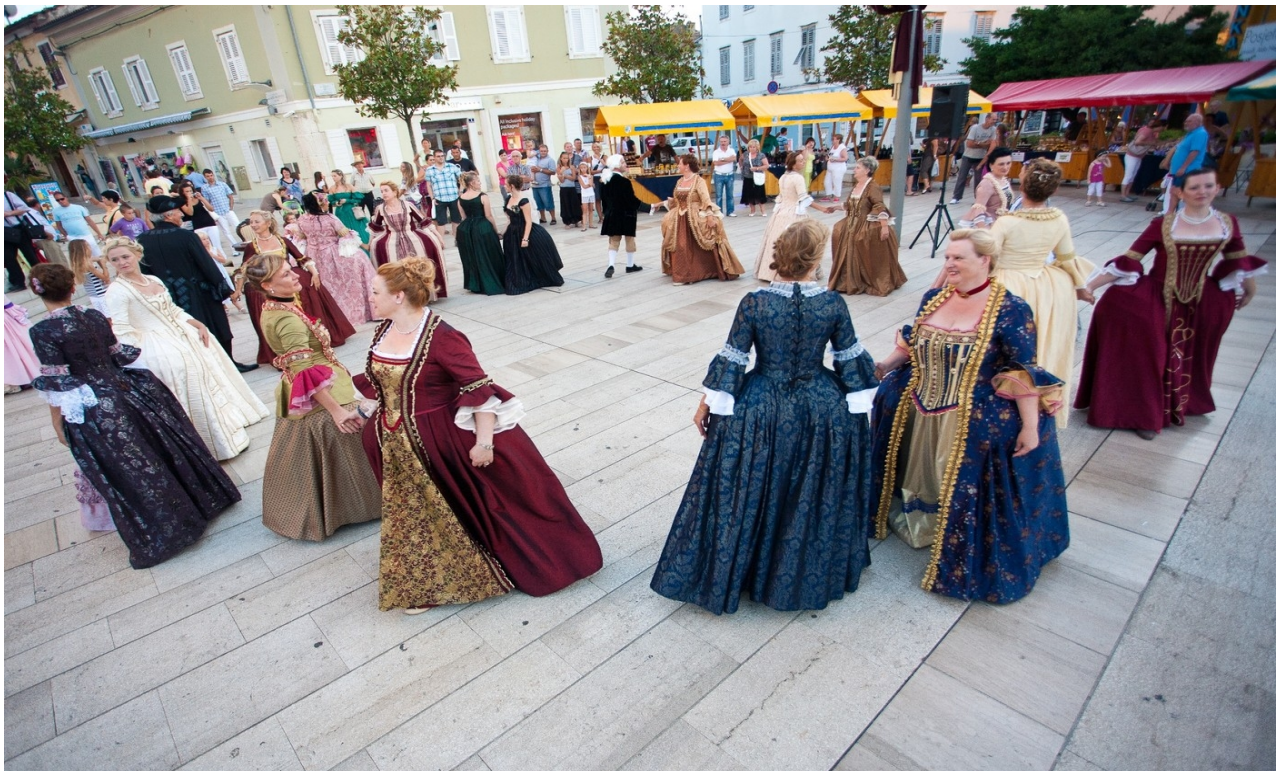
Slika 3. Giostra