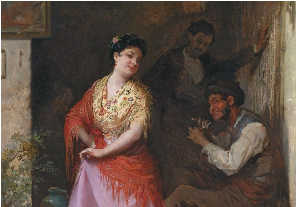
Slika 4. La mula de Parenzo

Iako bi ta djevojka možda mogla biti tek imaginarni lik, njezine karakteristike ili snove možemo potražiti kod većine žena onoga vremena, a i danas je vrlo živa u svakome od nas. Žene su tada, često iz nužnosti, ali i uslijed želje za slobodom izbora, tražile način stvaranja prihoda. Od druge polovice 19. stoljeća dolazi do povoljnih prilika za poslovnu aktivnost žena među pripadnicima srednjega i sitnog građanstva. Žene tako počinju činiti znatan udio među obrtnicima i trgovcima. Postaju krojačice, prodavačice voća i povrća, prodavačice ribe, gostioničarke, trgovkinje.