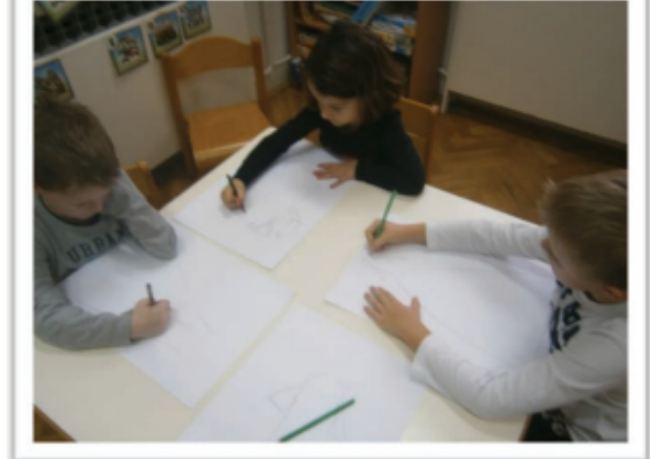
Slika 8. Djeca promatraju i crtaju narodnu nošnju

Nakon što su taktilno ispitala od kojega je materijala izrađena narodna nošnja, djeca (slika 8) promatraju i crtaju narodnu nošnju bojicama.