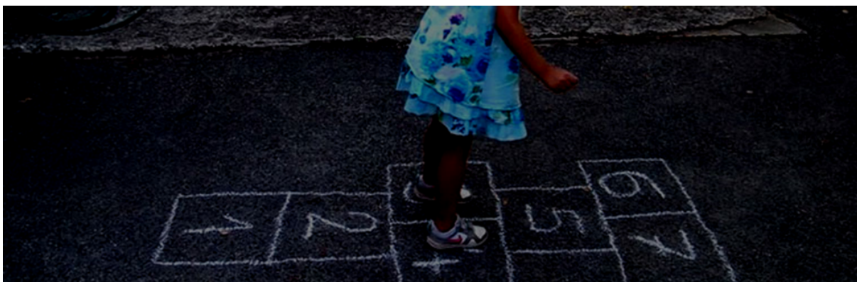
Slika 5. Igra školica

U igri Laste prolaze dvoje djece napravi luk, a ostali u koloni prolaze ispod njihovih uzdignutih ruku. Onoga kojega posljednjeg uhvate u prolaz pitaju: „Za koga ćeš?“, on kaže ime jednoga od njih koji su napravili luk i stane iza njega. Provlačenje se nastavlja dok se svi ne razdijele. Igra se nastavlja dok samo jedno dijete ne ostane u koloni koja prolazi ispod luka i ono je pobjednik. Pobjednički luk je onaj koji je odabrao više lastavica.