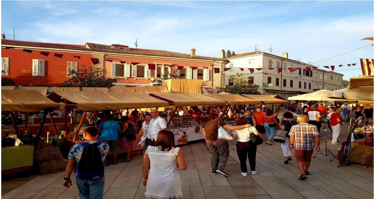
Slika 2. Sijam Giostra