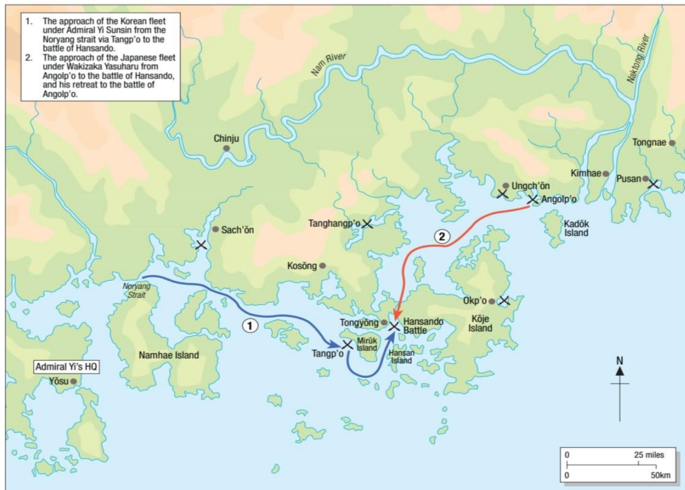
Karta 2. Prva japanska invazija: Bitke na moru (Turnbull, 2008: 34)

Prva korejska pobjeda izvojevana je u pomorskoj Bitci kod Okp'oa (vidi: karta 2). O detaljima doznajemo iz zapisa admirala Yi Sunsin. Njegova izviđačka plovila opazila su japanske brodove u luci grada Okp'oa, opkolila ih i otvorila vatru brodskim topovima i vatrenim strijelama. Prvi dan uništeno je 26 japanskih brodova, a još 11 sljedeći dan bez da je izgubljen ijedan korejski brod. Yi je bio zaintrigiran predmetima koje su uzeli s japanskih brodova zapisujući ih detaljno u svoj dnevnik, naglašavajući da kod promatrača izazivaju strahopoštovanje, kao što se to osjeća prema duhovima ili čudnim zvijerima (Turnbull, 2008: 32).