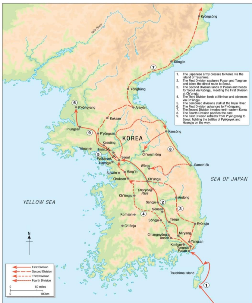
Karta 1. Prva japanska invazija (Turnbull, 2008: 25)