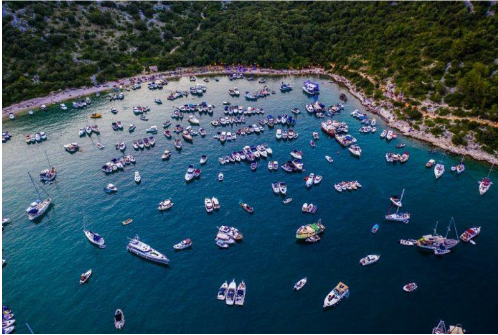
Slika 10. Usidri se za Rišpet – uvala Luka