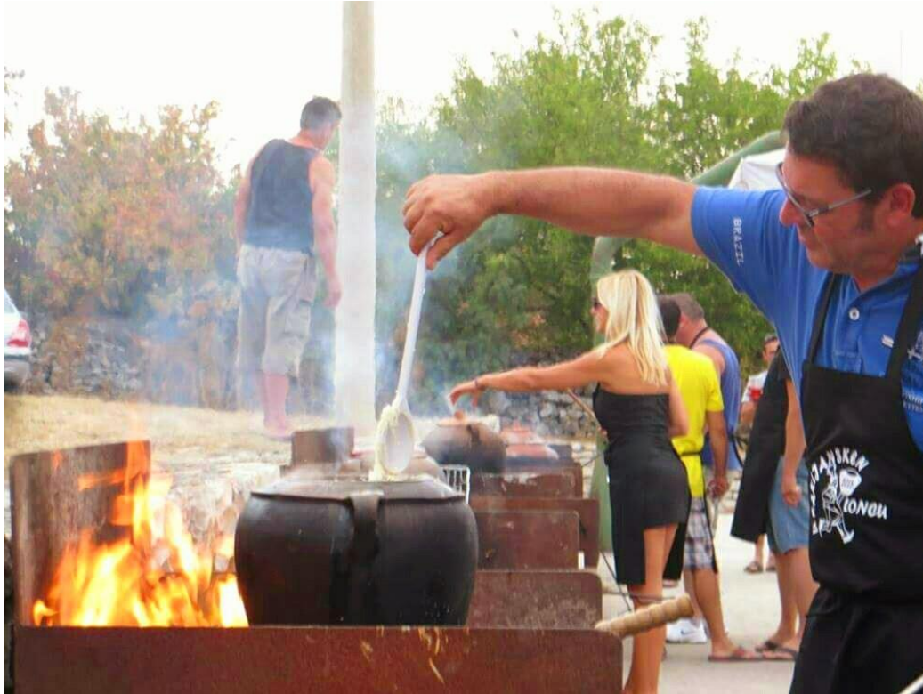
Slika 7. Gastro manifestacija "U Rakljansken loncu"