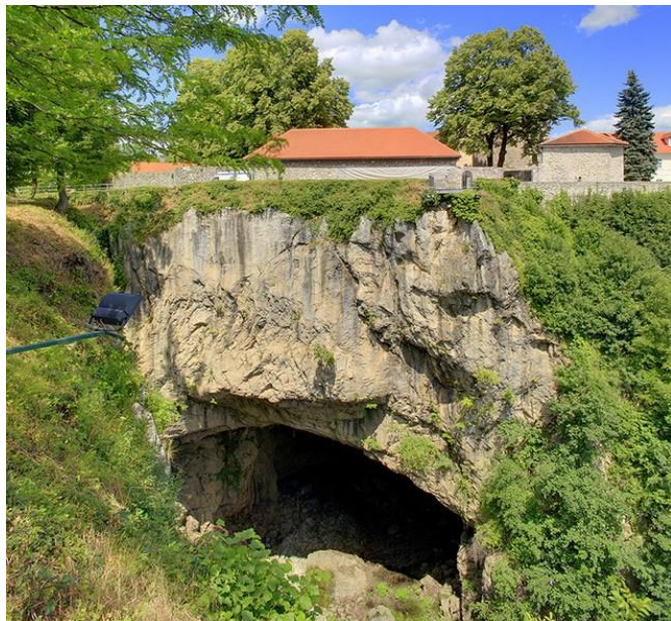
Slika 2. Đulin ponor

zagleda u liticu s koje se bacila Zulejka, možemo uočiti profil muškarca, a stanovnici Ogulina kažu da to kapetan Milan gleda gdje je Zulejka. Špilja koja se nalazi na kraju ponora je špilja Medvednica koja je duga više od 16 kilometara. Grad Ogulin je jedini u Hrvatskoj koji se nalazi iznad špilja obogaćene vodom.