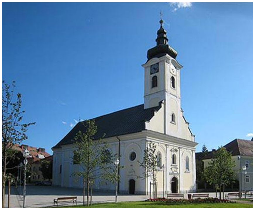
Slika 6. Crkva sv. Križa