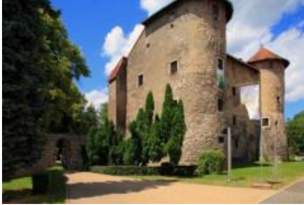
Slika 4. Frankopanski kaštel