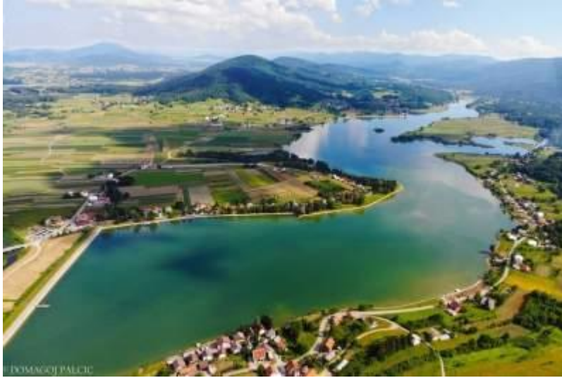
Slika 7: Jezero Sabljaci