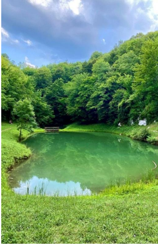
Slika 5. Šmitovo jezero