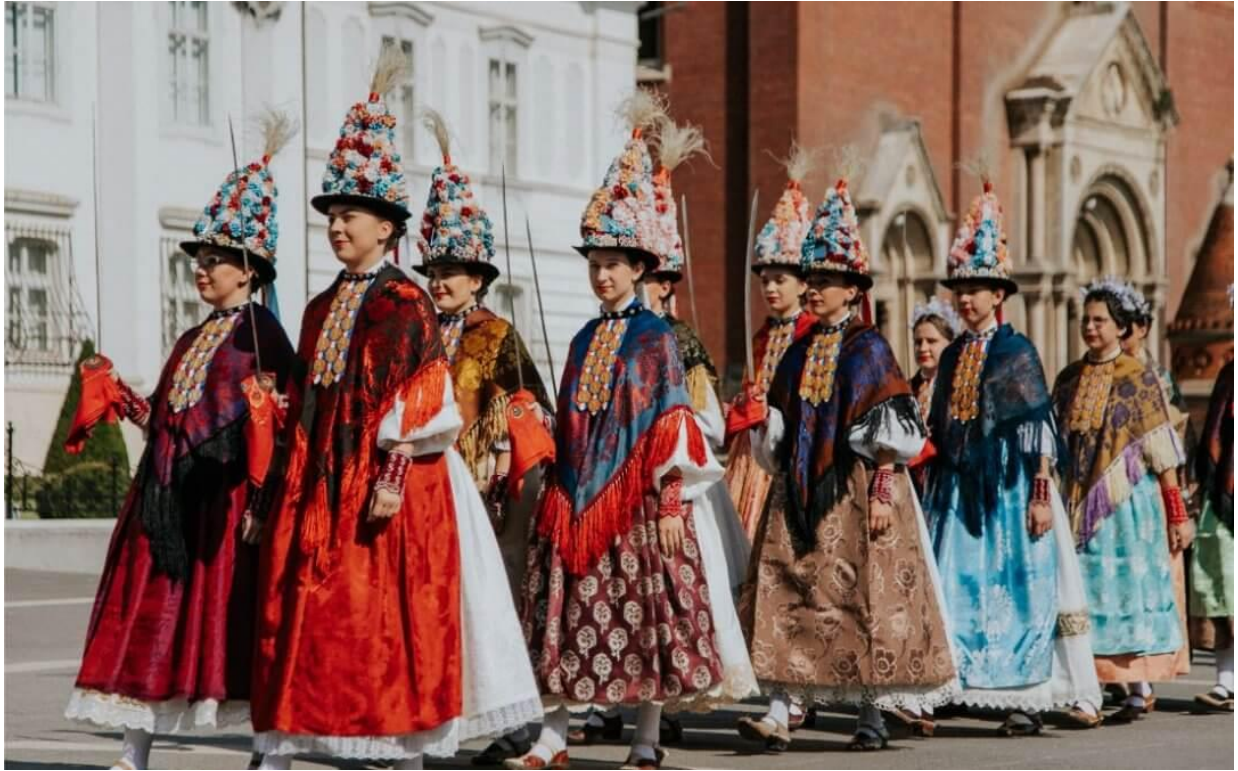
Slika 3. Đakovački vezovi