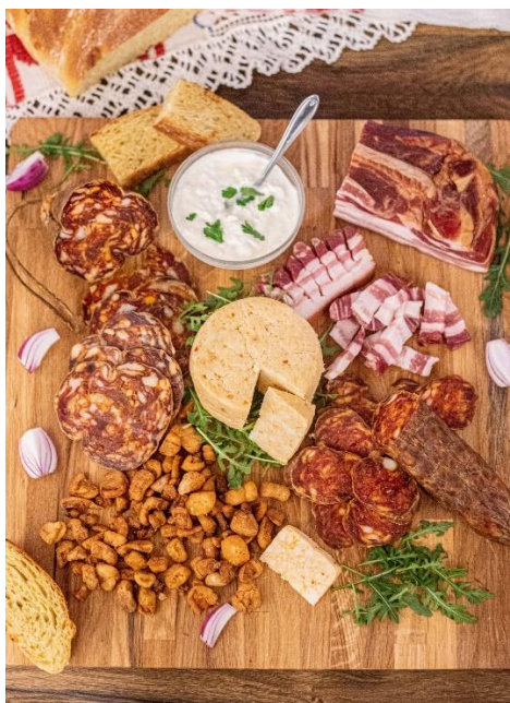
Slika 8. Gastronomija Slavonije

U slavonskoj tradiciji posebno mjesto zauzimaju razni kolači i slastice poput štrudli, buhtli, paprenjaka, orahnjače i makovnjače. Ovi slatkiši često se pripremaju u obiteljskim domovima tijekom blagdana i posebnih prigoda, čuvajući tako tradicionalne recepte i tehnike pečenja.