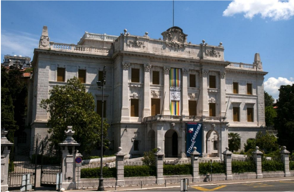
Slika 12. Pomorski i povijesni muzej Hrvatskoj primorja u Rijeci