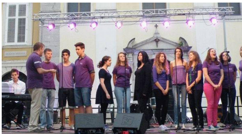
Slika 21. kulturni događaj, "Vidfest"