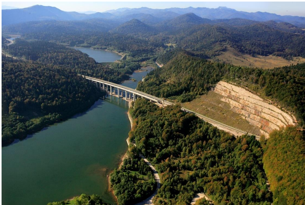
Slika 8. Jezero Bajer