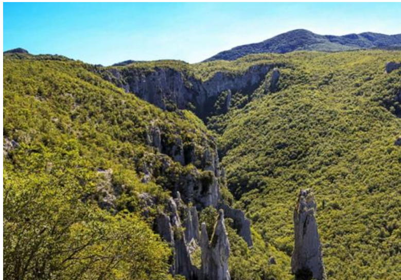
Slika 6. Park prirode Učka