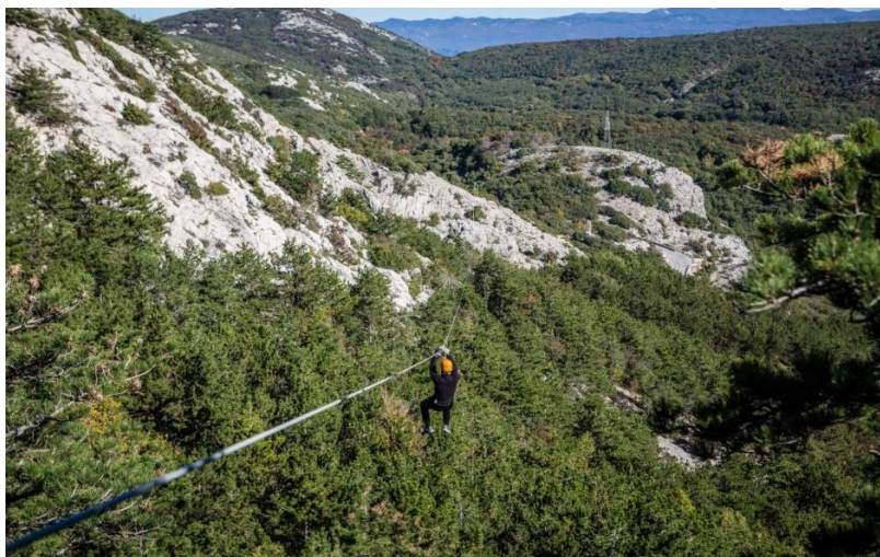
Slika 16. Zipline Edison, Krk