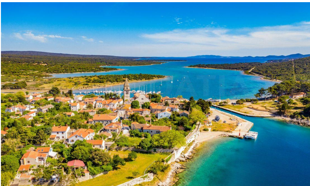
Slika 2. Otok Cres

Posjetiteljima su omogućene brojne znamenitosti, uključujući crkve, palače i tvrđave. Cres je također popularna turistička destinacija, posebno tijekom ljetnih mjeseci, kada posjetitelji dolaze uživati u kristalno čistom moru, lokalnoj gastronomiji i opuštenom mediteranskom načinu života. U nastavku je prikazan otok Cres: