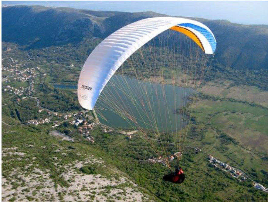
Slika 17: Paragliding, Tribalj