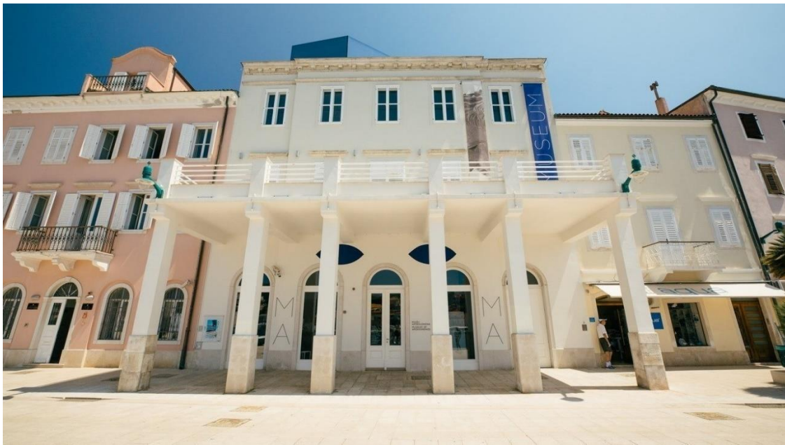
Slika 14. : Muzej Apoksiomena