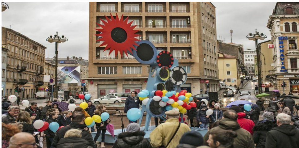
Slika 20. Europska prijestolnica kulture, Rijeka 2020. godine