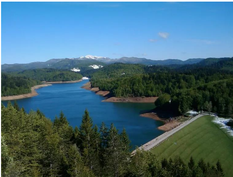
Slika 7. Lokvarsko jezero