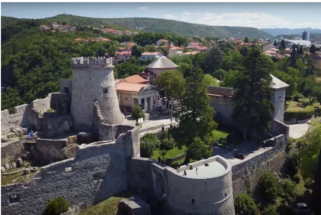
Slika 9. Trsatska gradina