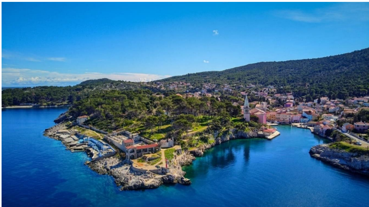
Slika 4. Otok Lošinj