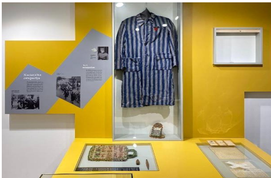
Slika 13. Unutrašnjost Kastavskog kulturnog muzeja