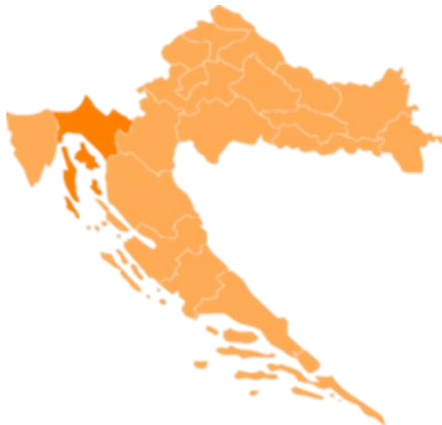
Slika 1. Primorsko-Goranska županija na karti Hrvatske