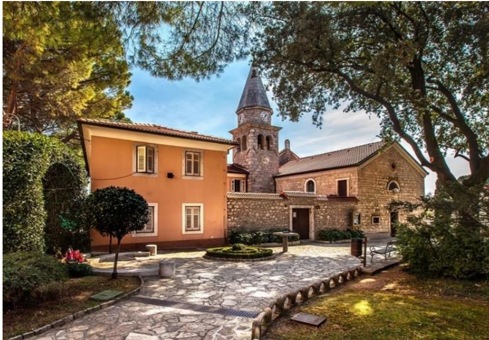
Slika 10. Crkva sv. Jakova