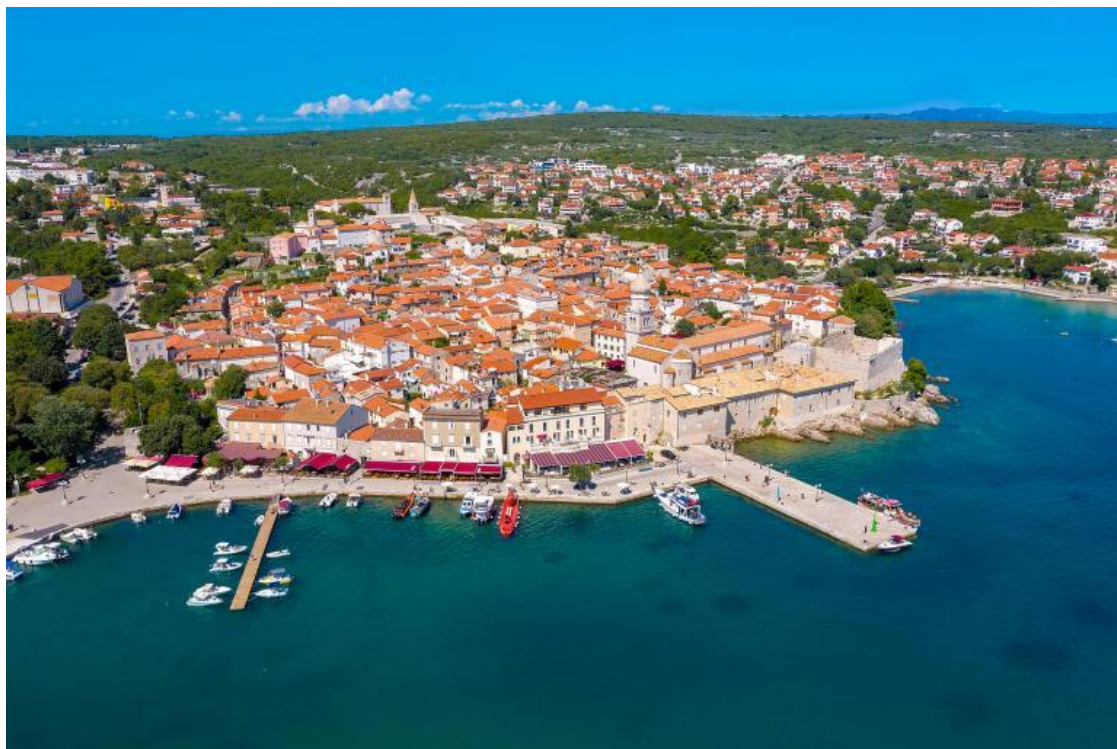
Slika 3. Otok Krk