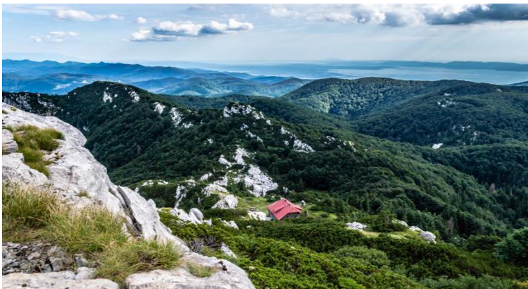
Slika 5. Nacionalni park Risnjak