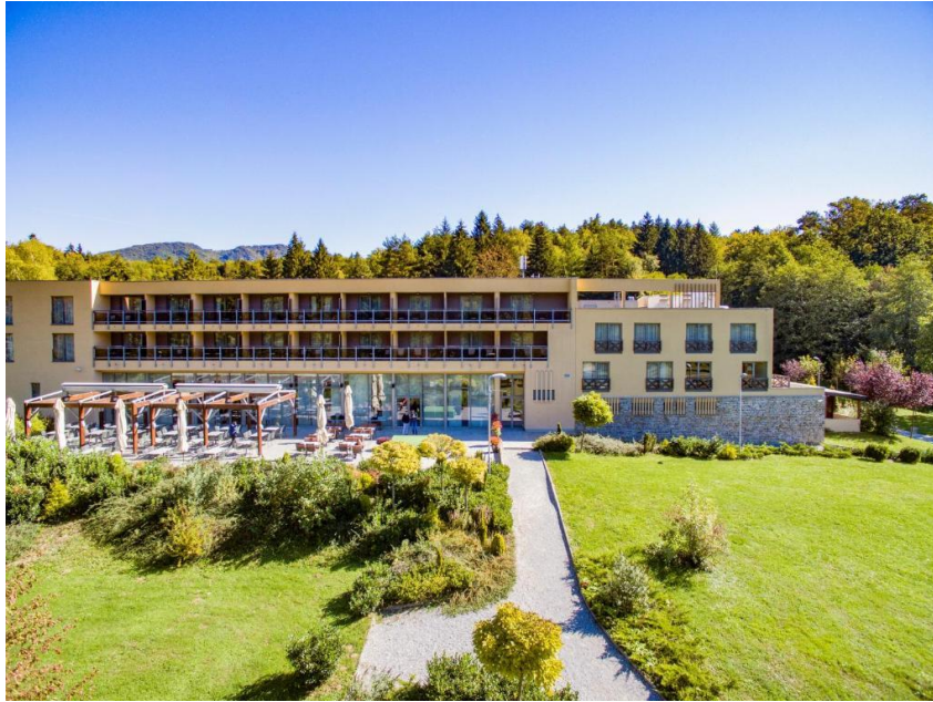
Slika 6 Hotel Trakošćan