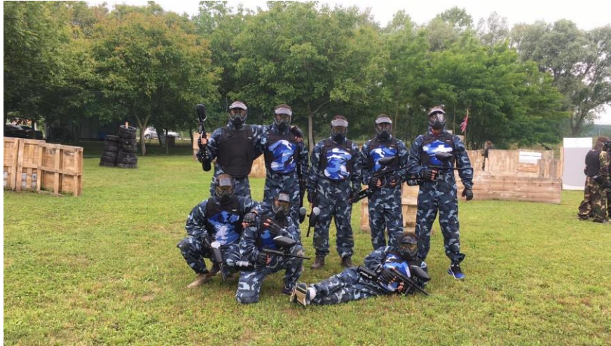
Slika 8 Adrenalinski park "Vručina"