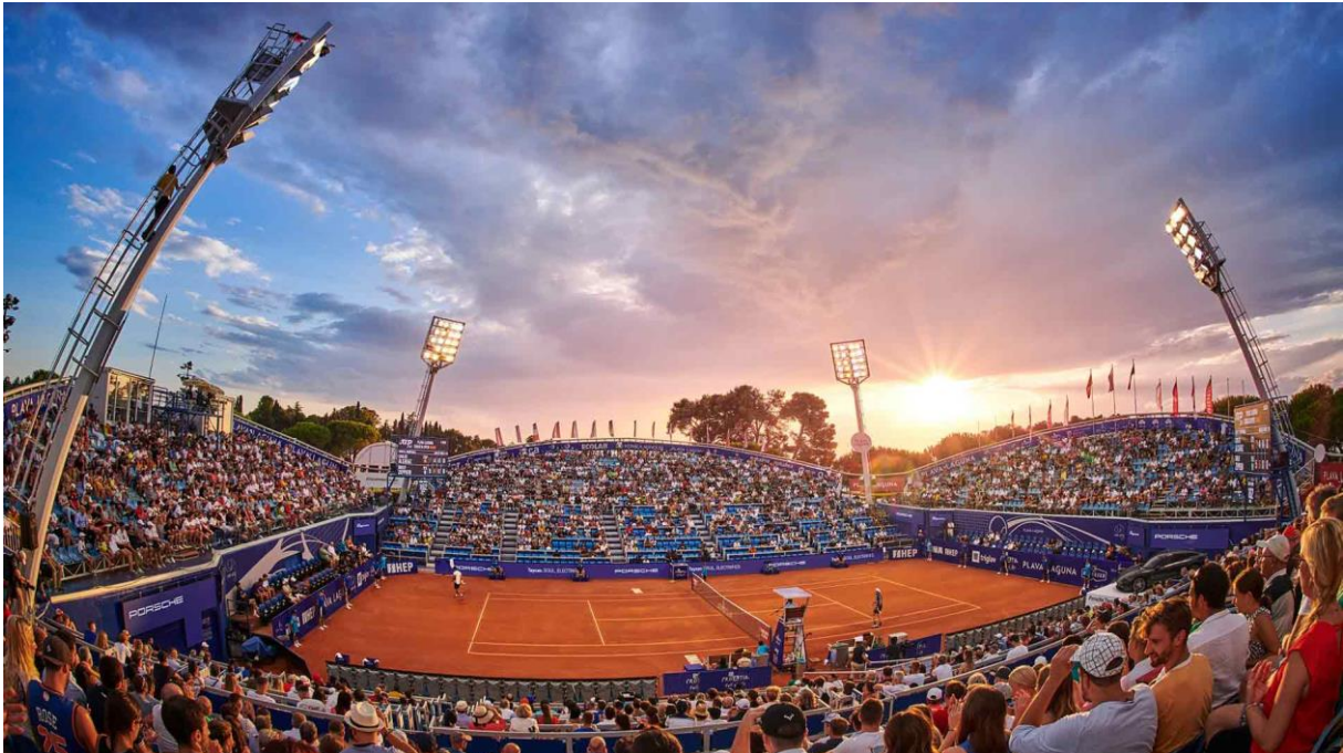
Slika 3 Croatia Open Umag, Izvor: ATP Tour, Dostupno na: https://www.atptour.com/en/tournaments/umag/439/overview (Pristupljeno: 19.8.2024.)

ATP Croatia Open Umag predstavlja jedan od najvažnijih i najprestižnijih teniskih turnira u Hrvatskoj koji se održava u obalnom gradu Umagu, smještenom na zapadnoj obali Istre. Ovaj turnir, koji je dio ATP World Tour 250 serije, privlači vrhunske svjetske tenisače i ljubitelje tenisa iz cijelog svijeta, te se ističe kao značajan sportski događaj u regionalnom i međunarodnom kalendaru.