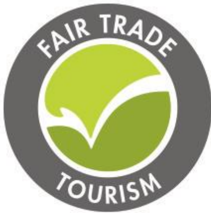
Slika 2: Zaštitni znak Fair Trade turizma