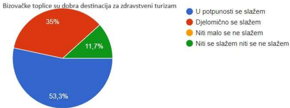
Graf 4 Bizovačke toplice su dobra destinacija za zdravstveni turizam