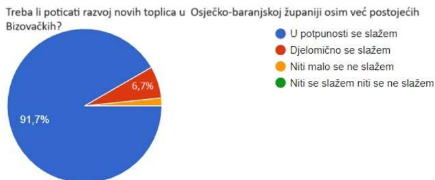
Graf 3 Razvoj novih toplica u Osječko-baranjskoj županiji

3. Treba li poticati razvoj novih toplica u Osječko-baranjskoj županiji osim već postojećih Bizovačkih?