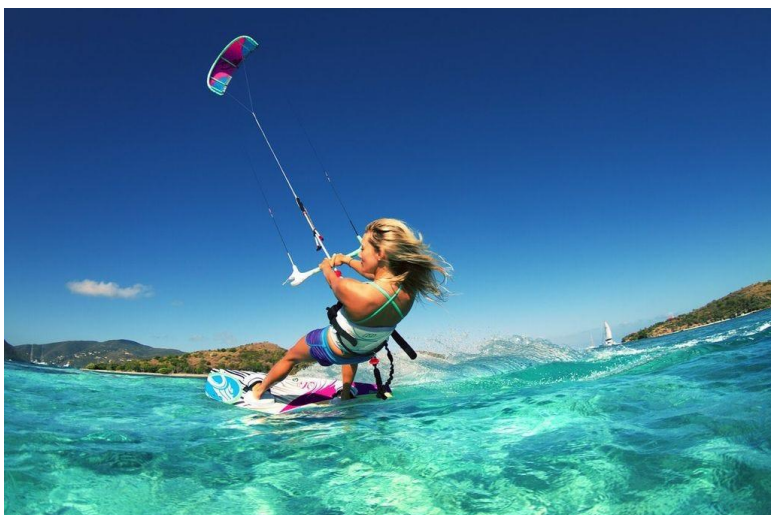
Slika 25 Kitesurfing