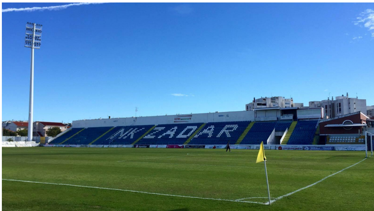
Slika 2 Stadion Stanovi NK Zadar