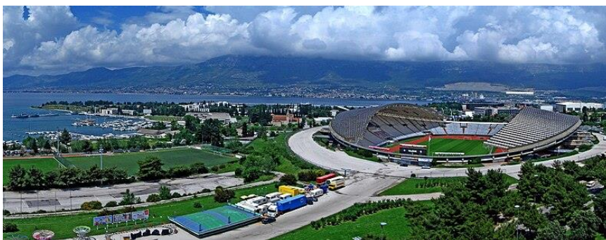
Slika 21 Stadion Poljud

Splitsko-dalmatinska županija je poznata po razvijenoj sportskoj infrastrukturi, no ima i prostora za napredak. Brojna sportska događanja i aktivnosti omogućavaju stadioni, klubovi, objekti i sadržaji. Ovo poglavlje istražuje najvažnije sportske objekte u županiji, uključujući stadione, sportske centre i specijalizirane objekte. Stadion Poljud koji je smješten u Splitu jedan je od najpoznatijih sportskih stadiona u Hrvatskoj. Gradski stadion Poljud, poznat je pod nadimkom Poljudska ljepotica, nalazi se u splitskoj četvrti Poljudu na sjeverozapadu grada, na mjestu gdje je nekad bilo ljekovito blato. Izgrađen je 1979. godine u sklopu izgradnje sportskih objekata Mediteranskih igara. „Arhitektonski je to objekt koji funkcionalnošću i tehničkim značajkama spada u vrh svjetskih standarda i ponosno se može nositi sa stadionima izgrađenim diljem svijeta.“ 49 Danas na stadionu HNK Hajduk ugošćava europske i svjetske momčadi te je najviše poznat po nogometnim utakmicama i skupini temperamentnih, ludih navijača, Torcide.