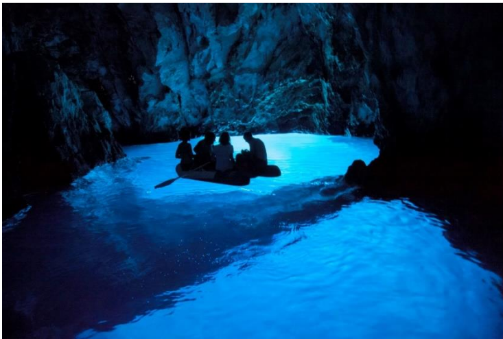
Slika 13 Plava špilja na otoku Biševo

Nacionalni park Kornati je pravi raj za ronioce. On vrvi od koraljnih grebena i njihove fascinantne formacije, podvodnih špilja i olupina brodova.