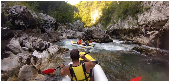
Slika 32 Neretva Kajak

se grupne i individualne kajak ture sa iskusnim vodičem te je to najbolji način za upoznati ljepotu županije te doživjeti Dubrovačko-neretvansku županiju u drugačijem doživljaju i perspektivi, gledajući na obale i otoke. Dubrovačko neretvanska županija ima širok izbor kajak tura. U ponudi imaju: Dubrovnik sunset kayaking & snorkeling, Dubrovnik sunset paddel with wine, Sea kayaking in Šipan and Ruda, Afternoon Dubrovnik guided tour i još mnoge druge. Ne smije se zaboraviti spomenuti i kajak na Neretvi. „Neretva je jedna od onih rijeka koje svojim bogatstvom i silinom ulijevaju strahopoštovanje na kojem se god dijelu nalazili. Tako je posebice kod ušća, koje je zapravo jedina delta na ovim prostorima. Izvire u Bosni i Hercegovini na oko tisuću metara nadmorske visine između planina Prenja i Bjelolasice te potom huči kroz moćne kanjone, a tek nakon dvjestotinjak kilometara prelazi u Hrvatsku, gdje se nastavlja raskoš prirodne i kulturne baštine.“ 73 Plovidba kanuima već je dugogodišnja tradicija u Hrvatskoj.