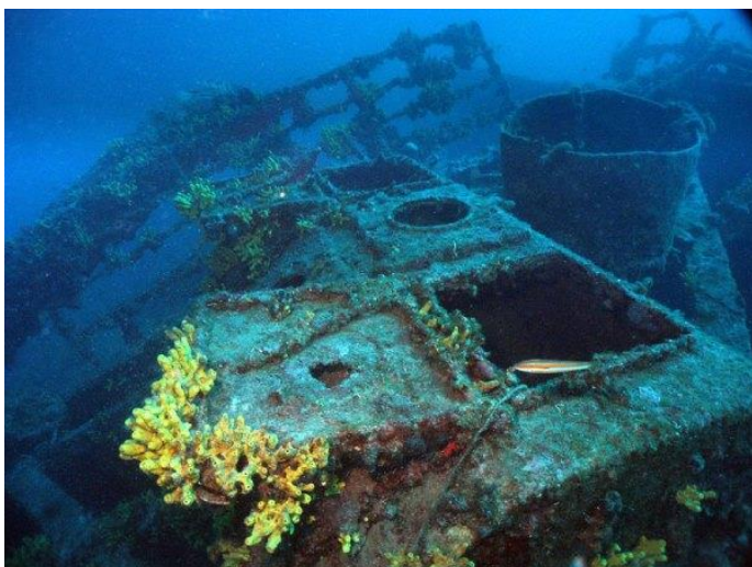
Slika 14 Olupina Francesca da Rimini

Olupina Francesca da Rimini nalazi se u blizini Šibenika. Brod je potopljen tijekom Drugog svjetskog rata. Istraživanje olupine pruža ronionicima pogled u povijest. „Francesca da Rimini talijanski je teretni ratni brod izgrađen u Rijeci 1942. Dug je 42 m, širok 12 m i ukupne težine 281 tonu.“ 31