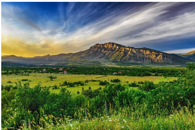
Slika 15 Dinara