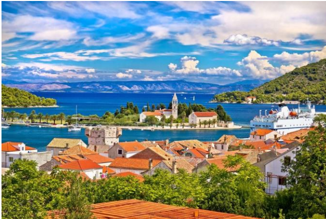
Slika 29 Otok Vis

koja privlači mnogo turista diljem svijeta. Svaki od ovih otoka ima jedinstvene prirodne i kulturne znamenitosti te ih čini idealnim lokacijama za različite sportske aktivnosti.