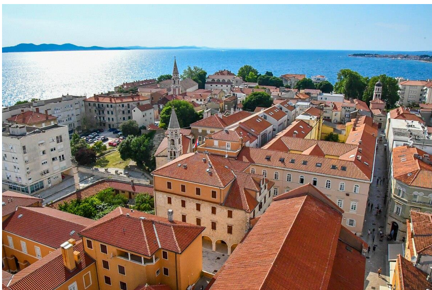
Slika 6 Zadar