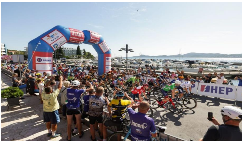
Slika 8 BiogradRUN