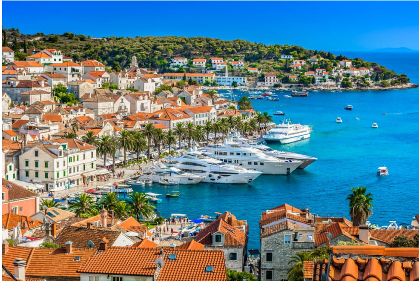
Slika 28 Otok Hvar