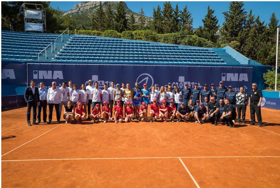
Slika 20 WTA Croatia Bol Open

WTA Croatian Bol Open: Je godišnji teniski turnir za žene na WTA Challenger Touru, koji se igrao u gradu Bolu na hrvatskom jadranskom otoku Braču. „Teniski turnir u Bolu na Braču davno je prešao hrvatske granice, turističku perjanicu otoka Brača pozicionirajući kao destinaciju s multiprofiliranim sadržajnim programom“. 47 Prvo izdanje turnira održano je krajem travnja 1991., a potom svake godine od 1995. do 2003. Turnir je tada prodan organizatorima Western & Southern Opena i preseljen u Cincinnati. Kasnije u 2016. do 2021. bio je opet organiziran u Bolu na otoku Braču. S time da je 2020. godina bila otkazana zbog pandemije COVID, a 2021. bila je posljednja godina jer se u 2022. godini premjestilo u Makarsku.