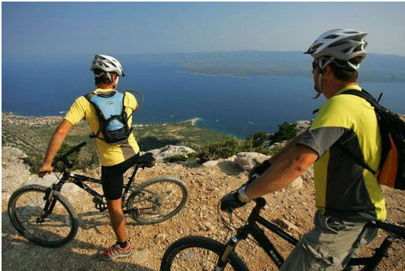
Slika 24 Biciklistička tura od vrha do mora

„Otok s dvadeset i pet uređenih biciklističkih staza, preračunato u kilometre, Brač ima tisuću dvadeset i šest kilometara staza, što ga čini otokom s najviše kilometara biciklističkih staza.“ 56 Biciklisti se mogu usrećiti sa svim slikovitim mjestima na otoku sa svih strana. Biciklom se može proći po rutama koje većinom nose imena svetaca. Staza sveti Juraj dobila je ime po zaštitniku otoka te je ona duga 180,13 kilometara i povezuje cijeli otok. Može se prolaziti svugdje pa čak i do vrha otoka gdje turiste čeka predivan pogled. Ima nekoliko biciklističkih staza, razne su duljine. Postoji 64,10 km, 103,40 km, 36,90 km, najdulja 180,13 km, a ostale su većinom do 50 kilometara.