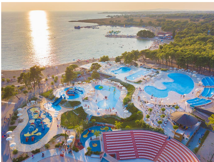
Slika 9 Zaton holiday resort

Grad Nin je jedan od najstarijih gradova u Hrvatskoj, poznat po svojoj kulturnoj baštini i prirodnim ljepotama, ali također nudi sportske aktivnosti koji su privlačni za sve posjetitelje. U Ninu je poznata laguna koja pruža bavljenje svim vrstama sporta. U okolici Nina postoje 110 km uređenih biciklističkih staza koje imaju prekrasne vidike na krajolik i netaknutu prirodu. „Ninska laguna, je zahvaljujući povoljnim vjetrovima, pogodna za jedrenje na dasci kao i sve popularnije zmajarenje. Za početnike, kao i one koji žele obnoviti sportske vještine, recimo i to da se ovdje organiziraju i škole svih ovih sportova te iznajmljuje vrhunska oprema. Ovdašnji konjički klub organizira turističko rekreativno jahanje za djecu i odrasle, tečaj jahanja te terapijsko jahanje.“ 24 Zaton Holiday resort ima dugačak popis sportova koji su mu dio ponude. U turističkom naselju nalaze se teniski tereni, tereni za odbojku, mali nogomet, kuglanje, stolni tenis i mini golf. Postoji i mogućnost učenja i edukacije jer imaju škole jedrenja i parasailinga.