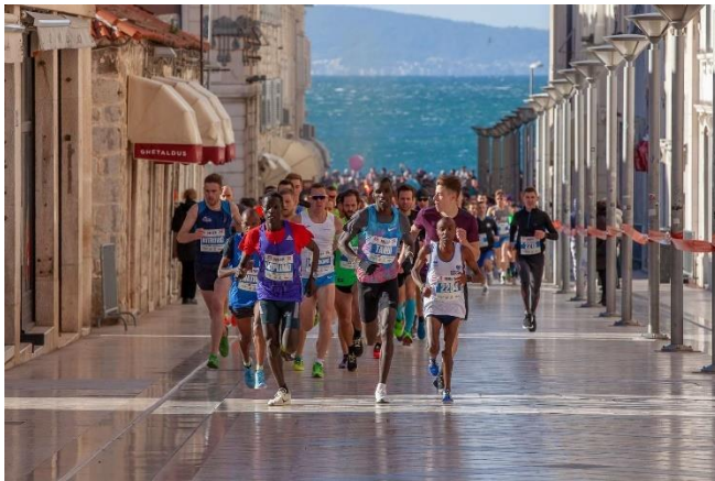
Slika 18 Split Half Marathon