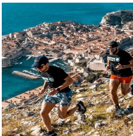
Slika 33 Spartan trail