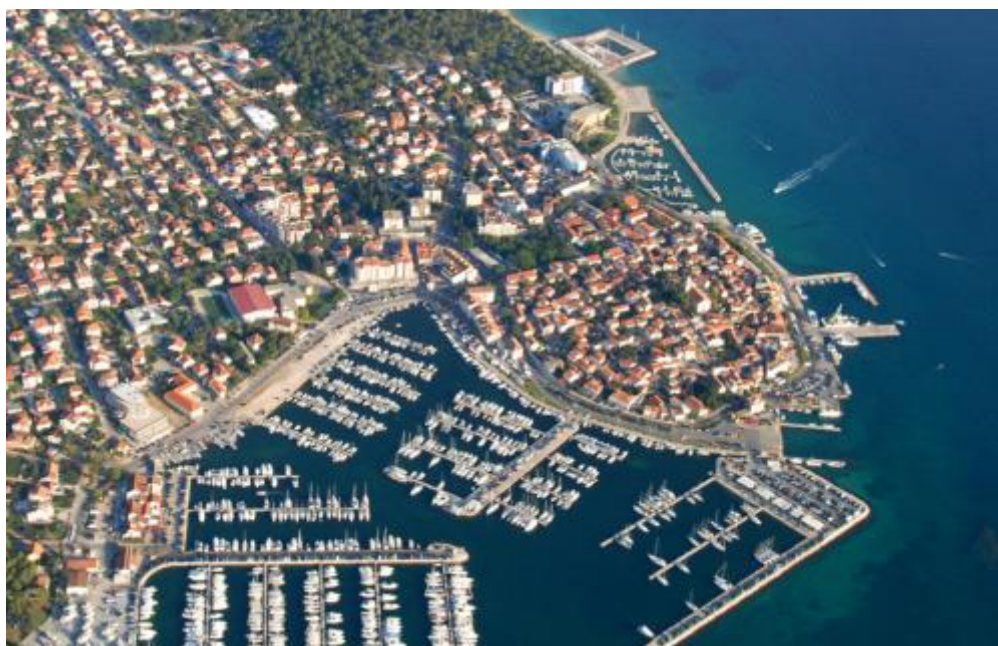
Slika 3 Marina Kornati Biograd na Moru

turizam po cijelom Jadranu, i prvu vlastitu charter flotu od četrdeset Elanovih plovila, te je s punim pravom ponijela naziv pionira nautičkog turizma, dok je grad Biograd postao kolijevka nautičkog turizma.“ 16 Marina Kornati je danas među top 3 marina u Hrvatskoj. Marina je kompletirala svoje usluge i povećala kapacitet te sadrži 805 vezova od čega ih je 70 na kopnu i 15 na gatova sa priključcima za struju i vodu.