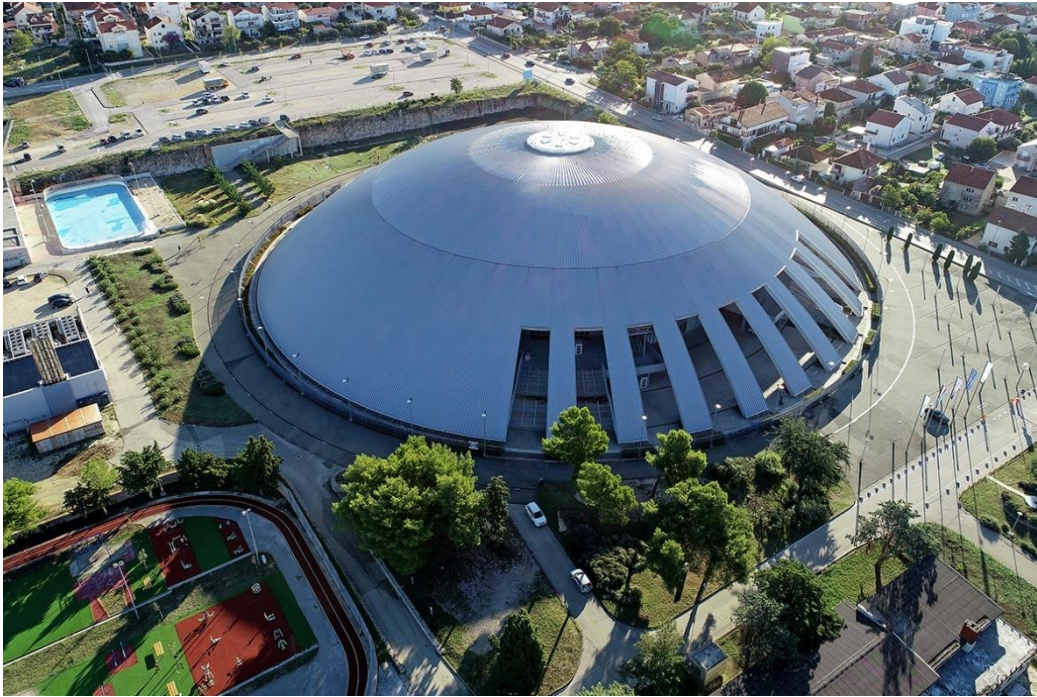
Slika 1 Sportski centar Višnjik u Zadru

Sportski centar Višnjik obuhvaća multifunkcionalnu dvoranu koja nije samo domaćin sportskim događanjima nego i sportske i kulturne manifestacija (kampovi, festivali, sajmovi, kongresi, izložbe, seminari, koncerti i slično) a sve kako bi se omogućilo građanima Zadra da upotrebom sportske i rekreacijske infrastrukture podignu razinu fizičke i zdravstvene kulture i sportske rekreacije.