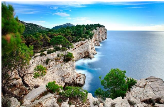
Slika 5 Nacionalni park Kornati

Prema svemu navedenom Zadarska županija pruža vrhunske uvjete za održavanje i organizaciju raznih sportskih događanja i aktivnosti. Krenuvši od rekreativnih sportskih sadržaja do sportskih centara i stadiona, te nautičkih marina i biciklističkih staza pa sve do modernih vodenih sportova. Ulažući u cijelu sportsku infrastrukturu, Zadarska županija pokazuje sebe kao vodeću destinaciju sportskog turizma u Dalmaciji te potiče ne samo turiste već i lokalno stanovništvo na bavljenje sportskom aktivnošću.