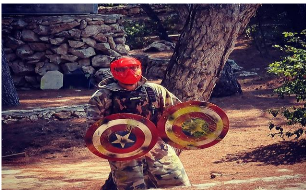
Slika 26 Paintball u Adventure Park Hvar Jelsa