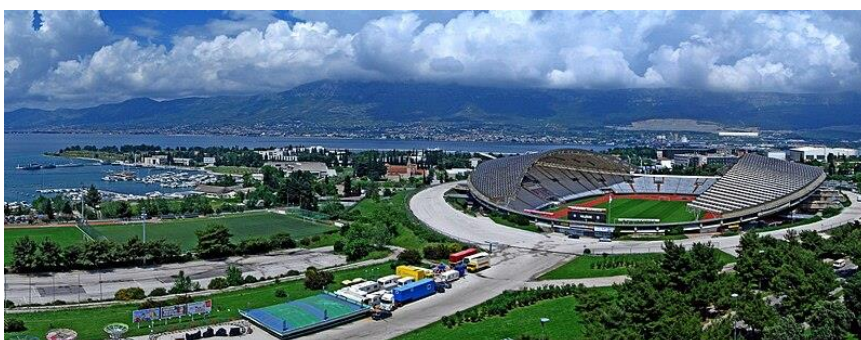
Slika 21 Stadion Poljud

Splitsko-dalmatinska županija je poznata po razvijenoj sportskoj infrastrukturi, no ima i prostora za napredak. Brojna sportska događanja i aktivnosti omogućavaju stadioni, klubovi, objekti i sadržaji. Ovo poglavlje istražuje najvažnije sportske objekte u županiji, uključujući stadione, sportske centre i specijalizirane objekte. Stadion Poljud koji je smješten u Splitu jedan je od najpoznatijih sportskih stadiona u Hrvatskoj. Gradski stadion Poljud, poznat je pod nadimkom Poljudska ljepotica, nalazi se u splitskoj četvrti Poljudu na sjeverozapadu grada, na mjestu gdje je nekad bilo ljekovito blato. Izgrađen je 1979. godine u sklopu izgradnje sportskih objekata Mediteranskih igara. „Arhitektonski je to objekt koji funkcionalnošću i tehničkim značajkama spada u vrh svjetskih standarda i ponosno se može nositi sa stadionima izgrađenim diljem svijeta.“ 49 Danas na stadionu HNK Hajduk ugošćava europske i svjetske momčadi te je najviše poznat po nogometnim utakmicama i skupini temperamentnih, ludih navijača, Torcide.