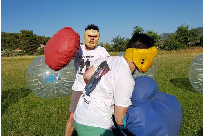
Slika 27 Giant boxing

Također je zanimljiv i human table football gdje se umjesto umjetne figure stolnog nogometa zamjenjuju ljudi. Giant boxing je također atraktivan za boksače. To je borba s divovskim rukavicama gdje je poanta nokautirati protivnika ili ga izbaciti iz ringa. Igra stvorena za najbolje prijatelje.