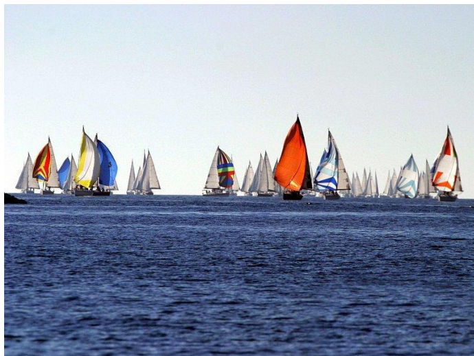
Slika 10 Kornati Cup

gradu posebice u recentnije vrijeme. 2010. godina grad broji gotovo 371 tisuću noćenja, a u samom vrhuncu sezone u gradu je bilo i do čak 60 tisuća turista. U gradu su otvoreni mnogobrojni hoteli od kojih su najpoznatiji Olimpija (4*) i Olympija Sky (4*), hotel Punta (*4) i hotel Imperial (3*). 28 Marina Mandalina u Šibeniku postala je jedna od najvažnijih središta za jedrenje. Jedriličarske regate postaju tradicionalni događaji koji privlače brojne turiste. Regate poput Jabuka regata i Kornati Cup već godinama promoviraju Šibenik i okolna područja kao značajne destinacije za jedrenje.