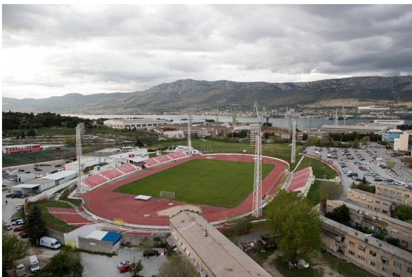
Slika 22 Atletski stadion Park Mladeži