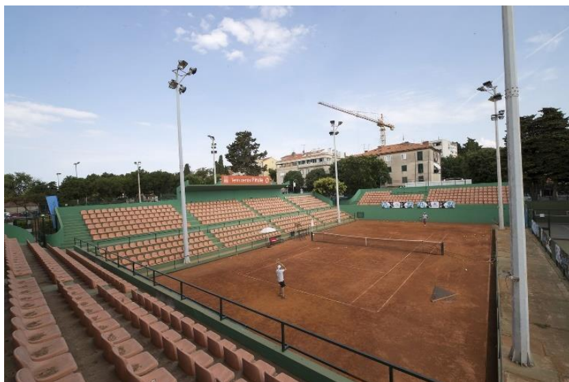
Slika 23 Teniski centar Firule

Atletski stadion Park mladeži organizira brojna atletska natjecanja od kojih su domaća i međunarodna prvenstva. Stadion je baza za treninge mnogih uspješnih i vrhunskih atletičara koji su postigli rezultate na olimpijskim i svjetskim prvenstvima.