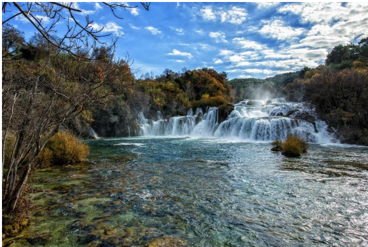
Slika 16 Skradinski buk, slapovi

Nacionalni park Krka kao što je već prije bilo navedeno, dom je za preko 200 vrsta ptica, uključujući rijetke i ugrožene vrste. Promatranje ptica isto je jedna od popularnih aktivnosti koja se često kombinira sa pješачenjem ili biciklizmom.