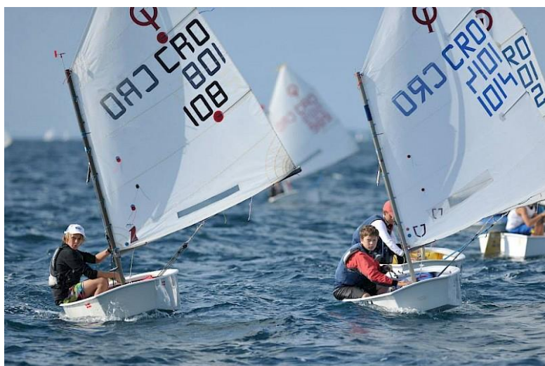
Slika 31 Dubrovačka regata

Trstenik, plovi se do grada Stona na južnom dijelu poluotoka Pelješac. Na šesti dan od grada Stona kreće se dalje prema otocima Jakljan i Šipan. Otoci također pripadaju elafitskom otočju i sadržavaju bogatu vegetaciju. Na zadnji, sedmi dan polazi se s otoka Šipan prema Dubrovniku gdje ujedno i završava sedmodnevna tura. U ovu rutu su se uvrstile najatraktivnije destinacije južne Dalmacije i Dubrovačko-neretvanske županije. Osim ove rute, popularne su i jedriličarske destinacije koje uključuju Cavtat, Dubrovnik s modernom marinom u Gružu koja je polazišna točka za mnoge rute od kojih neke čak vode i sjeverno prema Hvaru i Braču. Osim turističkih ruta koje su namijenjene zadovoljavanju turističkih potreba postoje i natjecanja koje privlače natjecateljske skupine za regate. „Jedriličarski klub Orsan svake godine organizira Dubrovačku regatu za klasu optimist. Regata se održava u Elafitskom akvatoriju i svake godine okuplja veliki broj natjecatelja iz svih jedriličarskih klubova Republike Hrvatske.” 71