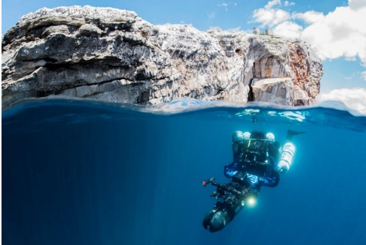
Slika 12 Nacionalni park Kornati

Murteru organiziraju tečajeve ronjenja, ali i izlete do atraktivnih ronilačkih lokacija. U nastavku su neki od najpopularnijih ronilačkih lokaliteta: