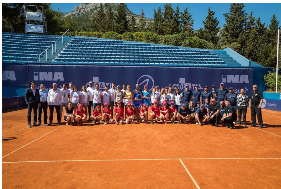
Slika 20 WTA Croatia Bol Open

WTA Croatian Bol Open: Je godišnji teniski turnir za žene na WTA Challenger Touru, koji se igrao u gradu Bolu na hrvatskom jadranskom otoku Braču. „Teniski turnir u Bolu na Braču davno je prešao hrvatske granice, turističku perjanicu otoka Brača pozicionirajući kao destinaciju s multiprofiliranim sadržajnim programom“. 47 Prvo izdanje turnira održano je krajem travnja 1991., a potom svake godine od 1995. do 2003. Turnir je tada prodan organizatorima Western & Southern Opena i preseljen u Cincinnati. Kasnije u 2016. do 2021. bio je opet organiziran u Bolu na otoku Braču. S time da je 2020. godina bila otkazana zbog pandemije COVID, a 2021. bila je posljednja godina jer se u 2022. godini premjestilo u Makarsku.