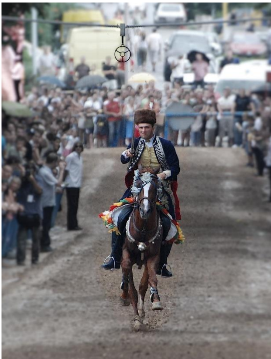
Slika 19 Sinjska Alka

Sinjska Alka: „Bitka junaštva, hrabrosti, snage, vještina, pokazatelj sigurne ruke, preciznog oka, slavlje naroda, pučka veselica.“ 45 Sinjska Alka je hrvatska viteška igra. Održava se svake godine u nedjelju prve trećine kolovoza u Sinju, na godišnjicu pobjede nad turskim osvajačima 14. kolovoza kojom je okončana opsada grada 1715. godine. U 2024. godini održava se 309. Sinjska alka. Viteška igra također utječe na dolazak turista jahača zbog zanimljivog sporta. Također mogu naučiti nešto o povijesti zemlje Hrvatske, kako su Hrvati se obranili od opsjede Turaka.