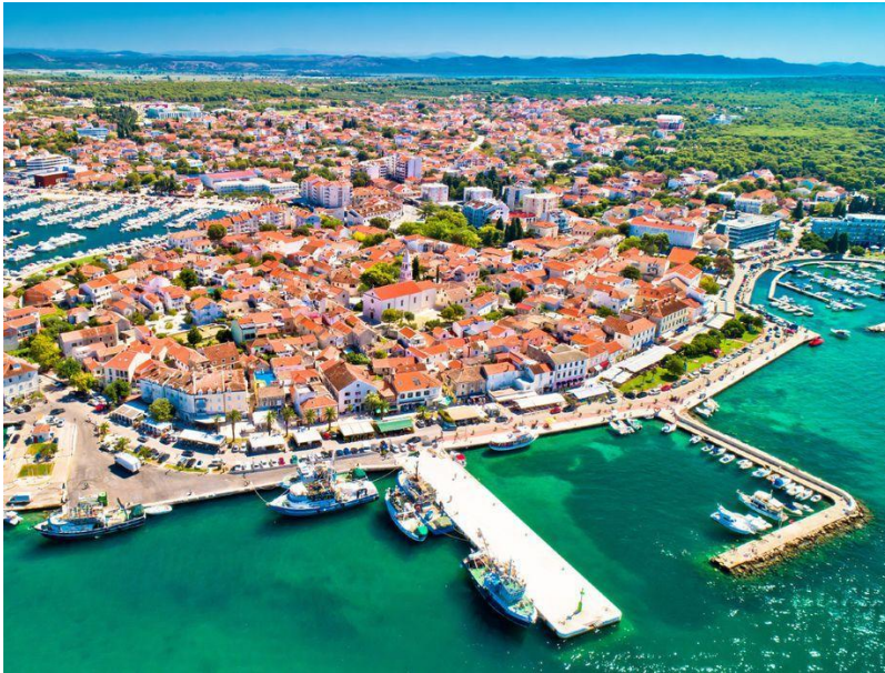
Slika 7 Biograd na Moru

posjećuju jedriličari iz cijeloga svijeta. Također turistička zajednica grada Biograda na Moru nudi izlete u Nacionalni park Paklenica gdje se može planinariti po planinarskim stazama te je to turistima planinarima veoma atraktivna aktivnost. Jedan od zanimljivih događaja u gradu je Triatlon „BiogradRUN“ koji okuplja natjecatelje iz cijelog svijeta i uključuje, plivanje, biciklizam i trčanje kroz prekrasne krajolike. „BiogradRUN je utrka koju organizira Triatlon klub Zadar, a pokrovitelj je Turistička zajednica grada Biograd na Moru s ciljem promocije grada, njegove turističke i sportsko rekreativne ponude.“ 23