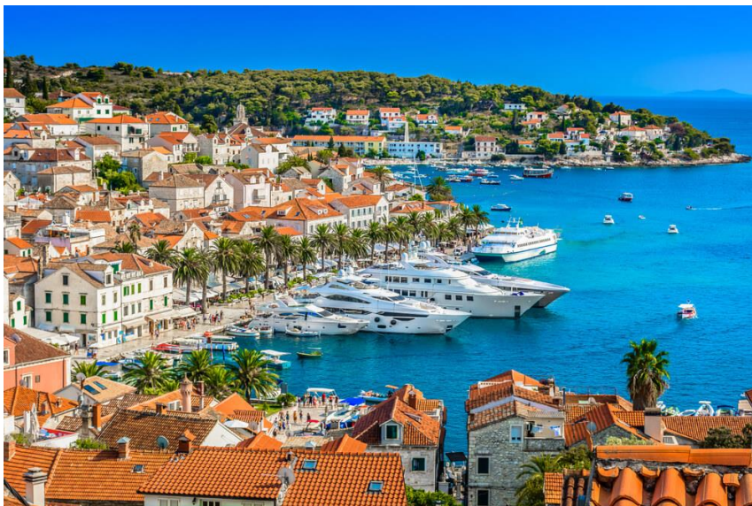
Slika 28 Otok Hvar