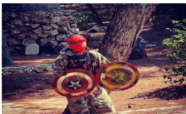
Slika 26 Paintball u Adventure Park Hvar Jelsa